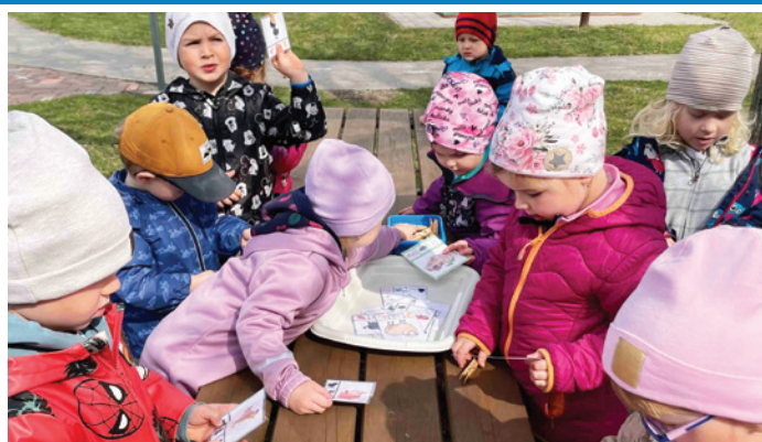
Děti z MATEŘSKÉ ŠKOLY se nemohly dočkat jara, přivítaly jej s velkou parádou a bohatým programem