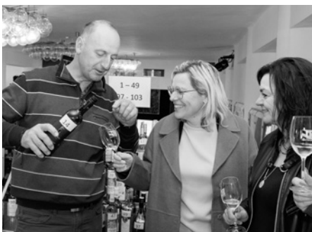
K vínu patří dobrá nálada a ta na letošním Velkopavlovickém koštu rozhodně nechyběla.