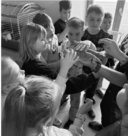
Děti zvířata milují. Možnost si je pohladit nikdy nepromarní.