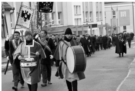
I letos se v našem městě sešli rytíři, hned z několika evropských zemí. Jejich průvod vždy budí pozornost.

Hosty slavnosti vítáme v Ekocentru Trkmanka, v sídle Legátu Morava. Za chladného počasí typického pro konec ledna čeká na sto třicet účastníků slavnosti pravá moravská zabijačka se spoustou pochoutek a pravou zabijačkovou polévkou, tradičními koláči a vínem. O hosty se vzorně starali dospělí členové kmene Vlků. K poslechu hrála místní dětská dechovka. Letošní slavnosti se zúčastnili nejen nejvyšší předsta-