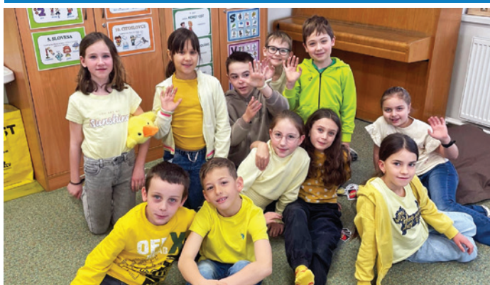
Velikonoční týden se stal na ZÁKLADNÍ ŠKOLE týdnem plným barev. Žlutá, barva jara jen zazářila.