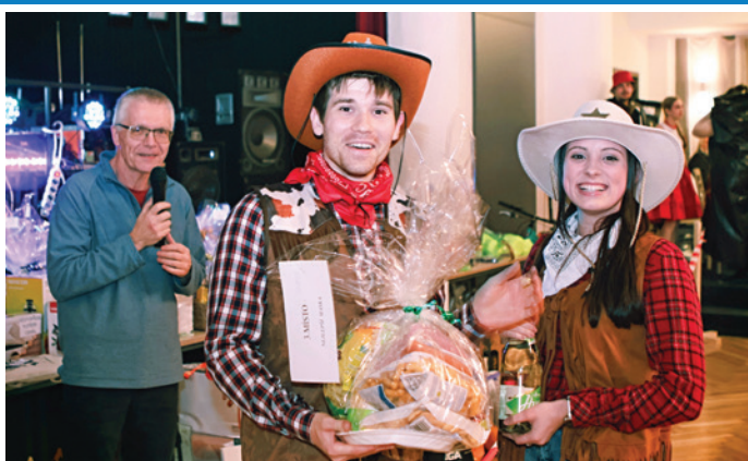
ŠIBŘINKY – Maškarní bál roku 2026 – skvělé masky, nápady a uvolněná nálada.