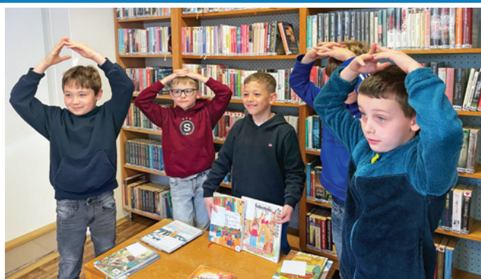
Čtenáři ze třetích tříd základní školy navštívili MĚSTSKOU KNIHOVNU, čekala tam na ně kniha Kočkopes Kvido