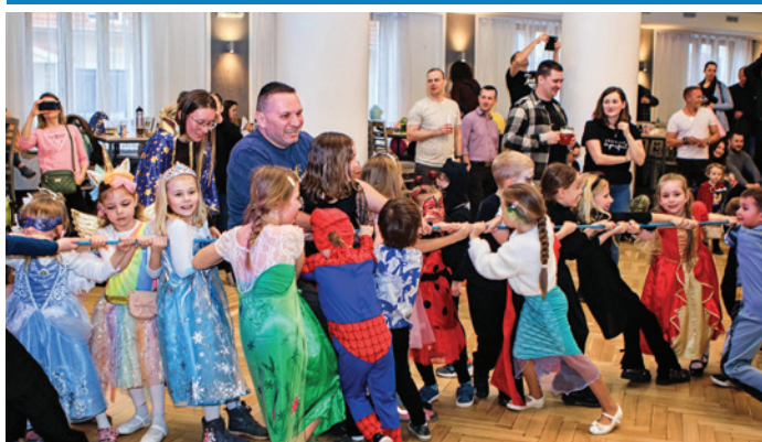
Místní hasiči uspořádali opět po roce jednu z nejoblíbenějších akcí pro naše nejmenší – DĚTSKOU MAŠKARNÍ DISKOTÉKU