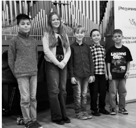
Naši malí recitátoři se ve velkém světě poezie neztratili. Jejich výkon porotu zaujal.