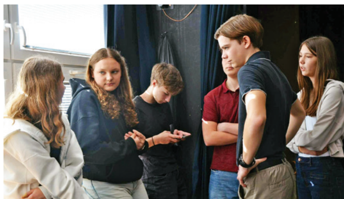
GYMNÁZIUM – Studenti vyrazili do SVČ Brno – Lužánky, zúčastnili se programu „Sdílim – nesdílim“