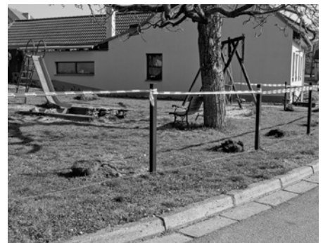
Dětské hřiště na ulici Čechova během budování nového plotu. Nyní je bezpečnější a těší se na nové certifikované prvky.