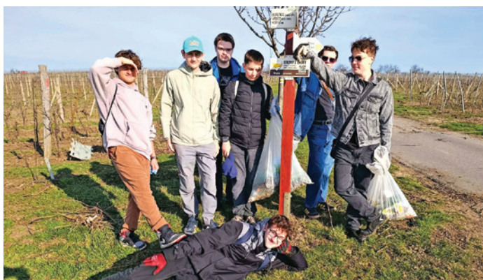
GYMNÁZIUM – Jarní den s třídním učitelem pojalí studenti pracovně, vydali se vysbírat odpadky okolo města