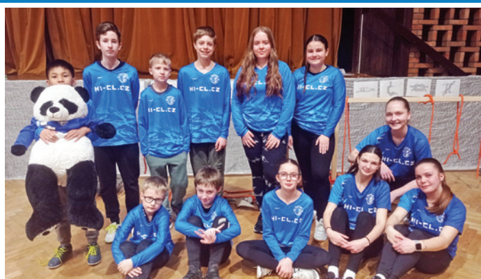
Halová sezóna našich MLADÝCH HASIČŮ ve znamení čísla 4 – 4 soutěže, 4 medaile

Spousty dalších fotografií ze všech akcí a pracovních aktivit ve městě najdete na oficiálních webových stránkách města Velké Pavlovice - www.velke-pavlovice.cz