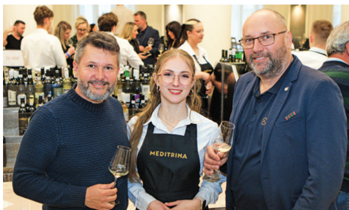
9. ročník mezinárodní exkluzivní soutěže vín hodnocených výhradně ženami MEDITRINA