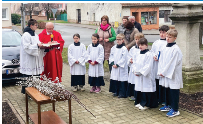
Velikonoční Květná neděle se svěcením kočíček před kostelem Nanebevzetí Panny Marie