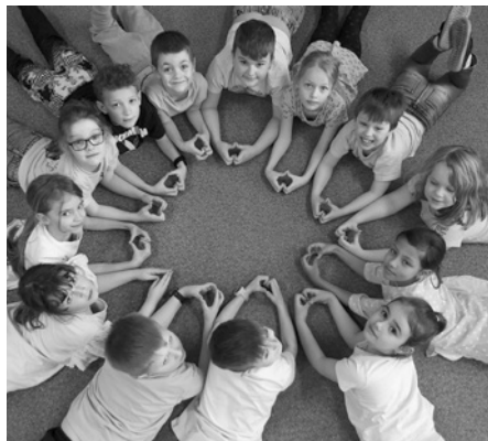
Předvelikonoční úterý patřilo žluté barvě, optimistickému a radostnému odstínu plné energie a radosti.

Týden jsme zahájili Modrým ponděním, kdy se chodby školy rozzářily různými odstíny modré. V úterý následovalo Žluté úterý, které se ukázalo jako opravdová výzva – ne každý má ve svém šatníku dostatek žluté, přesto se s tím většina popasovala se ctí a fantazií. Středa pak patřila kontrastům. Na prvním stupni převládla šedo-černá kombinace, která vytvořila zajímavou atmosféru, zatímco na druhém stupni se nesla ve znamení „středního míšmaše“. Ten dal prostor originalitě, nápaditosti a někdy i lehké