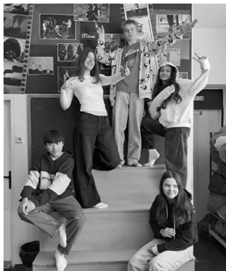
Oživlé obrazy z řecké mytologie nebo studenti sekundy? Obojí!

...tak zněl název programu, kterého se dne 9. března 2026 ve Středisku volného času LEGATO v brněnských Kohoutovicích zúčastnila třída sekunda našeho gymnázia. Jednalo se o dopoledne zaměřené na dramatickou výchovu. Pod vedením zkušeného lektora si studenti vyzkoušeli různé metody práce s dramatem, například živé obrazy.