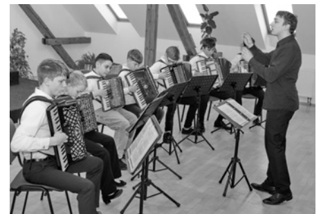
Na výměnném koncertě vystoupil i akordeonový soubor ze slovenské Senice. Úžasný zážitek!