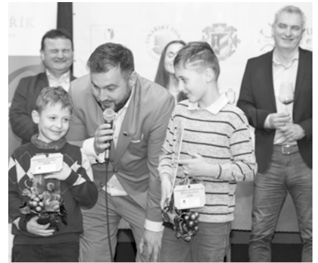
Práce ve vinařství je dlouhodobým projektem. Důležité je vychovat si zapálené a kvalitní nástupce. Jak vidno, tento záměr se daří.