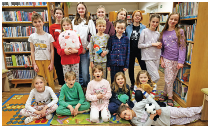
Městská knihovna uspořádala i letos přespávací akci pro děti NOC S ANDERSENEM