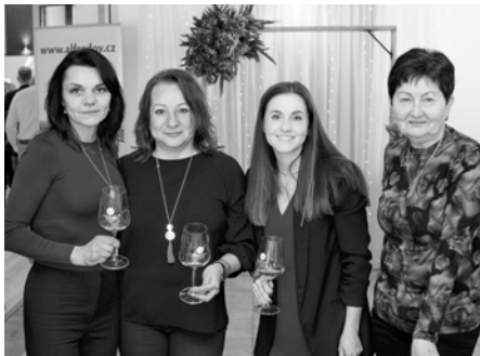
K lahodnému vínu patří ženy, krásné ženy... Vše je na jihu Moravy k máni.

Hodnocení vín proběhlo ve středu 11. února 2026 v Národním vinařském centru ve Valticích pod záštitou UNIE ENOLOGŮ ČR.