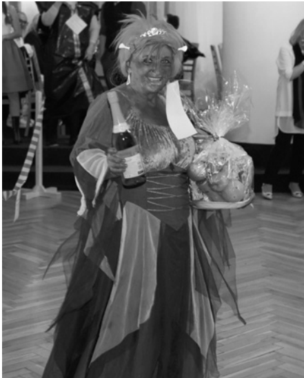
Fiona z oblíbené pohádky Shrek si odnesla ze Šibřinek roku 2026 zlato.

Po celkem vydařených ročnících 2023 a 2024 nastal v roce 2025 mírný pokles návštěvníků Maškarního plesu (at už platicích, ale také masek bylo méně).