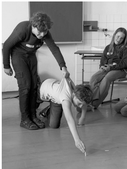
Ve dvou, či ještě lépe ve více, se to lépe táhne! Není nad to mít možnost se na druhé stoprocentně spolehnout.

Žáci šestých ročníků se zúčastnili preventivního programu na téma Třída jako tým, který pro ně uspořádala Společnost Podané ruce.