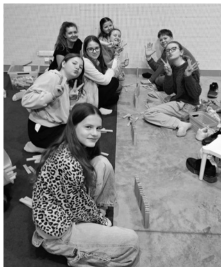
Kdo si hraje, nezlobí! Třeba v břeclavském muzeu na výstavě Retro hrátky.

Část studentů zůstala věrná našemu městu a podnikla vycházku po přírodě v okolí. Krásný den!