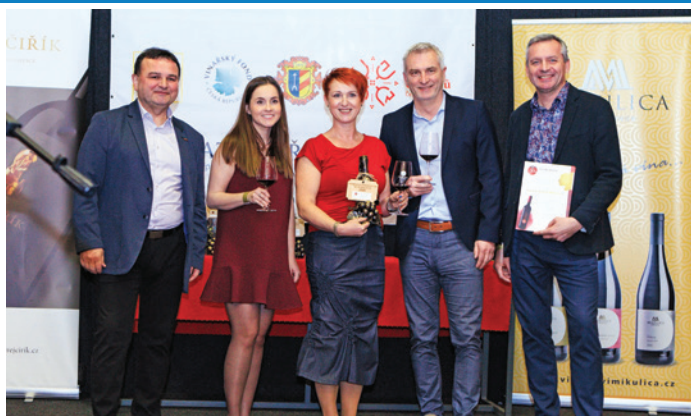
PROMÉNÁDA ČERVENÝCH VÍN roku 2026 – unikátní soutěžní přehlídka výhradně červených vín