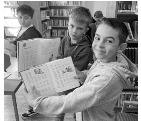
Pány kluky třetáky knížky z knihovny nadchly. Hned odpoledne si přišli vypůjčit některé z nich domů.

Žáci také nahlédli pod pokličku vzniku knihy. Dozvěděli se, jak se rodí nápad v hlavě spisovatele, jakou roli hrají ilustrace a co vše se musí stát v tiskárně, než se výtisk dostane ke čtenářům. Tento vzhled do zákulisí pomohl dětem pochopit, kolik práce a různých profesí se za každým příběhem skrývá.