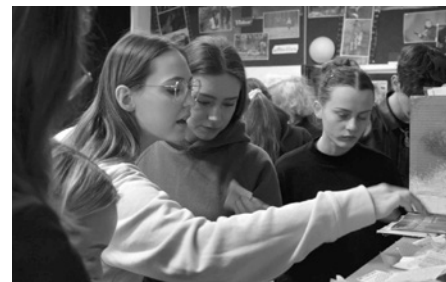
Média nás vtáhla do hry. Zkusili jsme si práci v redakci, uspořádali tiskovku a také si vzali na paškál neblahý fenomén dneška – fake news.

Dalším dílem byla „tiskovka“. Cílem bylo, aby zvolení účastníci napsali článek. Každá „redakce“ měla své cílové čtenáře. Časopisy byly určeny například pro dětské obecenstvo, pro ženy, pro módní guru.