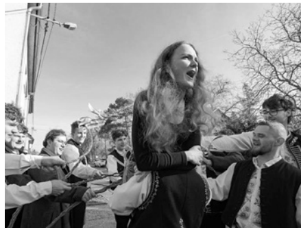
Velikonoční pomlázka zajistí dívkám zdraví a svěžest.

Zatímco v Pavlovicích panovala spokojenost, že pokorili krojované z nedalekých Němčiček, tam věděli své. Ulicemi obce totiž chodily dvě skupiny krojovaných. Jedna, tvořená staršími mládenčí, skutečně měla žilu kratší, než jakou