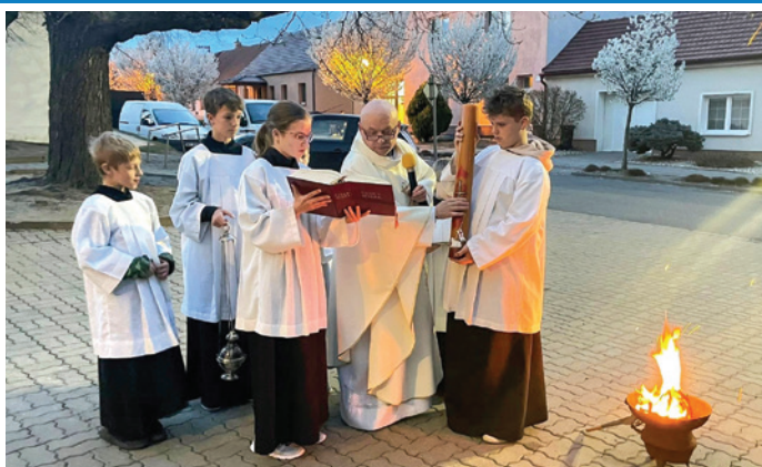
Večerní obřad o Květné neděli před kostelem – „Kristus vstal z mrtvých, aleluja!