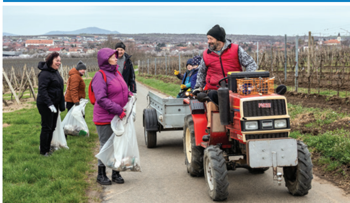
PŘÁTELE COUNTRY se pustili do Velkého jarního úklidu města, v rámci akce Uklidíme Česko