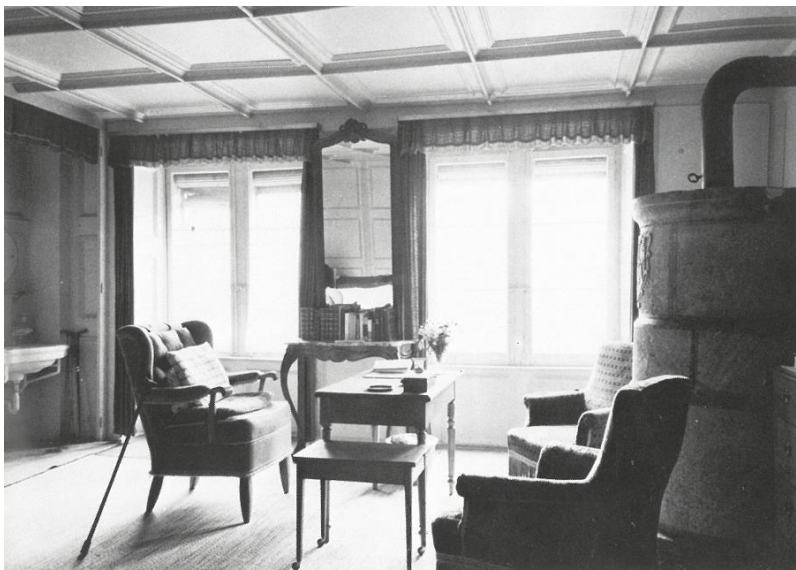
Pracovna Rudolfa Kassnera - Hotels Bellevue (BLATTER DER RILKE-GESELLSCHAFT – RILKE UND KASSNER, Thoerbecke 1989)

Přestože měl v letech 1918 -1 945 československé státní občanství, prožil zde jen menší část svého života, v letech 1921 -1944 nejraději bydlel ve Vídni. V roce 1945 se Kassner přestěhoval do Švýcarska.