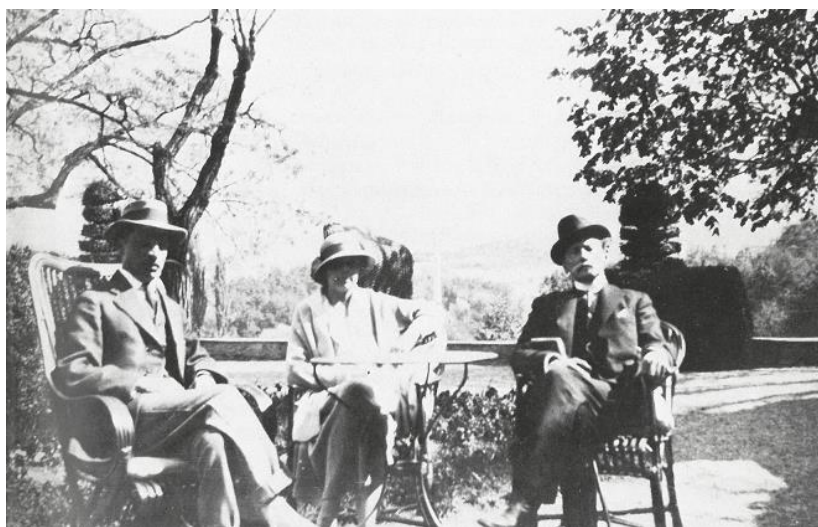
Rudolf Kassner a Rainer Maria Rilke – Terrasse Hotels Bellevue (BLATTER DER RILKE-GESELLSCHAFT – RILKE UND KASSNER, Thoerbecke 1989)

V roce 1902 se seznámil s Hugo von Hofmannsthalem a v roce 1907 s Rainerem Marií Rilkem a s Marií z Thurn-Taxisu, u níž pobývali na zámku v Loučeni u Nymburka. Spojovalo je celoživotní přátelství a s vedl s nimi korespondenci, vydanou po jejich smrti. Rainer Maria Rilke mu věnoval osmou duinskou elegii, spolu s Hugem von Hofmannsthalem považovali Kassnera občas za nejjasnovidnějšího kulturního filozofa tehdejší doby.