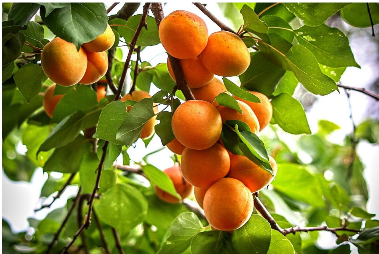
Meruňka – ovocný poklad našeho města.