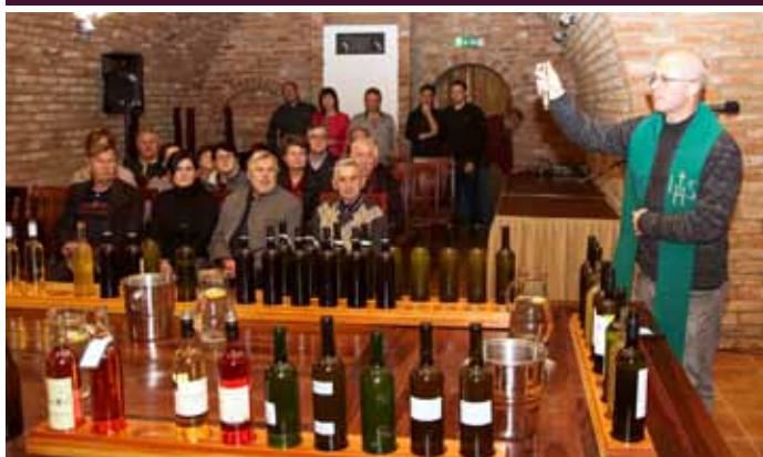
Žehnání mladého vína ročníku 2019 ve Vinných sklepech Františka Lotrinského