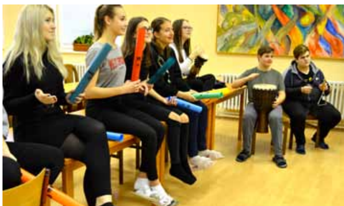
Den otevřených dveří na Gymnáziu Velké Pavovice