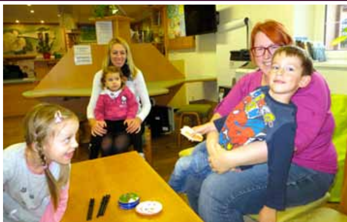
Setkání klubu nejmenších čtenářů RaČte s dětmi do knihovny s knížkou Zuzanka a ježeček