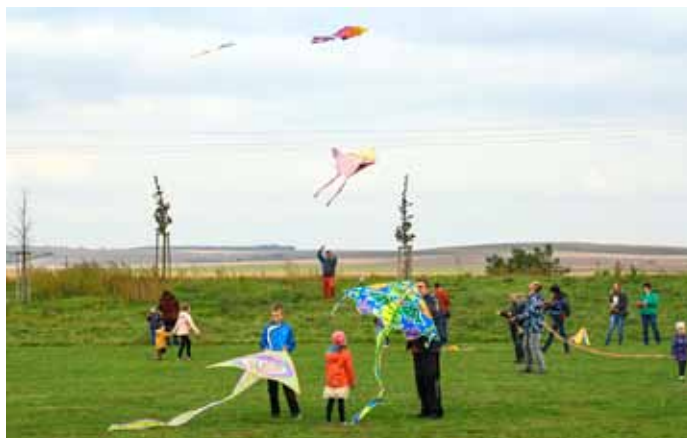
Drakiáda na louce u Zámeckého rybníka na ulici Nádražní