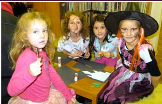
Halloweenské odpoledne se strašidly v Městské knihovně Velké Pavlovce