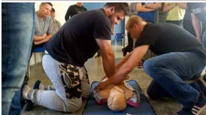
Školení členů Sboru dobrovolných hasičů Velké Pavlovice – používání nového automatizovaného externího defibrilátoru