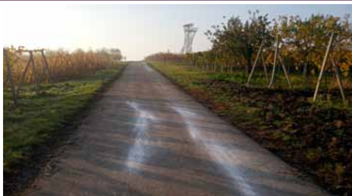
Oprava cyklostezky vedoucí k rozhledně Slunečná z dotace Jihomoravského kraje