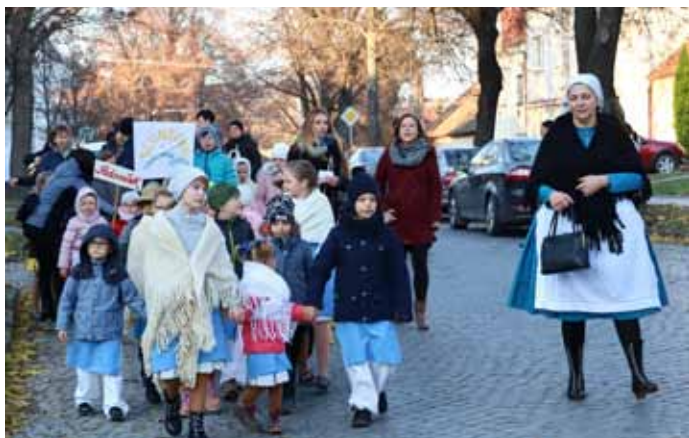
Dětské Kateřinské hodečky 2019, II. ročník