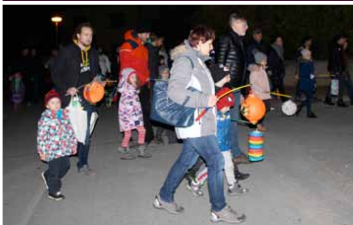
Lampionový průvod s hasiči při příležitosti oslav 30. výročí Sametové revoluce