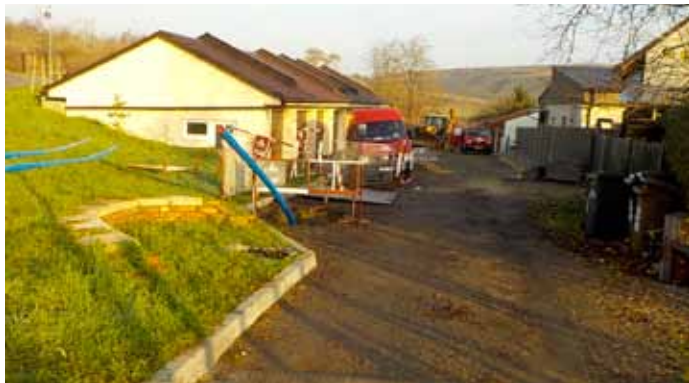
Zahájení opravy vodovodního řádu na ulici Trávníky