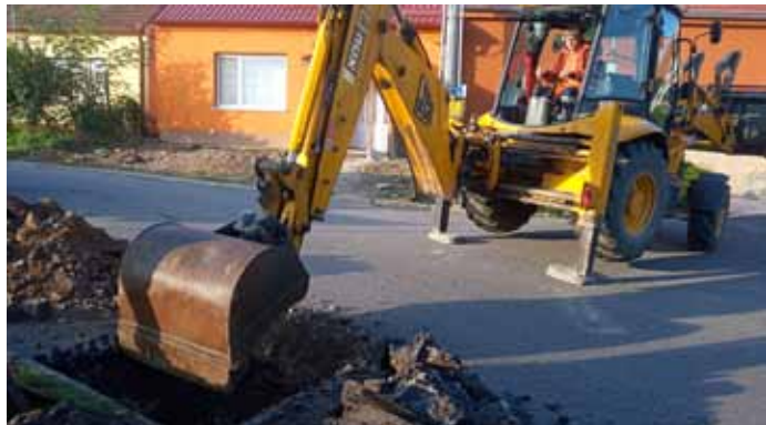
Oprava kanalizačních vpustí v ulicích města odbornou firmou STRABAG, a.s.

Spousty dalších fotografií ze všech akcí a pracovních aktivit ve městě najdete na oficiálních webových stránkách města Velké Pavlovice – www.velke-pavlovice.cz