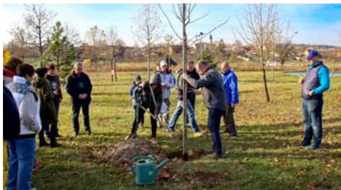
Výsadba oskeruše v parku u vlakové zastávky při příležitosti oslav Dne boje za svobodu a demokracii, 17. listopadu 2019