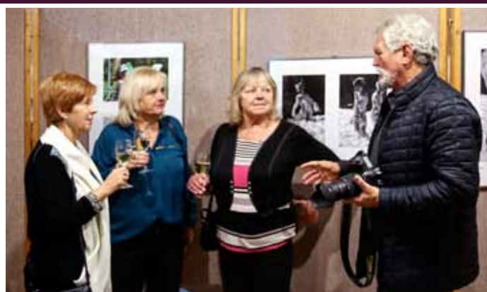
Vernisáž výstavy fotografií Lidé v pohybu na radnici města