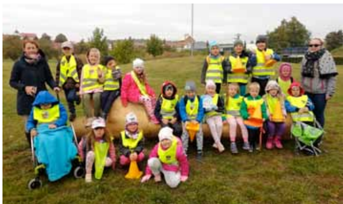
Děti z mateřinky se aktivně zúčastnily projektu Svět nekončí za vrátky, cvičíme se zvířátky