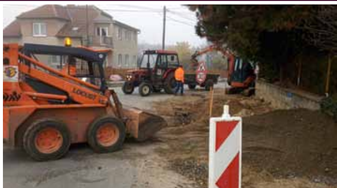
Oprava vodovodního řádu na ulici Nová