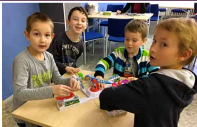
Deskové hry pro podzimní dny s Městskou knihovnu Velké Pavlovce