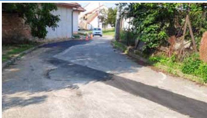
Ulice Tábor – opravy komunikací ve městě