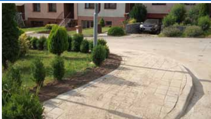
Ulice Zahradní – dokončení opravy chodníku

Spousty dalších fotografií ve všech akcí a pracovních aktivit ve městě najdete na oficiálních webových stránkách města Velké Pavlovice – www.velke-pavlovice.cz