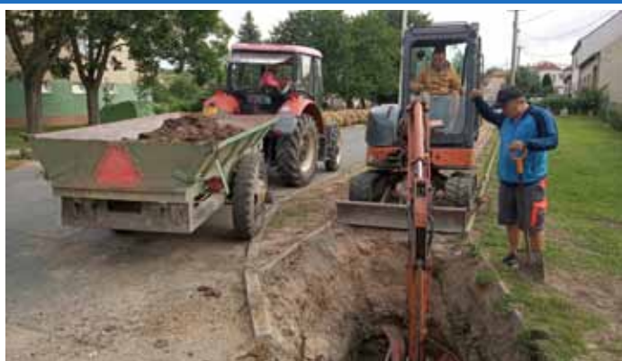
Ulice Herbenova – oprava vodovodního řádu a chodníku