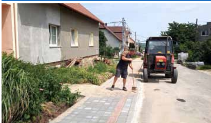
Ulice Zahradní – oprava chodníku