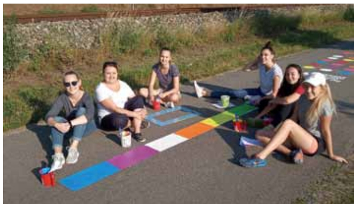
Brigádnice Města Velké Pavlovice nakreslily na cyklostezku u skateparku plány pohybových her nejen pro děti