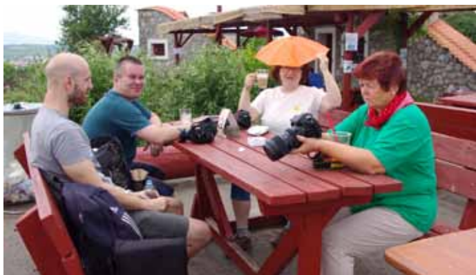
Fotografický workshop Lidé v pohybu, účastníci pod rozhlednou Slunečná