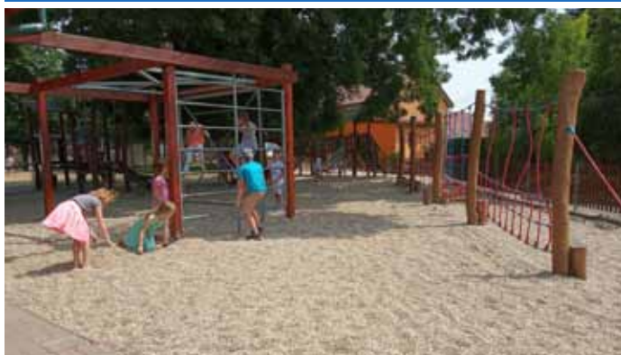
Říční kamínky ze Slovenska – nová bezpečná dopadová plocha na dětském hřišti za kostelem