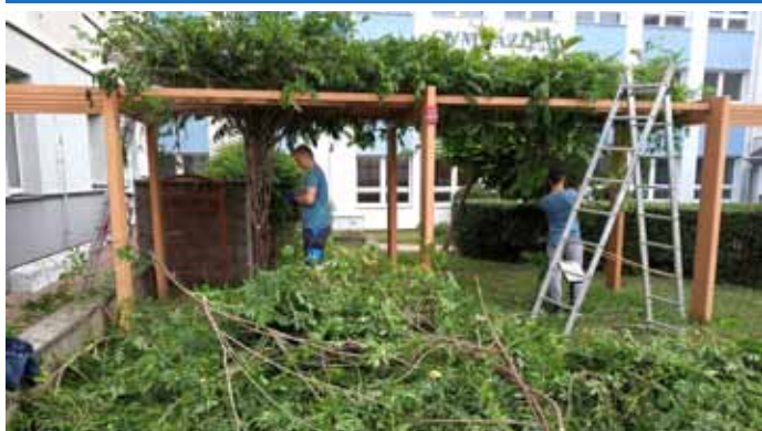
Úprava popínavých keřů a živého plotu na „kruháci“ před gymnáziem