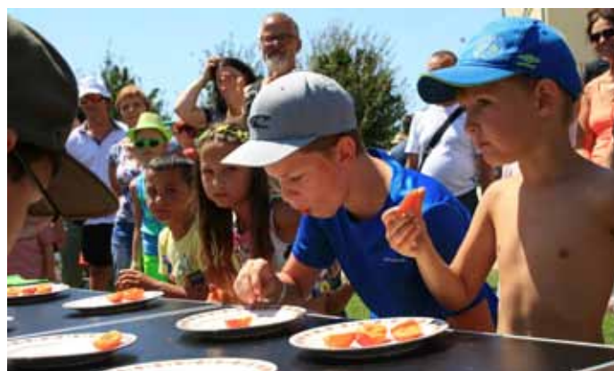
MERUŇKOBŘANÍ 2019 – IV. ročník