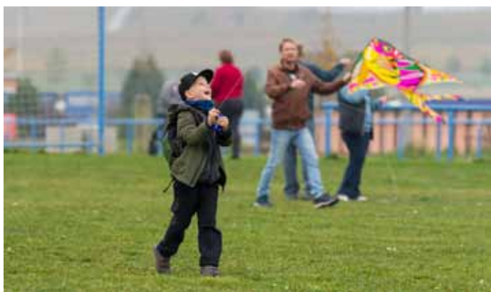
Podzimní Drakiáda na louce u zámeckého rybníka