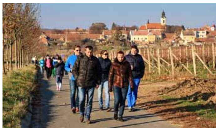
Podzimní šlapka 2019 – uzavření cykloturistické sezóny ve Velkých Pavlovicích