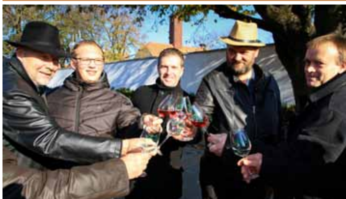
Svatomartinské otevřené sklepy 2018 – oslava mladého vína