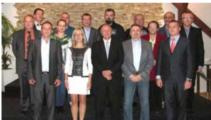
Nové zastupitelstvo města Velké Pavlovice pro volební období 2018–2022