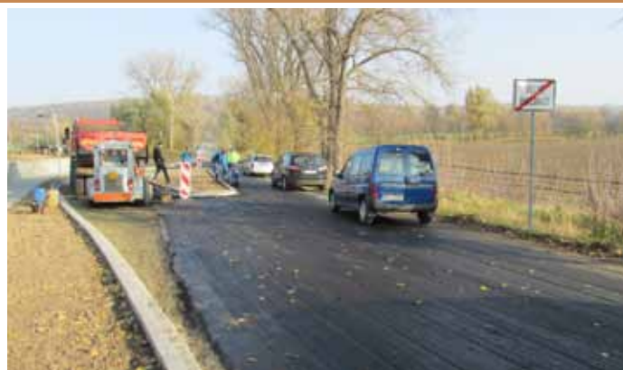
Budování zpomalovacího vjezdového ostrůvku v ulici Pod Břehy