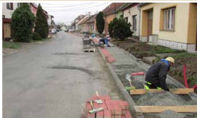
Generální rekonstrukce chodníku v ulici Zelnice