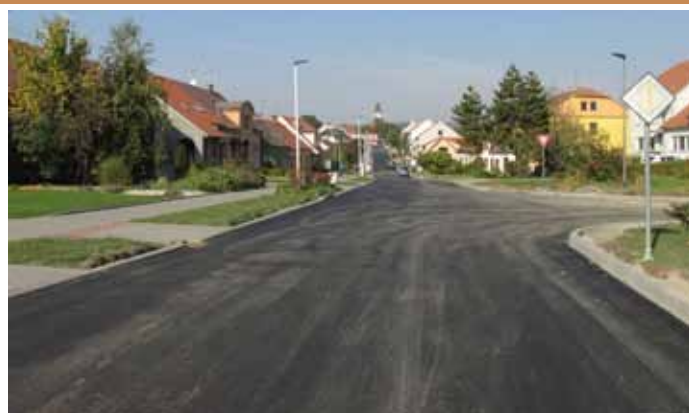
Nový asfaltový povrch na vozovce v ulici Dlouhá