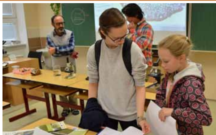
Listopadový Den otevřených dveří na gymnáziu