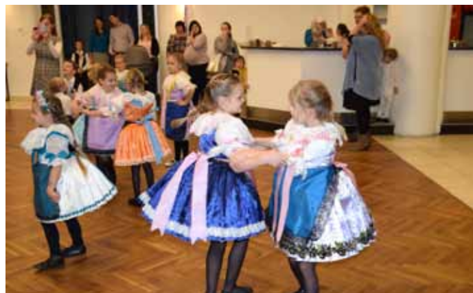
Kateřinské hodečky, II. ročník