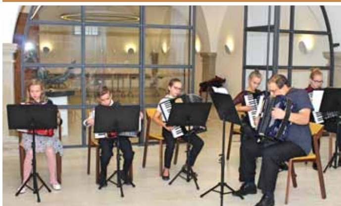
Koncert žáků a učitelů ZUŠ uspořádaný k příležitosti oslav 100. výročí vzniku Československé republiky