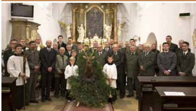
Slavnostní Svatohubertská mše s trubači OMS Přerov a mužským pěveckým sborem VOX VINI z Dolních Bojanovic