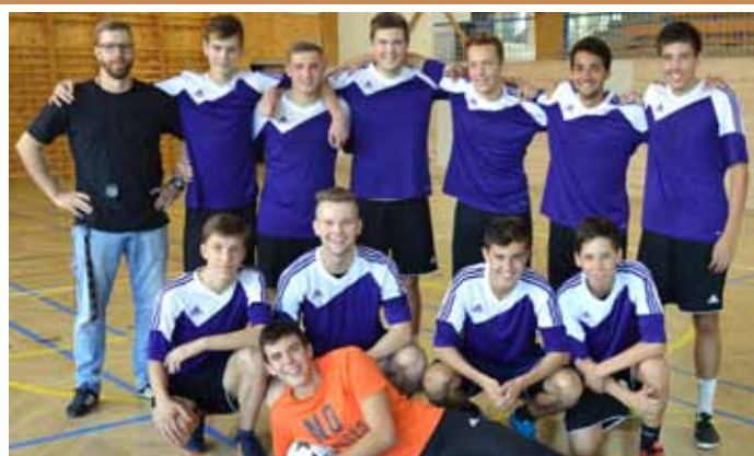
Tým Gymnázia Velké Pavlovice, vítěz fotbalového turnaje v malé kopané o Putovní pohár starosty města