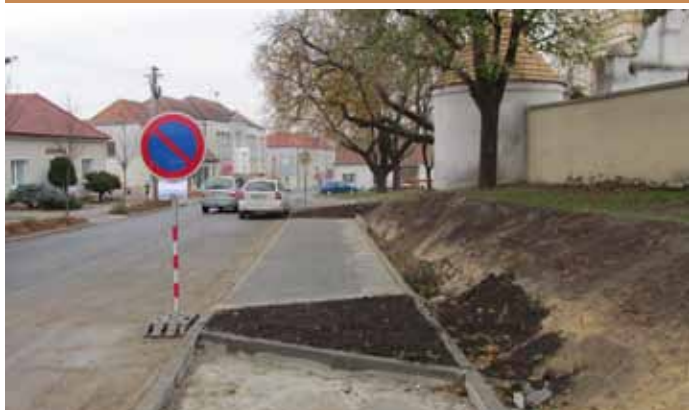
Nová podélná parkovací stání mezi hasičskou zbrojnicí a kostelem na Nám. 9. května