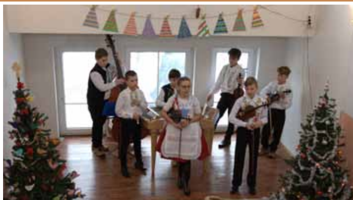
Dětská cimbalová muzika Palička na Dnu otevřených dveří ZŠ V. Pavlovice