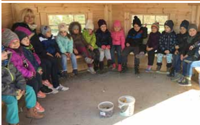
Děti ze školky se vydaly vyzkoušet nový altán v parčíku u vlakové zastávky, který zde vybudoval Velkopavlovický okrašlovací spolek