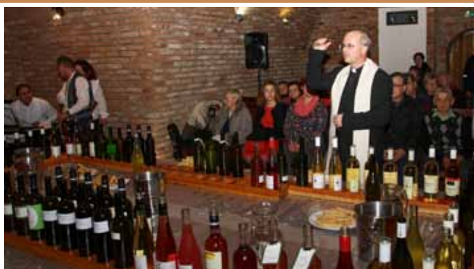
Svěcení mladého vína ročníku 2018 ve Vinných sklepech Františka Lotrinského