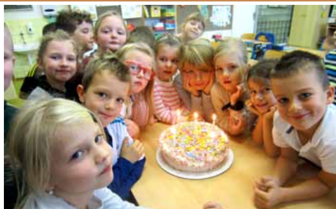
Slavnost slabikáře na ZŠ, prvňáčci dostali svou první knihu, kterou si sami přečtou