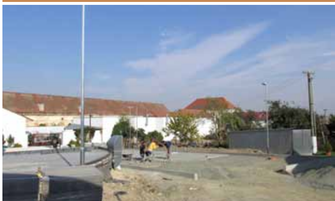
Nové veřejné osvětlení v ulici Tovární