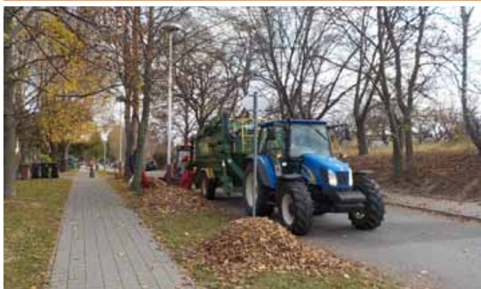
Služby města svážejí rostlinný odpad – spadané listí na ulici Bří Mrštílků