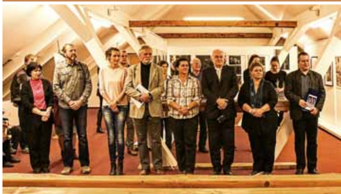
Vernisáž výstavy fotografií 3ZASTAVENÍ ve slovenské Senici