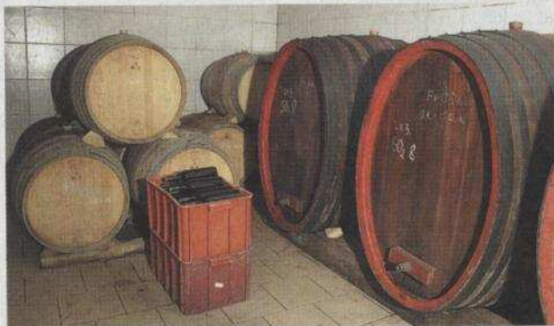
Vino zatím čeká v sudech, už brzy ale nabídne první vzorky.

V praxi je to dnes jednoduché. Na radnici si koupíte za tři stovky vstupenku a zároveň dostanete mapku s vyznačenými sklepy, vinný lístek, na němž je uvedeno, kde se co nabízí, a pak také skleničku, abyste mohli správně degustovat.