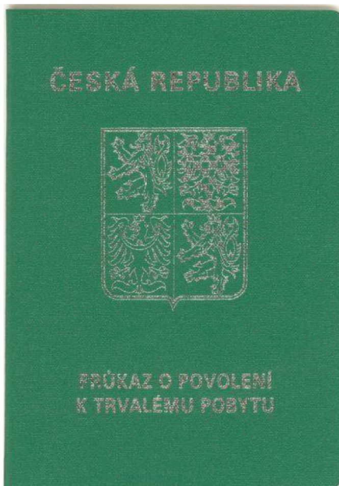
Přední strana dokladu (tmavě zelený doklad ve formě knížky, stříbrný tisk na přední straně)

Doklad o povolení k trvalému pobytu rodinného příslušníka občana EU a (od 1. 1. 2018) vydáván také jako doklad o povolení k trvalému pobytu občanů EU a také občanů Islandu, Lichtenštejnska, Norska a Švýcarska a jejich rodinným příslušníkům.