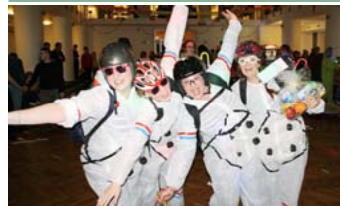
Šibřinky aneb Maškarní bál – nejveselejší ples sezóny