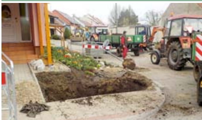
Rekonstrukce vodovodního řadu na ulici Trávníky