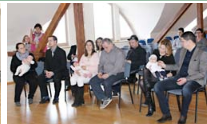
Únorový slavnostní obřad „Vítání občánků“ na radnici města