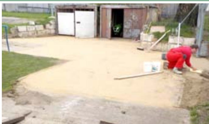
Budování nových parkovacích ploch v areálu TJ Slavoj