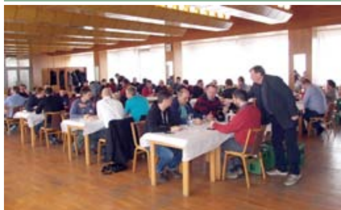
Jubilejní 55. ročník Výstavy vín ČZS Velké Pavlovice: Bodování přihlášených vzorků vín