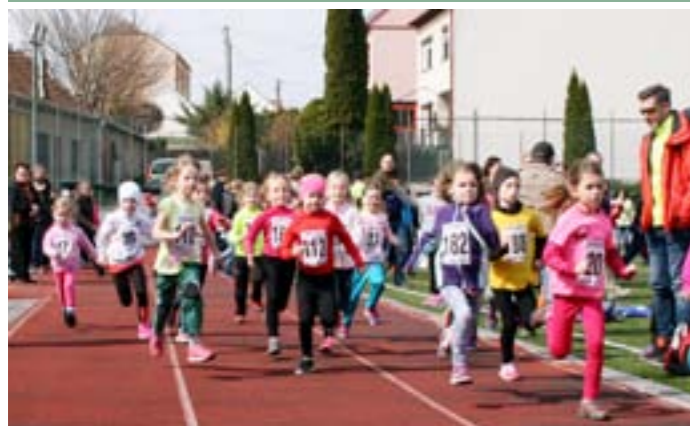
II. ročník Běhu o Velkopavlovickou meruňku: Závodů dětských kategorií na stadionu za školou