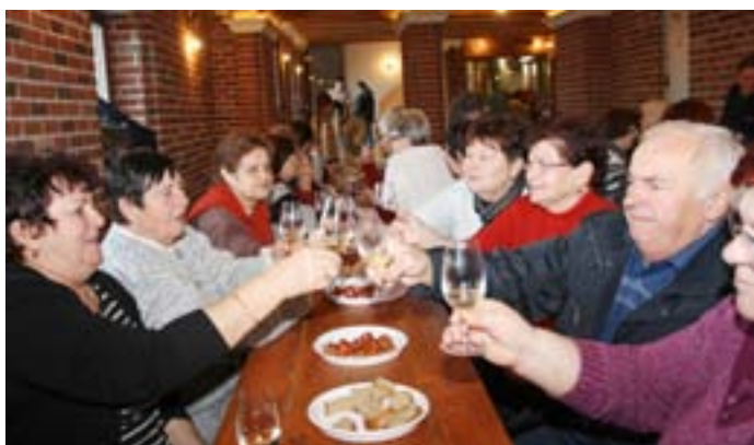
Klub důchodců na exkurzi ve Vinařství Baloun v Hustopečích