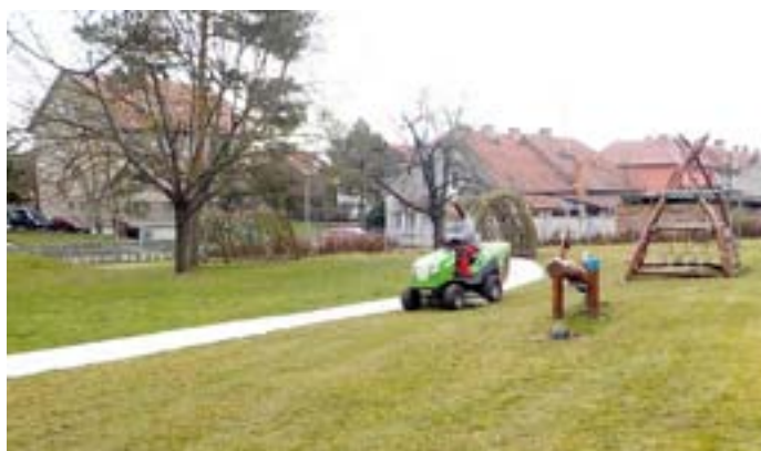
Příprava zahrady mateřské školy pro nadcházející letní sezónu