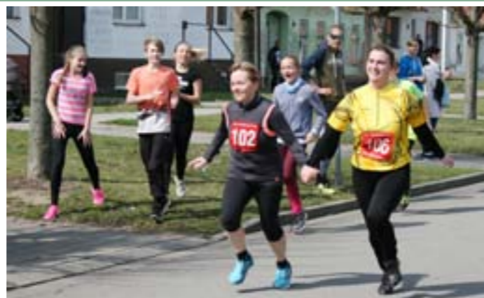
II. ročník Běhu o Velkopavlovickou meruňku: Finiš hlavního závodu na náměstí u radnice