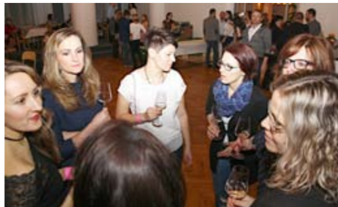
Meditrina 2017, III. ročník ryze ženské vinařské soutěže