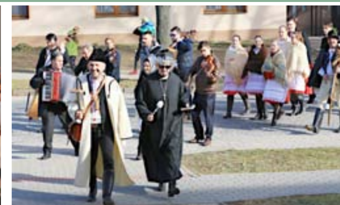
III. ročník Velkopavlovických ostatků: Masopustní průvod a veselí v ulicích města