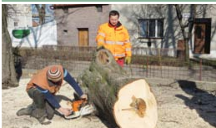
Kácení nemocných kaštanů u sokolovny