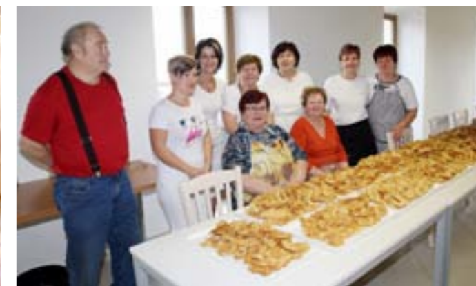
Příprava „Božích milostí“ na Velkopavlovické ostatky