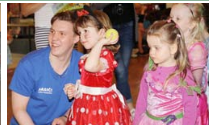
Dětská maškarní diskotéka plná her a radosti