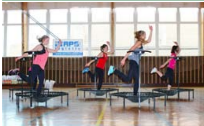
II. ročník Běhu o Velkopavlovickou meruňku: Vystoupení jumperek Jumpingu Velké Pavlovice