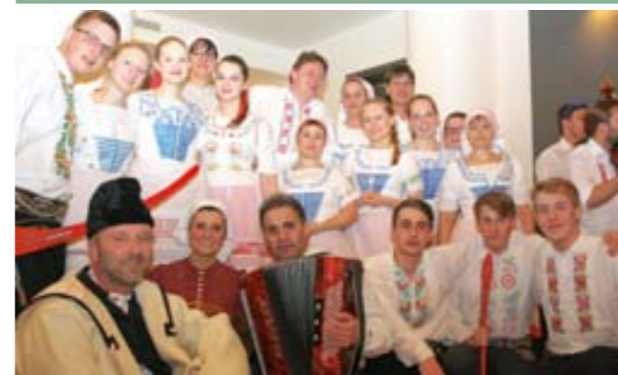
III. ročník Velkopavlovických ostatků: Krojování z Hanáckoslováckého krúžku