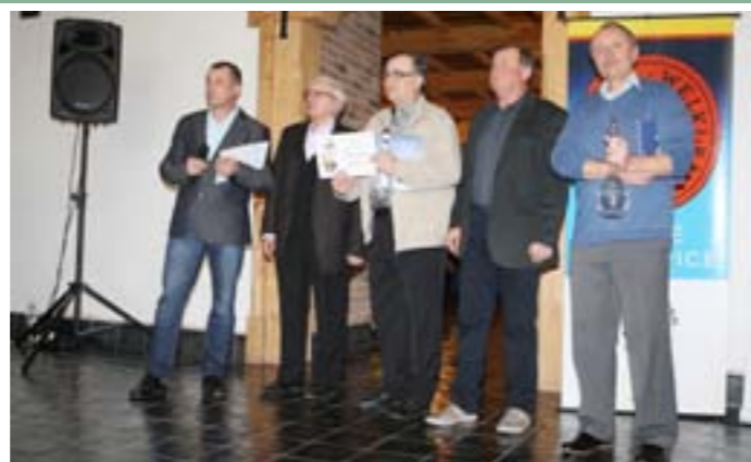
Jubilejní 55. ročník Výstavy vín ČZS Velké Pavlovice: Předávání cen vítězům přehlídky vín ve Vinařství Baloun