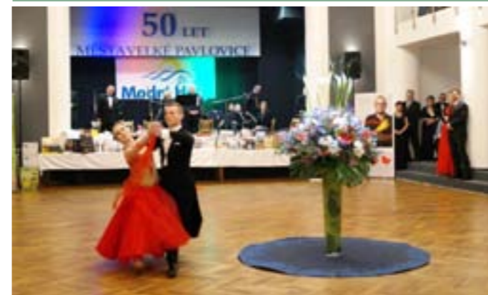
XI. ročník společenského plesu Modrých Hor