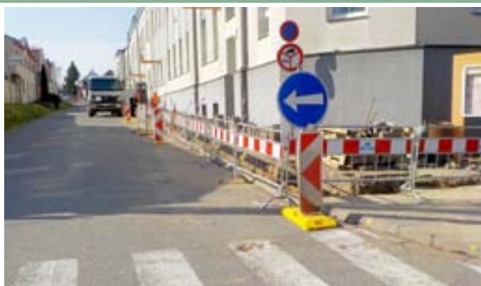
Rekonstrukce vodovodního řadu před budovami základní školy a gymnázia