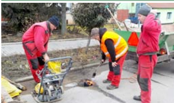
Oprava výtluků na ulici Dlouhá