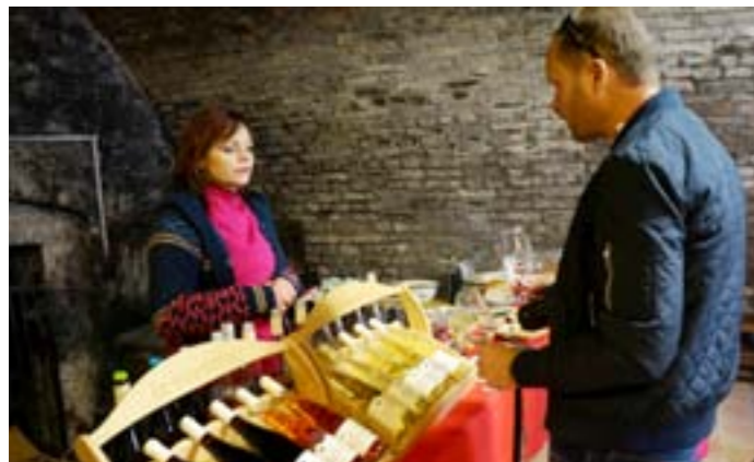
„Otevřené sklepy Modrých Hor“ nabízely víno z pěti obcí, Velkých Pavlovic, Bořetic, Němčiček, Kobylí a Vrbsice