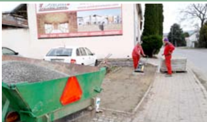
Výstavba odstavných ploch pro kontejnery na třídění odpadu

Spoustu dalších fotografií ze všech akcí a pracovních aktivit ve městě najdete na oficiálních webových stránkách města Velké Pavlovice – www.velke-pavlovice.cz