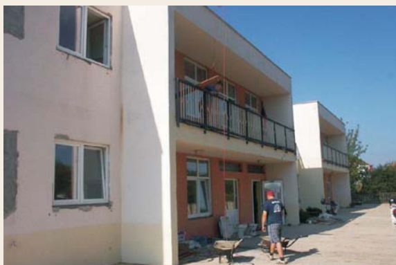
Zahájení oprav MŠ