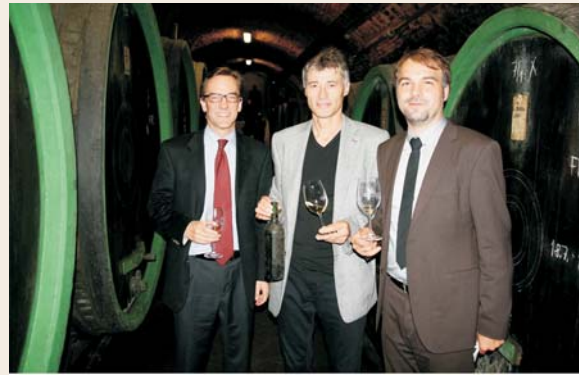
Návštěva zástupce velvyslance USA