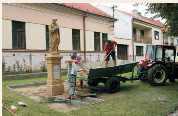
Dokončení zahrádky u sochy sv. Josefa před farou