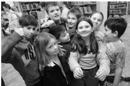
Noc s Andersenem není pouze o knihách a nocování v knihovně, ale také o navazování a utužování přátelství mezi dětmi.

Pak už nocležníci zamířili do pyžam a do spacáků a při poslechu Andersenovy Sněhové královny upadali pomalu či rychle do říše snů. Někteří „držáci“ samozřejmě štěbetali dlouho po půlnoci... A po necelých šesti hodinách se už trousili první probudivší. Více či méně probuzené děti si daly rozcvičku i s knihou, spo-