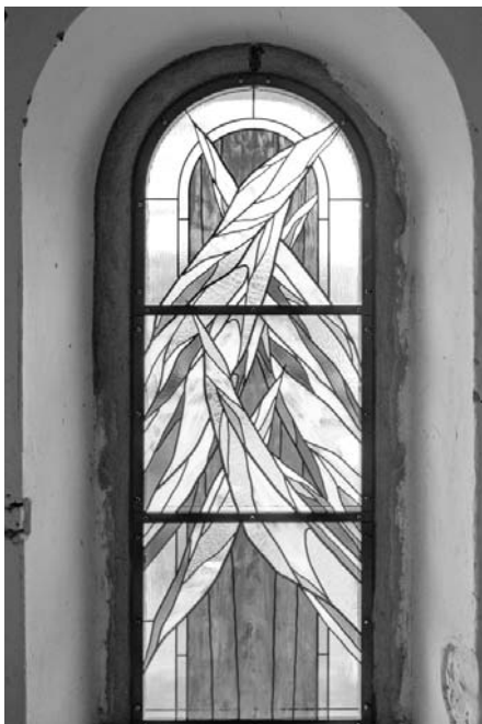
Vitráž s názvem Navštívení.