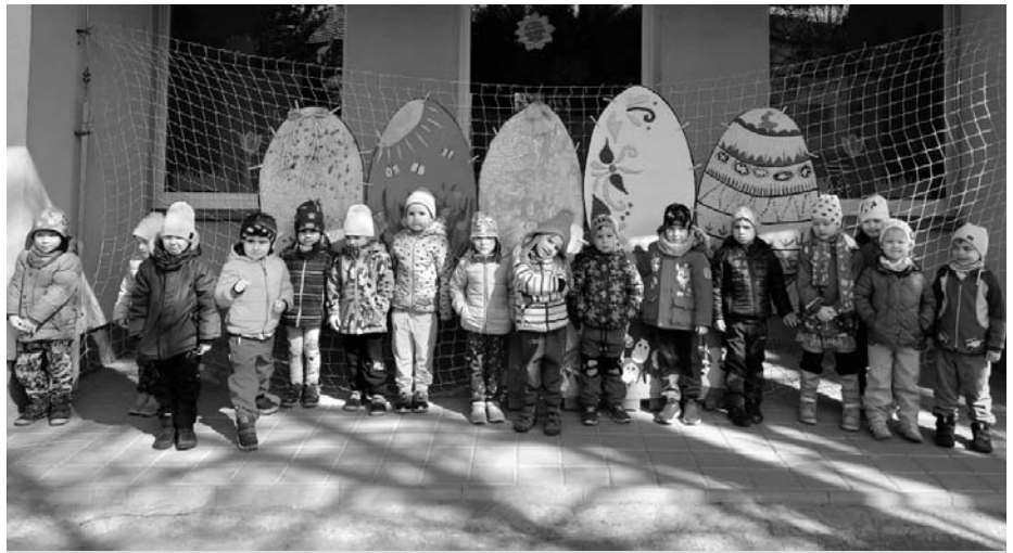
K jaru patří Velikonoce, k Velikonocím zajíčky a k nim v naší školce patří i Zajíčkova stezka.

Kolektiv pedagogických pracovníků MŠ V. Pavlovice