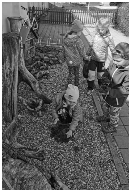
Není nad to přiložit ruku k dílu. A proto i dětičky aktivně vrátily život jejich školkové zahradě.

Pro děti předškolního věku je také důležitá kreativita, spolupráce, komunikace, kosmopolitní myšlení a důvěra. Děti budou mít možnost o vytvořený ekoprostor pečovat, upravovat ho či doplňovat tak, aby byl pro jeho obyvatele co nejvíce přirozený. Dále je důleži-