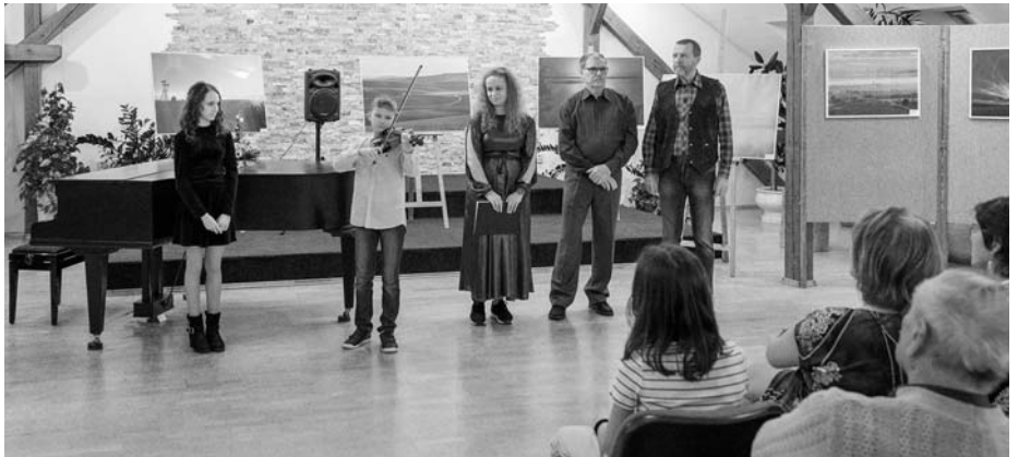
Zahájení vernisáže vždy patří kulturnímu programu, tentokrát jsme se zaposlouchali do příjemných tónů klavíru a houslí.