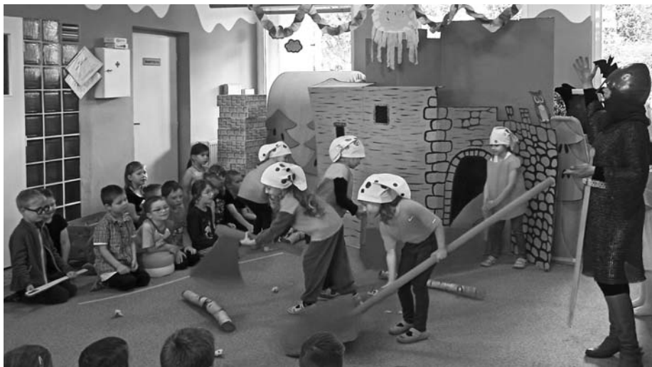
Skřítkové tesaři vylezte z mechu. Chopte se náčiní, postavte střechu...

Kolektiv pedagogických pracovníků MŠ V. Pavlovice