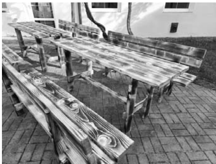
Nové posezení na dvorku infocentra a knihovny.

Už se těšíme, až se nám zazelená pergola nad novými lavicemi a stoly, vytvoří příjemný stín a toto vlídné, krásné a velmi vkusné posezení bude lákat naše návštěvníky, turisty i čtenáře, k chvilce zastavení a odpočinku.