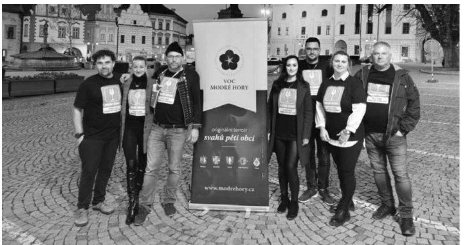
Jihomoravské Modré Hory ovínily jihočeský Tábor.

Po patnácté hodině se počasí umoudřilo a v uličkách kolem náměstí bylo vidět samé usměvavé tváře spokojených návštěvníků. Všichni vinaři hodnotili putování za velmi zdařilé. Přenesli do Tábora svoji tradiční pohostinnost, hýčkali své příznivce skvělými víny i pohodovou atmosférou. A byli moc potěšeni zájmem o vína včetně širokých enozna-