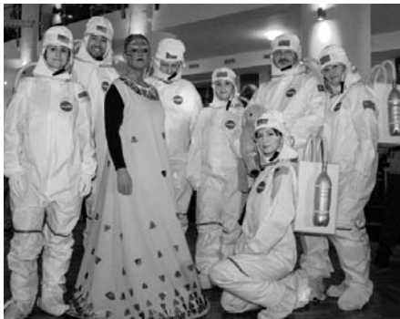
Mimozemšťanka spolu s NASA týmem – vítězka kategorie jednotlivců.