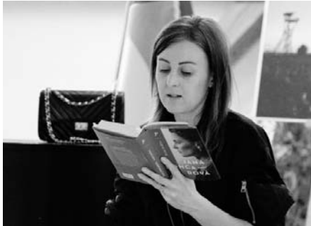
Spisovatelka a novinářka Jana Poncarová přijela za svými čtenáři na jih Moravy z dalekého Domažlicka.

Dvě hodiny velmi příjemně uplynuly nejen vyprávěním, ale také čtením úryvků z románu a pak už nastal prostor pro podepisování knih, které si návštěvnice hojně přinesly nebo zakoupily na místě. Dvě návštěvnice dokonce