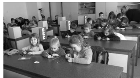
Že je fyzika nuda? Říká kdo? Fyzika je totiž věda plná kouzel a překvapení.

směr. Dále si vyrobily pomůcku pro optický klam. Ta spočívala vybarvením dvoubarevného terčíku, který po roztočení na špejli působil efektem jedné barvy.