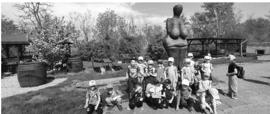
Děti ze školky zavítaly do Dolních Věstonic. Byl by hřích se nezvěčnit u sochy Věstonické Venuše, která tuto maličkou vesničku proslavila po celém světě.

Třída Kofátek naší velkopavlovické mateřinky se v pátek 12. dubna 2024 vypravila na výlet do Archeoparku v Pavlově. Výletu předcházela týdenní plán věnovaný době kamenné. Děti si vyzkoušely vymodelovat z hlíny misky, malovaly jeskynní malby a při odpočinku jsme společně poslouchali napínavé příběhy o Kopčemovi, mladém lovcu mamutů.