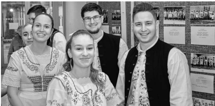
Nedílnou součástí letošního Srazu stárků byla výstava historických i současných fotografií z konání hodů. Se zájmem si ji prohlédla i právě úřadující chasa.