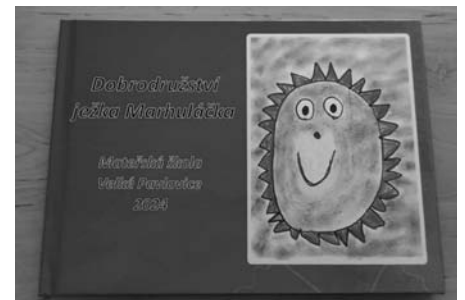
Kniha dětí a paní učitelek z naší školky. Skutečný příběh o ježekovi, kterého děti našly a zachránily.