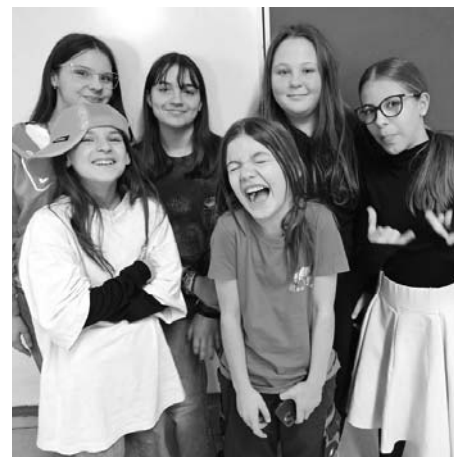
Do školy v outfitu jako naše mámy či dědové! A že nám to seklo?