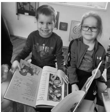
Čtení a knihy jsou úžasná zábava plná fantastických příběhů. A vůbec nezáleží, jestli už umíte či neumíte číst.

Kolektiv pedagogických pracovníků MŠ V. Pavlovice