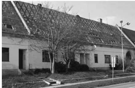
Zahájení demolicí areálu bývalého velkopavlovického statku – březen roku 2024.

Podobně se vyjádřil i jednatel společnosti Lekvi Development Firaz Muinov. „Momentálně finalizujeme všechny procesy a máme před sebou ještě nezodpovězené otázky, které mu-