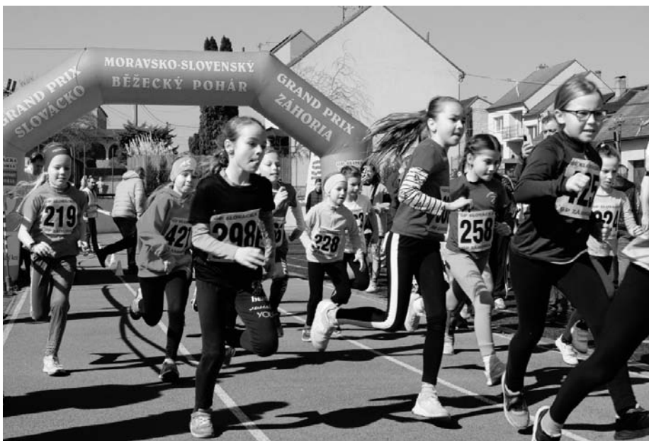
Radost z pohybu! A hlavně si to užít. Přesně tak to má být...

...za druhé – s výše popsaným souvisí prodloužení obou tras hlavního závodu, 8,5 km (Muži) a 5,5 km (Ženy a muži nad 70 let) a mírná úprava trasy městem – ze stadionu to bylo holt do cíle o půl kilometru dál. Trasa byla perfektně už den předem vyznačena, po trati se pohybovalo několik zodpovědných