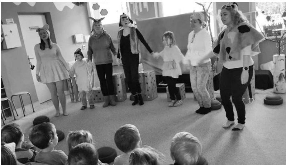
Školka plná ale úplně popletených zvířátek! Veselá pohádka, kterou dětem zahrály paní učitelky.

Kolektiv pedagogických pracovníků MŠ V. Pavlovic