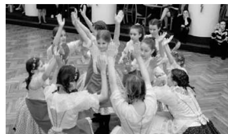
Příjemné odpoledne zpestřil svým vystoupením místní folklorní krúžek Floriánek. Z jejich nadšení z tance a zpěvu usuzujeme, že u nás se o udržení tradic obávat prozatím nemusíme.

spoustu elánu a sil, a hlavně – ať se nevzdáváme. I když jsou již ve starším věku, ubezpečili nás, že se budou těšit na pokračování. Jsme si vědomi, že představy a cíle do budoucna máme odvážné, ale již nyní máme další nové dobrovolníky, kteří přislíbili navázat spolupráci s komisí a mají chuť do práce. Proto věříme, že když naše cíle nevzdáme, tak se nám společně „u nás doma,