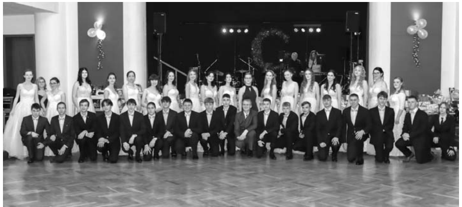
Studentský ples Gymnázia Velké Pavlovic vždy organizují a polonézu ve svátečních róbách tančí studenti třetích ročníků.

Po vydání cen přišlo na řadu všemi očekávané půlnoční překvapení. Nejprve v podání třídy 3. A na téma „Největší showman“, po ní se předvedla septima s ukázkou nejznámějších tanců, jako je country, macarena, Y.M.C.A.