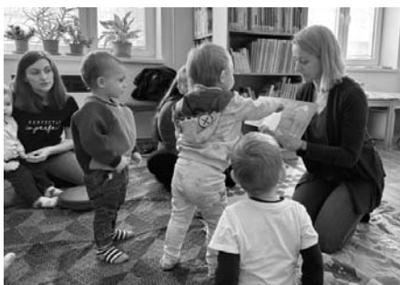
Písmenka sice ještě neznáme a číst neumíme, ale knížky máme rády už teď. Jsou barevné a plné obrázků, a to se nám moc líbí.

Již pravidelné setkání klubu Račte s dětmi do knihovny nemohlo samozřejmě chybět ani