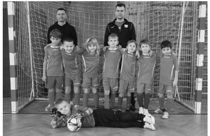
Mladší příprava U9 TJ Slavoj Velké Pavlovice obsadila ve své kategorii pátou příčku.

V posledním únorovém víkendu se uskutečnily ve sportovní hale při ZŠ ve Velkých Pavlovicích další z turnajů fotbalových přípravek.