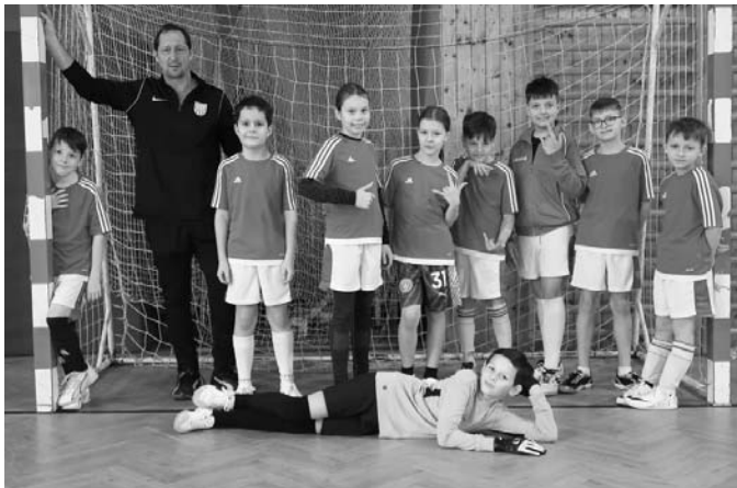
Starší příprava U11 TJ Slavoj Velké Pavlovice ve své kategorii nenašla konkurenci a zaslouženě zvítězila.