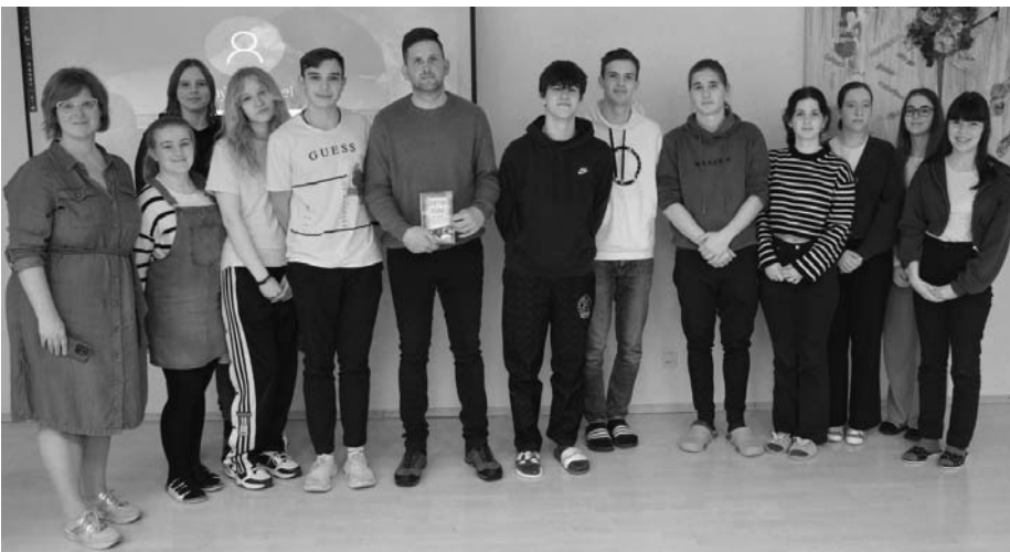
Studenti se vyfotografovali se spisovatelem Štěpánem Javůrkem.

Velmi si vážím toho, co pan Javůrek dělá pro oblast Krušných hor, ale i tak nějak pro pří-