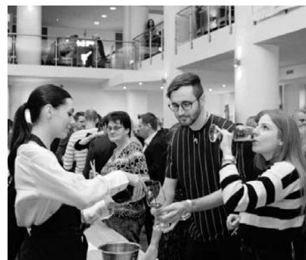
Velkopavlovická Promenáda je unikátní přehlídka výhradně červených vín, což potvrdila i neuvěřitelná účast. Sokolovna praskala ve švech.

Úspěchu se dočkal i letos spolek VOC vinice Velké Pavlovice, neboť velkou zlatou medailí si převzalo jak Vinařství Mikulica za víno Frankovka 2022, pozdní sběr, tak Víno Zbořovský za Zweigeltrebe 2021, moravské zemské víno. Rodinné vinařství Helena se dostalo