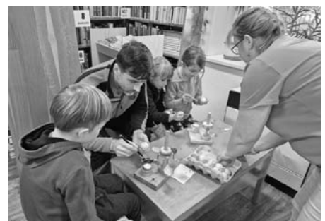
Malování kraslic, jak vidno, není doménou pouze žen. I klukům a mužům šlo na výbornou.

Dne 19. března 2024 patřila dopolední knihovna těm nejmenším, zatím ještě nečtenářům. Maminky s nejmenšími dětmi do věku tří let byly pozvány na Setkání maminek s dětmi . Účelem setkání nebylo pouze samotné předčítání z kouzelného zvířecího leporela, anebo možnost maminek potkat se, ale také aby si malé děti poprvé v pohodě prohlédly prostor knihovny a zjistily, jak to u nás může