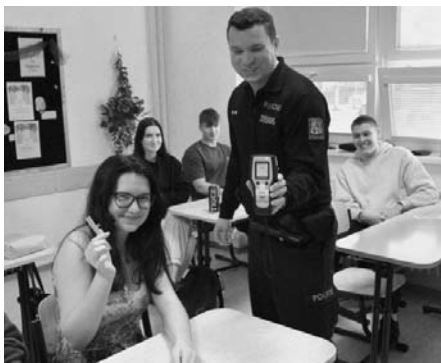
Přednáška o bezpečnosti byla pro studenty nejen přínosem, ale také zábavným zpestřením vyučování.

Každý z profesionálů pojal svou přednášku jiným způsobem, s poutavým zaměřením na svůj obor. Dozvěděli jsme se mimo jiné, jak policisté a hasiči postupují při zásazích, jak se vyvarovat dopravním nehodám a jak se zachovat v případě havárie. Přestože všichni pevně doufáme a věříme, že tyto postupy nebudeme muset v praxi použít, je nutné být o nich poučeni. Obzvláště, když si bude větší-