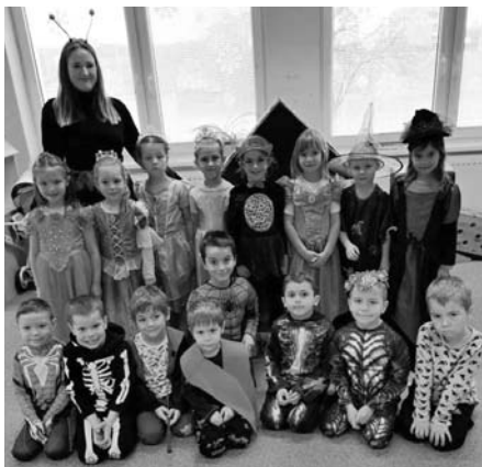
Karneval je super prima zábava. Právě proto si ho nikdy ve školce nenecháme ujít!