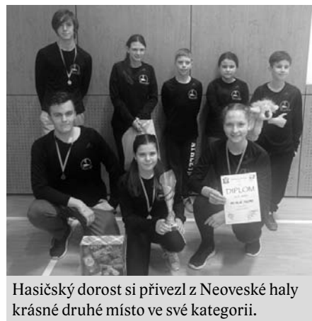
Hasičský dorost si přivezl z Neoveské haly krásné druhé místo ve své kategorii.