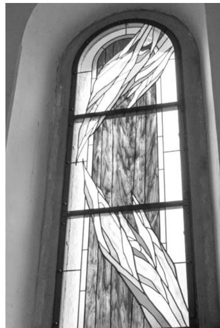
Vitráž s názvem Zvěstování.