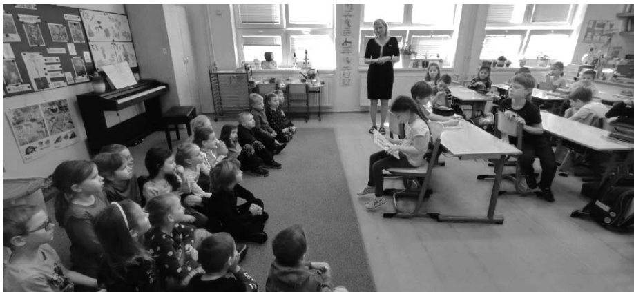
Naši kamarádi ze školy, kteří už chodí do první třídy, nám ukázali, jak už umí krásně číst.

Seznámili se nejen s poutavým stylem výuky, ale také s prostory třídy, družiny a jídelny. Vyzkoušeli si i úkoly na interaktivní tabuli.