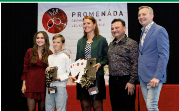
PROMÉNÁDA ČERVENÝCH VÍN roku 2024