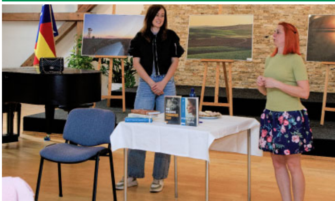
Městská knihovna uspořádala besedu s oblíbenou spisovatelkou Janou Poncarovou