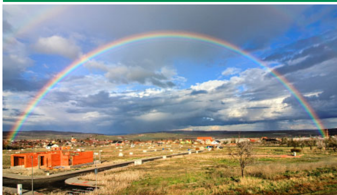
Nádhera – dvojitá duha nad novou zástavbou bývalého areálu zemědělského družstva