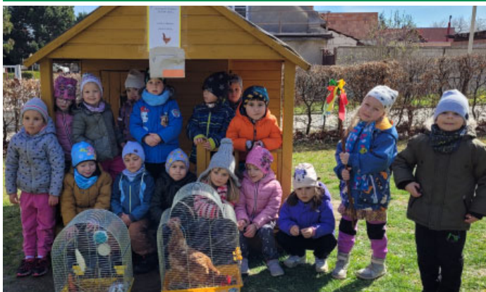
Mateřská škola – Zajíčkova velikonoční stezka v zahradě školky