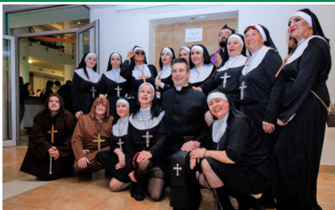
ŠIBŘINKY – Maškarní bál pořádaný TJ Slavoj Velké Pavlovice