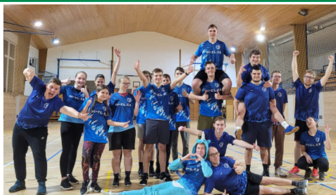
Velkopavlovičtí hasiči jako jeden šik! Ve zbrusu nových dresech jim to neskutečně sluší

Spousty dalších fotografií ze všech akcí a pracovních aktivit ve městě najdete na oficiálních webových stránkách města Velké Pavlovice - www.velke-pavlovice.cz