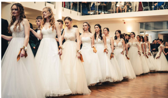
Předtančení polonézou na Studentském plese pořádným místním gymnáziem