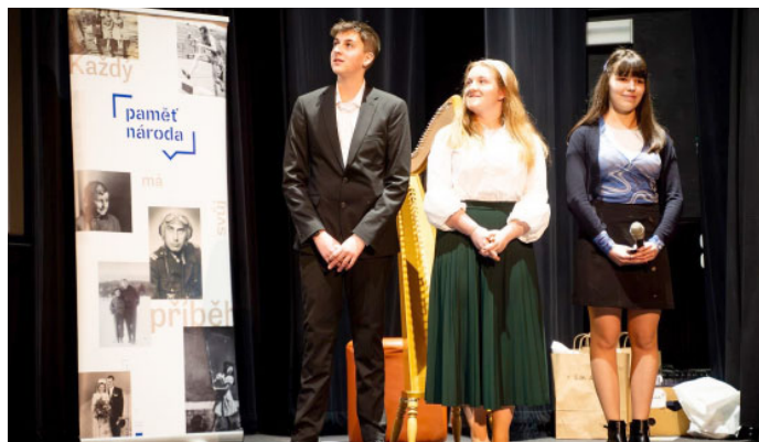
Paměť národa – studenti gymnázia vdechli život zapomenutému příběhu našich předků; prezentace v Hustopečích