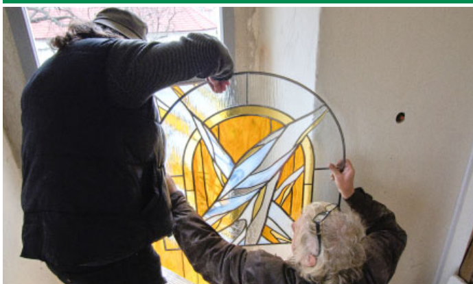
Na průčelí kostela Nanebevzetí Panny Marie byly nainstalovány další vitráže