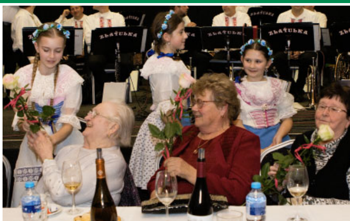
SRAZ STÁRKŮ roku 2024