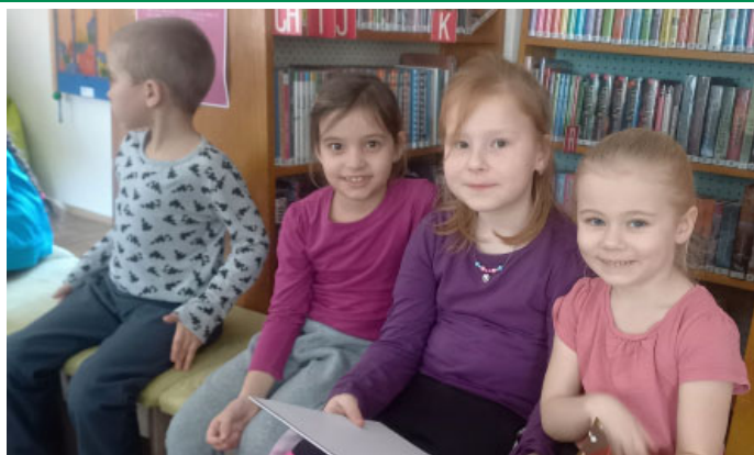
Děti ze školky navštívily knihovnu plnou pohádek