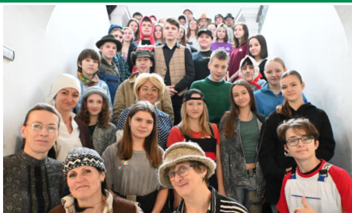
Základní škola v retro stylu – žáci i učitelé dorazili do školy oděni jako jejich rodiče či prarodiče