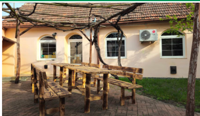
Na dvorku TIC & MěK je nový dřevěný nábytek, vyrobili jej pracovníci služeb města