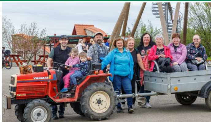
Jarní úklid města v rámci celostátní akce Uklidme Česko – Přátelé country nechyběli ani letos