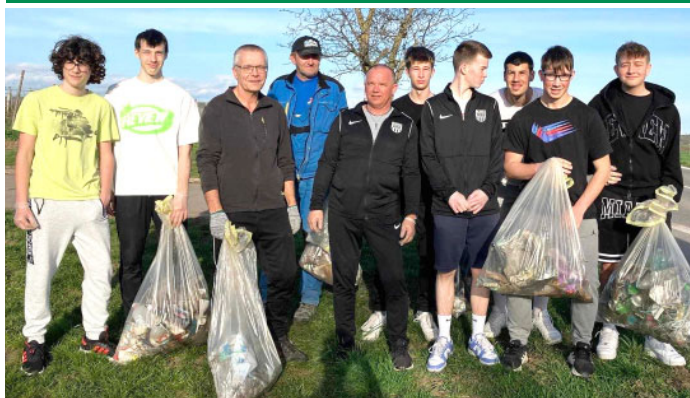
Velké Pavlovice jsou poklizeny, ruku k dílu přiložili i fotbalisté TJ Slavoj