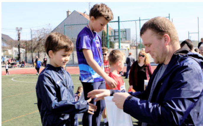
BĚH O VELKOPAVLOVICKOU MERUŽKU 2024, VII. ročník