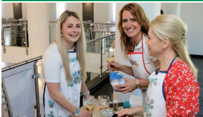
Velkopavlovický košť vín 2024 – na znovuoobnovené vinařské akci proběhla soutěž o nejlepší pomazánku