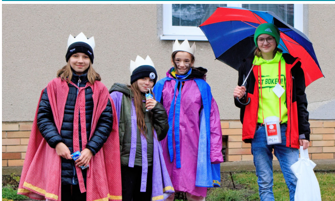
Počasi letos Tříkrálové sbírce neprálo, přšelo a foukal ledový vítr. Přesto se díky dobrovolníkům uskutečnila.