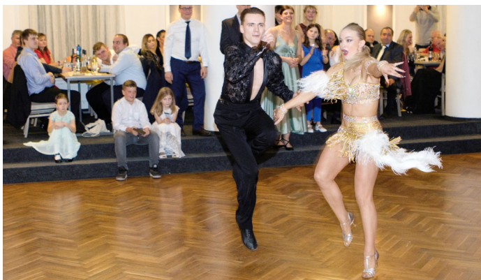
Ples města Velké Pavlovice. Ozdobou bylo předtančení v podání mistrů světa a mistrů Evropy v tanečním sportu.