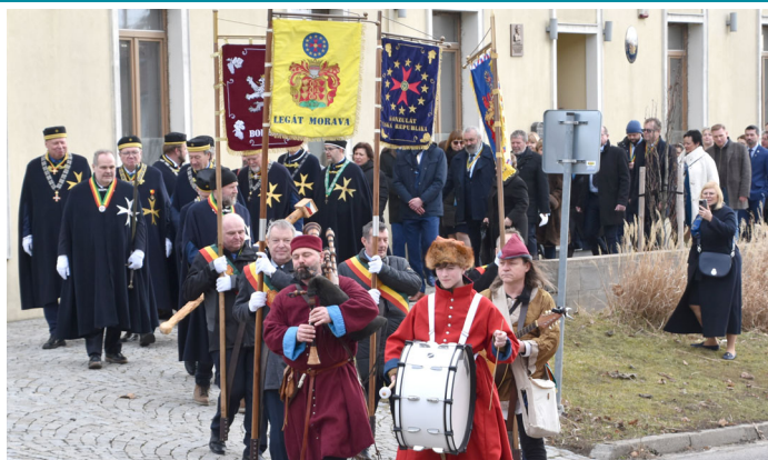
Slavnost Evropského řádu rytířů vína se konala ve Velkých Pavlovicích v roce 2024 již počtvrté.