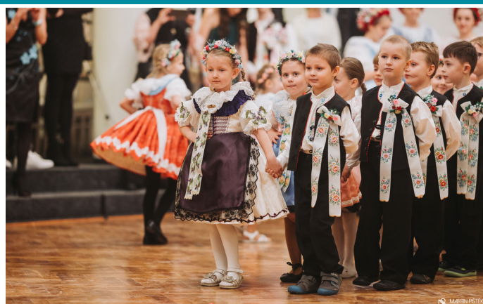
Malí tanečníci folklorního souboru Sadováček zahájili svým vystoupením Krojovaný ples.