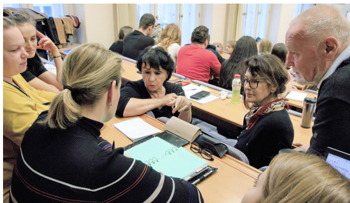
Seniři – studenti Univerzity třetího věku, navštívili v rámci svého vzdělávání hlavní město Prahu.