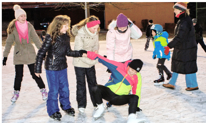
Mrzlo až praštilo a za kostelem se bruslilo. Škoda, že teploty pod nulou nevydržely déle.