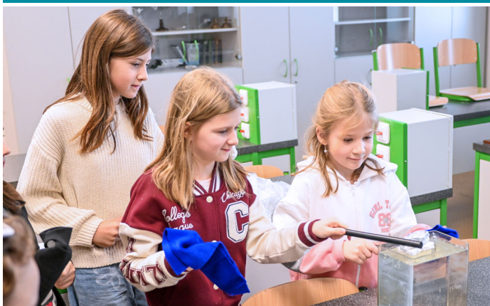
Adventní Den otevřených dveří na základní škole.