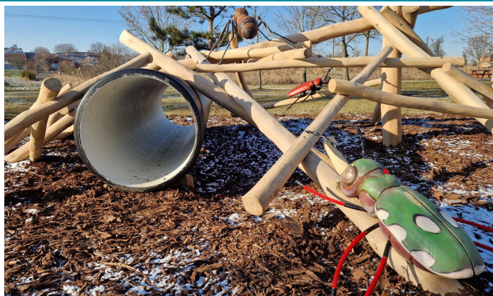
Děti dostaly začátkem roku 2024 úžasný dárek – nové hřiště s originálními prvky v parku u zastávky ČD.