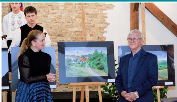
Adventní vernisáž výstavy obrazů PLENÉR 2023, Jesenné Pavlovice v Senici.