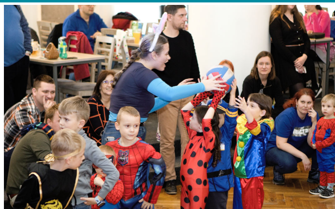
Dětská maškarní diskotéka byla letos plná nových her a soutěží.