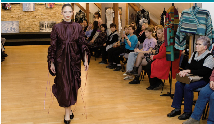
Vernisáž výstavy prací studentů Střední školy umění a designu a Vyšší odborné školy Brno, p.o. s názvem Tradice a řemeslo v současném oděvu.