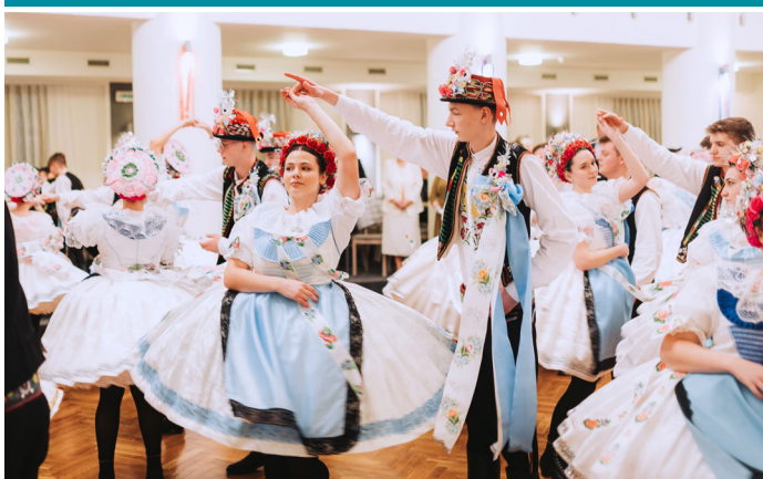
Krojovaný ples 2024 – už tradičně první ples sezóny.