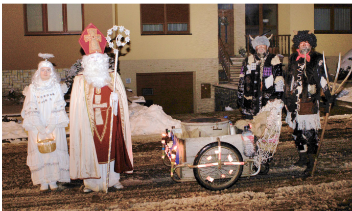
Mikulášská obchůzka městem – Mikuláš a anděl rozdávali dárečky a čertiska jen řetězy řinčela!