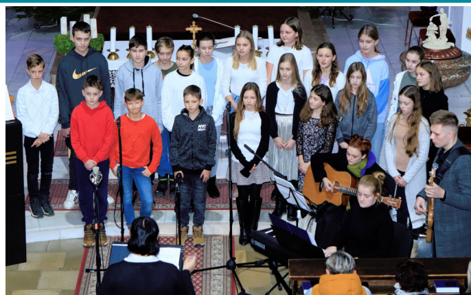
Vánoční a současně charitativní koncert studentů gymnázia v kostele.