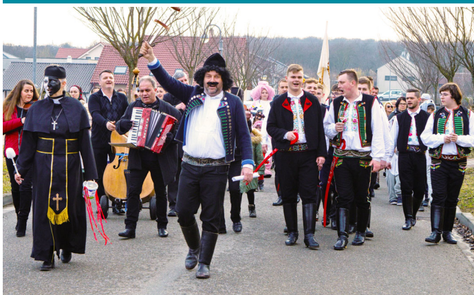
Velkopavlovické ostatky roku 2024 se nesly na vlně veselé nálady a skvělé zábavy.