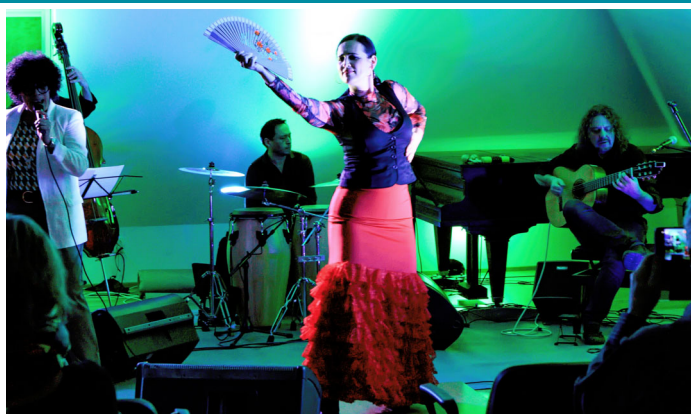
11. ročník charitativního vánočního koncertu hudebního uskupení DUENDE na Ekocentru Trkmanka.