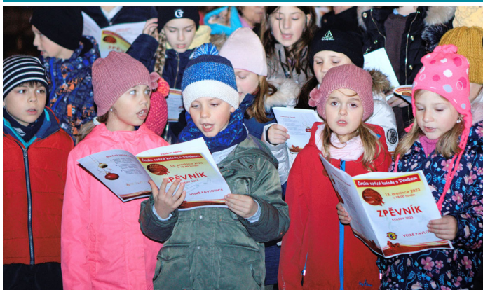
Už 7. ročník adventní akce Česko zpívá koledy s Deníkem u velkopavlovické radnice.