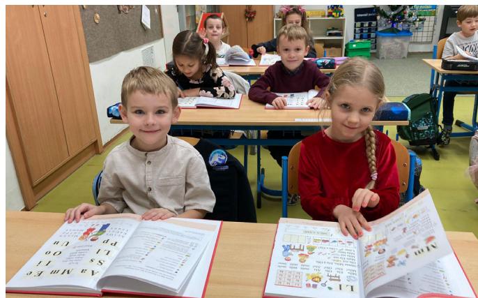
Prvníáci se stali skutečnými čtenáři, dostali od pana ředitele svou první knihu – Slabikář.