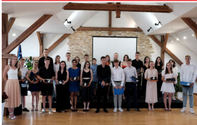
Loučení devěťáků se základní školou