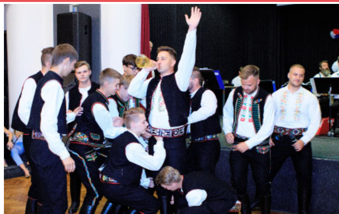
Zahrávky hodů roku 2023