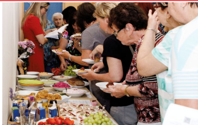
Přednáška Zdravá výživa – projekt pro seniory Jak relativní je stáří