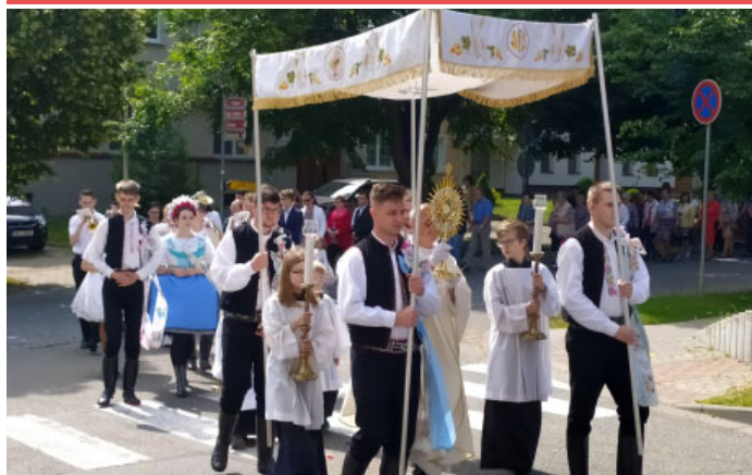
Boží tělo – svátek Těla a Krve Páně