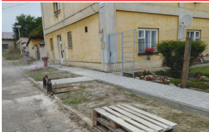
Oprava chodníku na ulici Tovární