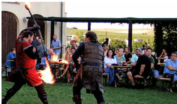
II. ročník Zámeckého snění na Ekocentru Trkmanka