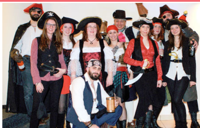
ŠIBŘINKY – MAŠKARNÍ BÁL