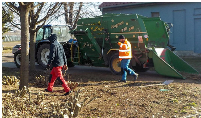
RELAXAČNÍ PARK U VLAKOVÉ ZASTÁVKY – přípravy na jaro