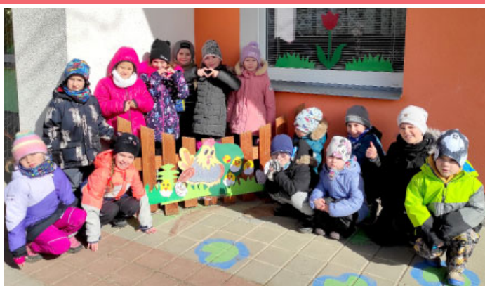
MATEŘSKÁ ŠKOLA & Velikonoční zajičková cesta