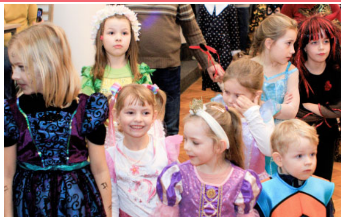
DĚTSKÁ MAŠKARNÍ DISKOTÉKA