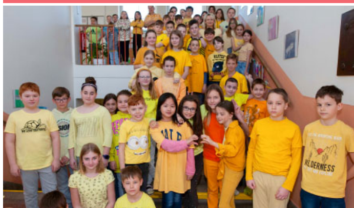
ZÁKLADNÍ ŠKOLA & Projektový barevný žlutý den