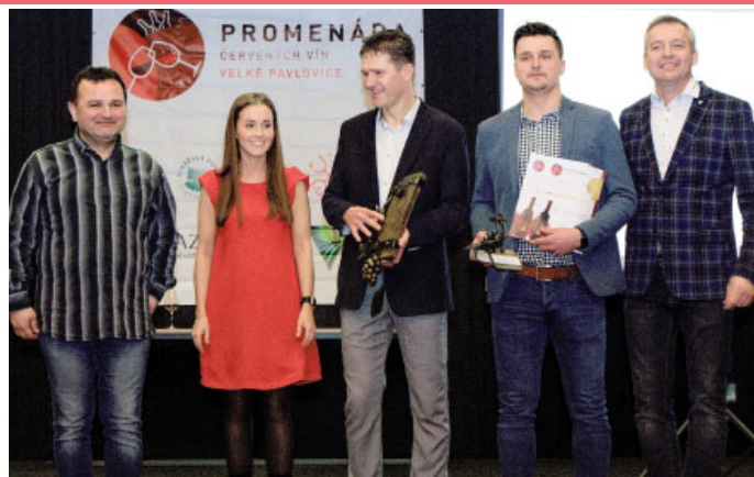
PROMENÁDA ČERVENÝCH VÍN 2023 – VI. ročník soutěže