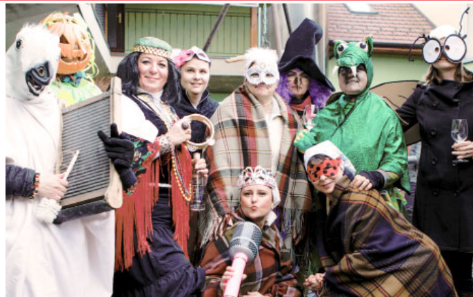
VELKOPAVLOVICKÉ OSTATKY 2023