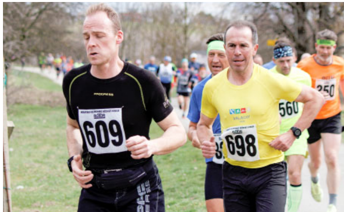
BĚH O VELKOPAVLOVICKOU MERUŇKU – VI. ročník závodu