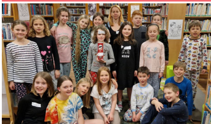
MĚSTSKÁ KNIHOVNA & Noc s Andersenem na téma Ferda Mravenec Ondřeje Sekory