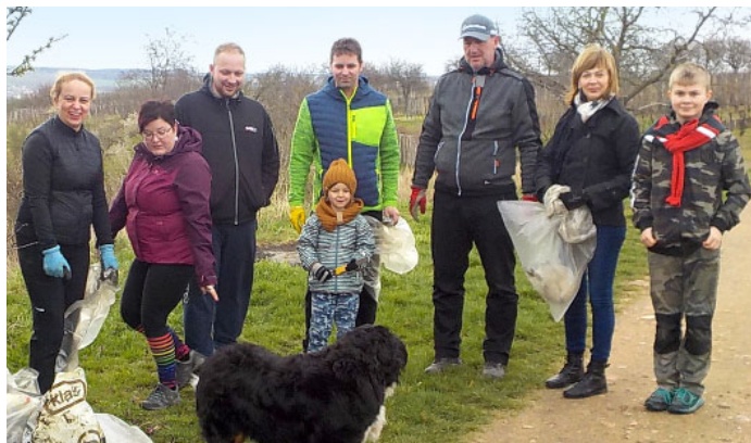
VELKÝ ÚKLID MĚSTA VELKÉ PAVLOVICE – Okrašlovací spolek