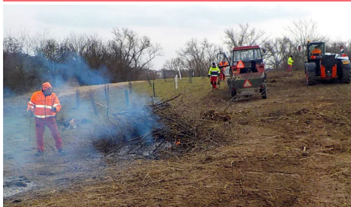
ČIŠTĚNÍ MĚSTSKÝCH POZEMKŮ OD NÁLETOVÝCH DŘEVIN