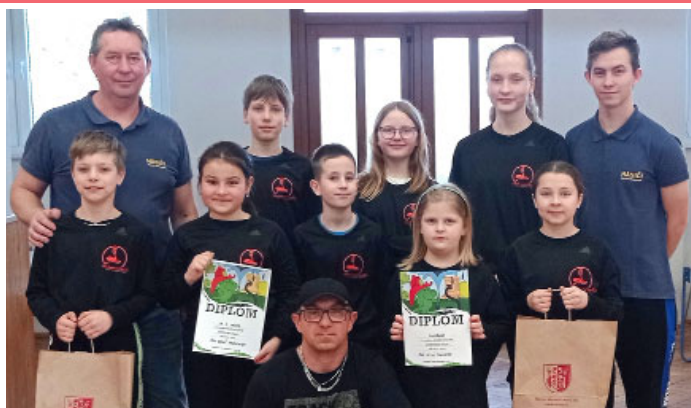
MLADÍ HASIČI SOUTĚŽÍ – Neoveská hala v Týnci