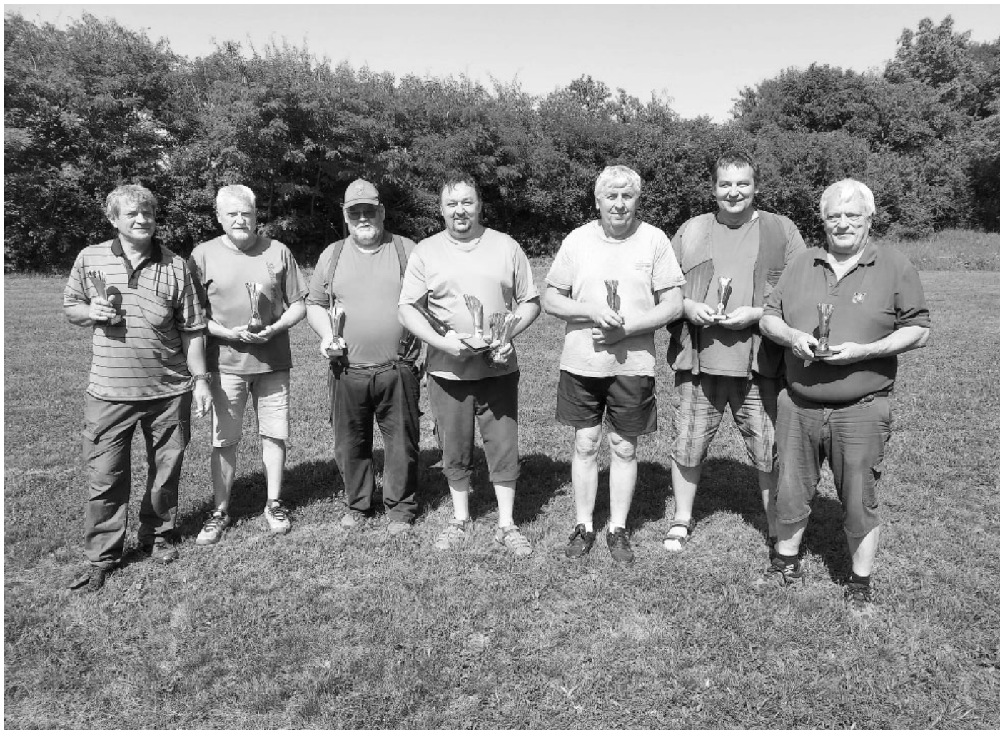
Nejúspěšnější střelci si odnesli ze závodu ve Velkých Pavlovicích poháry a diplomy, hlavně však slastný pocit z umístění na nejvyšších stupních vítězů.