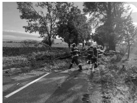
Na silnici mezi Starovičkami a Šakvicemi popadaly stromy během vichřice jako špejle z dětské hry Mikádo.

nahlášeny. Okolí na tom bylo o mnohem hůře, a tak měli velkopavlovičtí hasiči plné ruce práce. Povolání byli hned ke dvěma událostem. V prvním případě se jednalo o odstranění spadlého stromu přes silnici Starovičky – Šakvice, ve druhém případě o odstranění vyvráceného stromu, který zůstal opřený o dům.