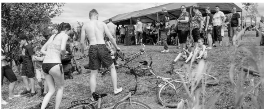
Třetího ročníku Velkopavlovické lávky se zúčastnil nečekaně vysoký počet návštěvníků – soutěžících i fandících diváků.

Je třeba poděkovat za spolupráci pracovníkům Služeb města Velké Pavlovice, kteří přivezli a odvezli stoly a lavice, dále pro diváctvo perfektně upravili travnatou plochu a posekli rákos. To vše, aby bylo dobře vidět na vodní hladinu. Město Velké Pavlovice poskytlo soutěžícím také drobné věcné ceny.