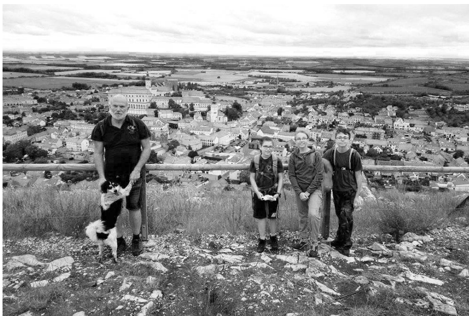
Mladí Vlci se vydali za krásami historického a vinařského města Mikulov. A nejen tam. Při svých toulkách překročili i blízkou hranici se sousedním Rakouskem.

Plni dojmů opouštíme zříceninu hradu a ubíráme se dolů do vesnice Falkenstein. Mladí Vlci se mě ptají, zda stejnou cestou půjdeme i do Mikulova. Už se jim moc nechce šlapat. Já je však překvapím sdělením, že pojedeme autobusem. Ten sem o víkend pravidelně zajíždí a dopravuje turisty sem i zpět do Mikulova. Všichni si oddychnou a po chvíli chůze