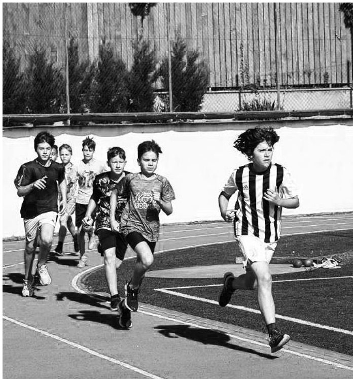
Sportovci z 2. stupně ZŠ si vzali olympijské heslo „Citius, Altius, Fortius – Communiter“ neboli „Rychleji, výše, silněji – společně“ k srdci.