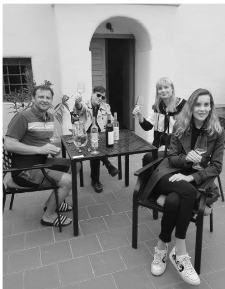
Habánský vinný sklípek rodiny u Lacinů přivítal vzácné hosty, dorazili až z Jižní Ameriky, ze země Chile.

Zástupci českých vinařství se historicky poprvé zúčastnili již 26. ročníku mezinárodní soutěže Catad'Or World Wine Awards. Při své premiéře v konkurenci téměř tisíce vín ze šestnácti různých zemí získala česká vína dvě velké zlaté medaile (Gran Oro), osm zlatých medailí (Oro) a zvláštní ocenění za nejlepší růžové víno (rosé). Součástí soutěže byl i slavnostní český večer, na kterém se v českých kulisách kromě našich vín a likérů představilo odborné veřejnosti rovněž české pivo a tradiční pokrm.