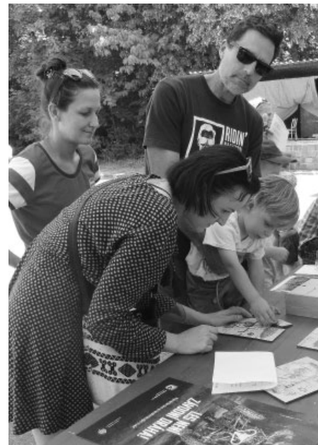
Vydat se po stopách pytláka Floriána vyžaduje nejen fyzickou zdatnost, ale také vědomosti. Děti nám dokázaly, že se v přírodě vyznají.