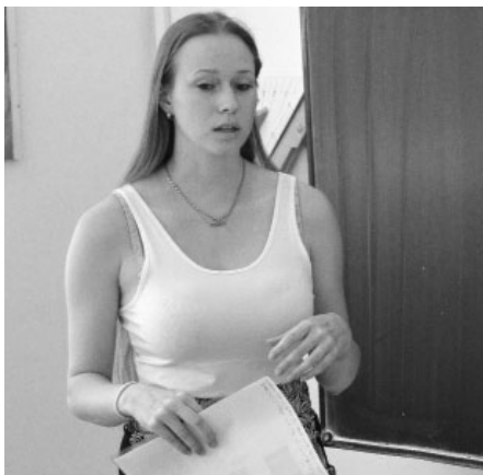
Zpracovat seminární práci a obhájit ji před komisí pedagogů rozhodně není žádný med. Navíc, když se vám této zkušenosti dostane v necelých osmnácti letech.

Studenti zpracovali témata z různých oblastí