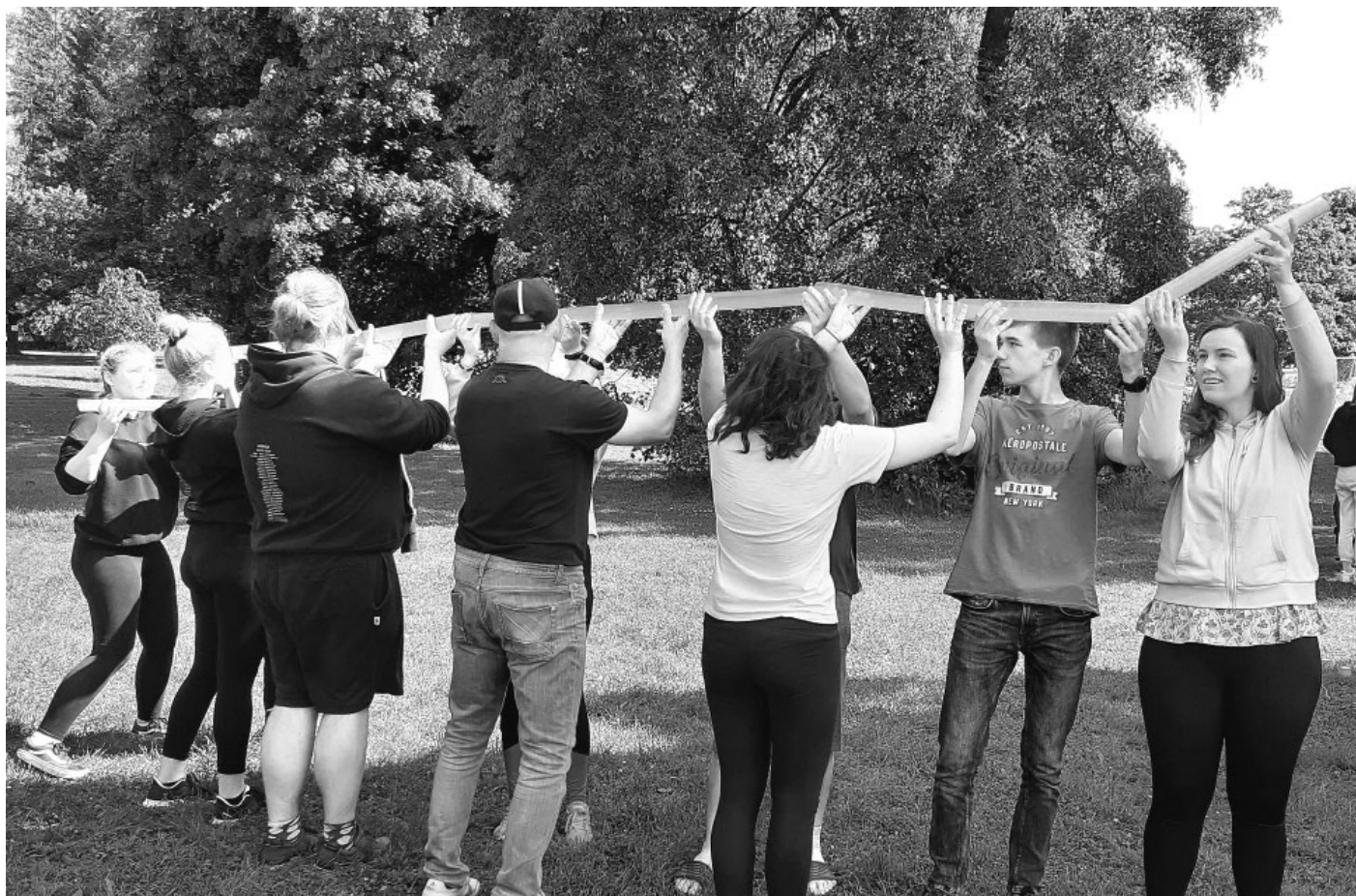
Na společné aktivity, které dokáží tmelit kolektiv, není nikdy pozdě. Ani v předposledním ročníku osmiletého studia.