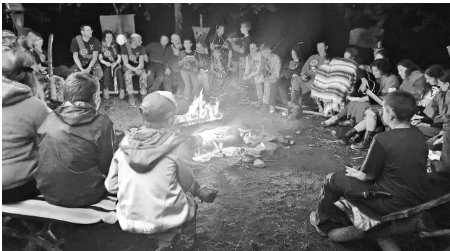
33. Letní expedice kmene Vlků - slavností sněm kmene.

Proběhla i dvoudenní výprava do Moravského krasu. V rámci této výpravy jsme v plné polní první den šli z tábora přes Benešov, kolem meteorologického radaru na Skalce, kolem rybníka u Skelné huti, kde jsme se osvěžili