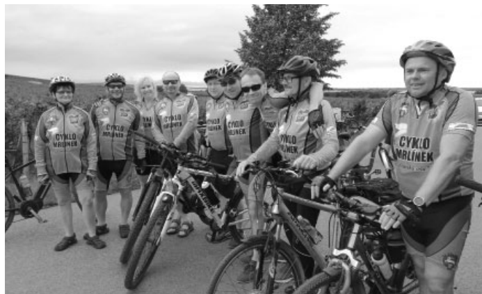
Není nad to vyrazit si s přáteli na cyklovýlet vinorodou krajinou.

navýsost příjemné. Vedra se nekonala, déšť ani vítr nakonec také ne, zkrátka a dobře bylo „tak akorát“.