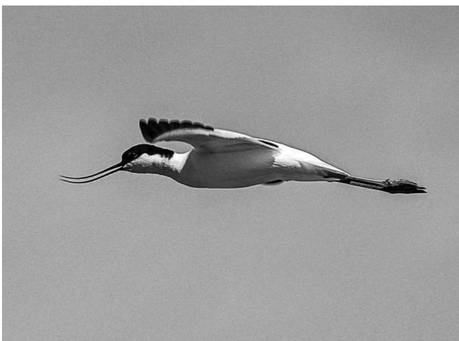
Velevzácný tenkozobec opačný zřejmě nabral opačný směr a namísto do své domoviny v Africe či Asii dolétl do Velkých Pavlovic, na nový rybník na Zábalské.