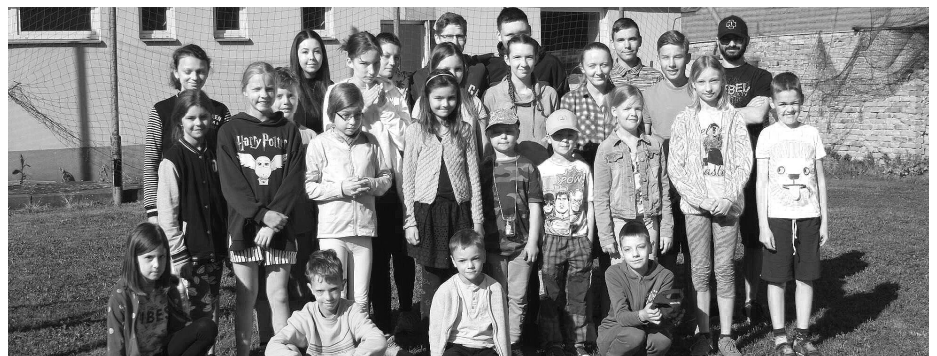
Tak to jsme my v plné kráse, kteří jsme se zúčastnili letošní jarní víkendovky v Těšanech.