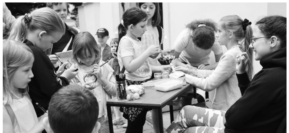
Noc kostelů si užívali všichni plnými douškami. Děti se zaradovaly nad spoustou her a soutěží.

I proto bylo cílem omalovánky s doplňovačkou, kterou mohli návštěvníci vyplnit a získat odměnu, ukázat, co všechno v kostele mohou slyšet. Před kostelem si mohly děti vyrobit vlastní hudební nástroj: rytmičké chrastítko