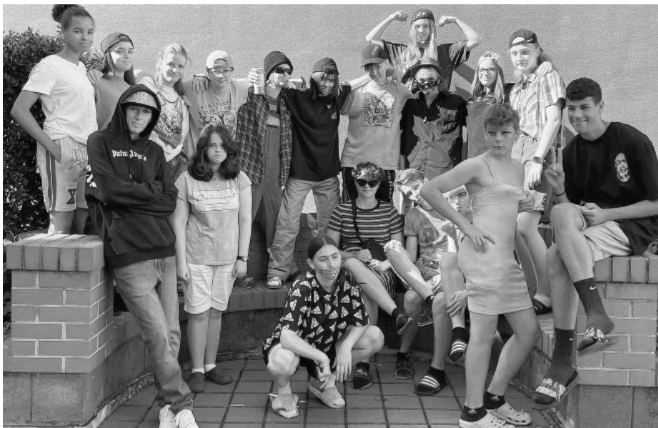
Tak to vypadalo v osmé třídě, když byli kluci holky a holky kluci!