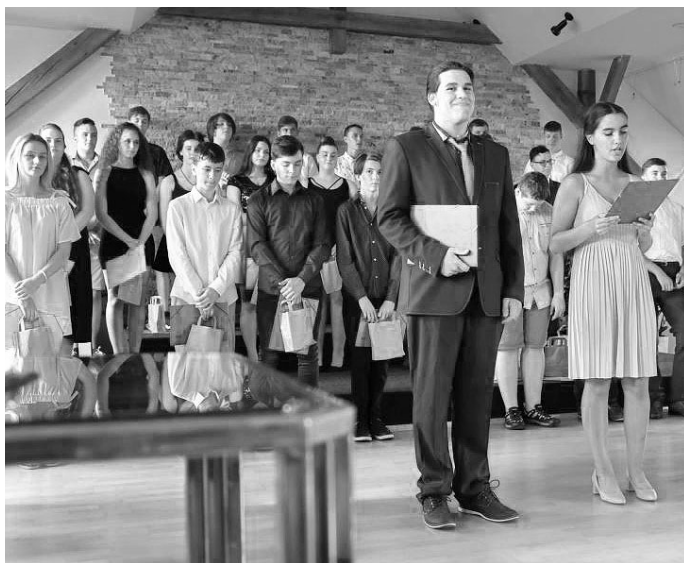
Žáci deváté třídy školního roku 2021/2022 dali své základy adié a rozlétli se do světa!