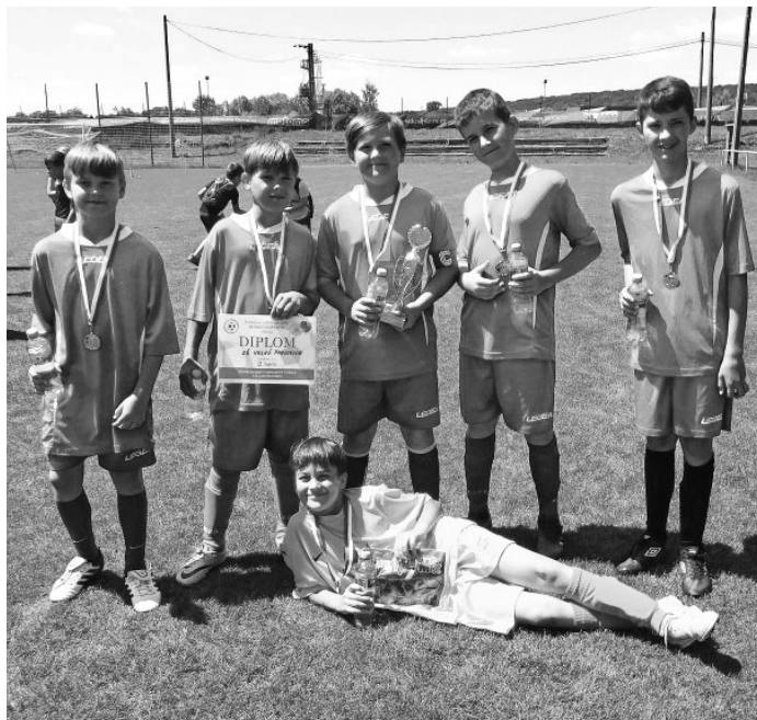
Velkopavlovičtí fotbalisté kategorie U11 (4.–5. třída).