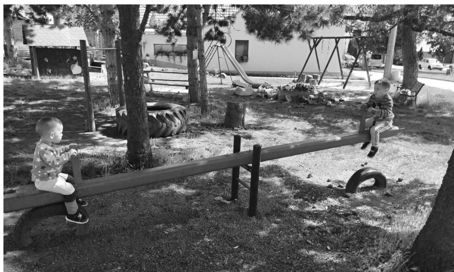
Pískoviště jako nové! To se pak každá bábovička musí podařit.