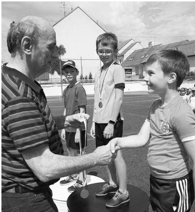
Odekorování medailí mohou být jen ti nejlepší! Olympiáda na 1. stupni ZŠ.