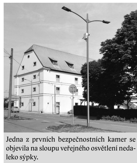
Jedna z prvních bezpečnostních kamer se objevila na sloupu veřejného osvětlení nedaaleko sýpký.

Bystří občané si určitě už v polovině měsíce června všimli prvních bezpečnostních kamer ve městě. Instalace kamerového systému napojeného na městskou policii byla dokončena v následujících dnech. Kamery se staly nutností především z důvodu zvýšení bezpečnosti osob ve městě a ochrany majetku. Kamerové záznamy vedou velmi často k dopadení osob, které se dopustily protiprávního jednání.