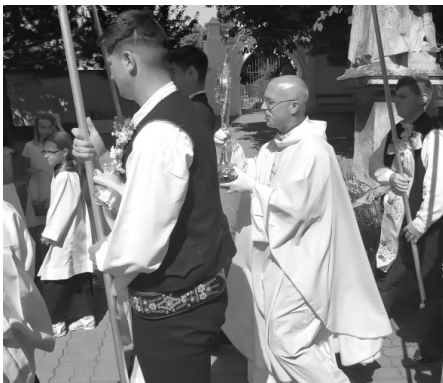
Důstojné božítelové procesí roku 2022 vchází do kostela Nanebevzetí Panny Marie.