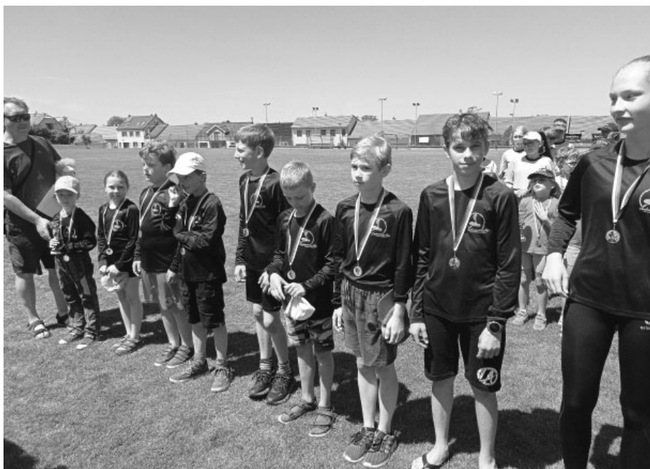
V Šitbořicích se našim mladým hasičům dařilo, ze závodu si přivezli bronzové medaile.