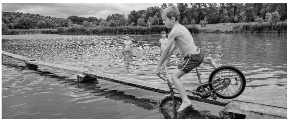
Malým pokořitelům uzoučké lávky nechyběla notná dávka odvahy a odhodlání. Hrozba, že si zaplavou, vždyz hraničí s jistotou!