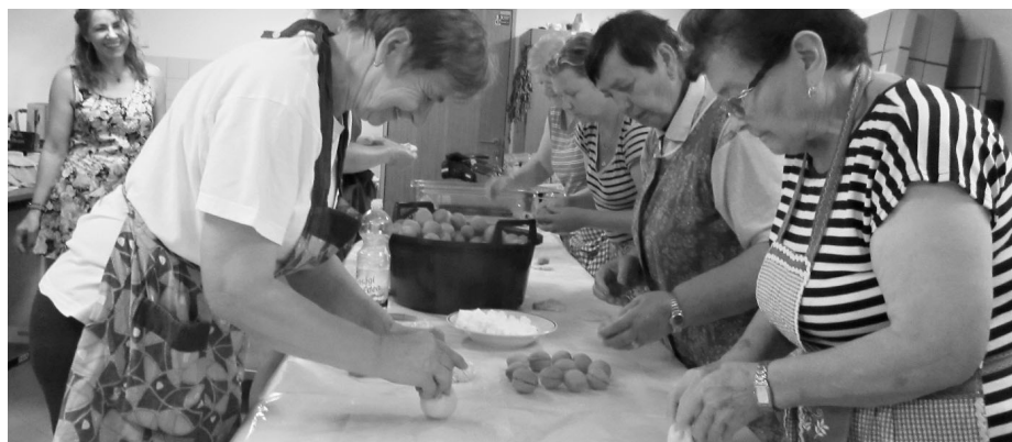
Při pohledu na tento snímek se nejednoho z nás zmocní pocit, že se kuchařinkám musely zdát ještě týden oranžové sny!

Ono totiž propracovat těsto z tolika litrů mléka, řádně uhnětené jej pravidelně rozdělit na