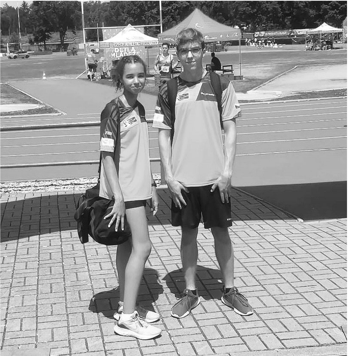
Se svým týmovým kolegou na Olympiádě dětí a mládeže v Olomouci. Oba hrdě soutěžili za Jihomoravský kraj.

Už jenom to, že má tatínka původem z Keni a žila do svých jedenácti let v Norsku, je více než vhodným adeptem „na rozhovor“. A co víc? Tak třeba její nedávná reprezentace Jihomoravského kraje v atletice na Olympiádě dětí a mládeže 2022 v Olomouci.