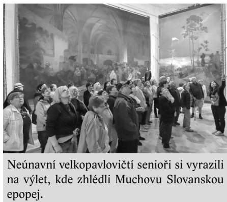
Neúnavní velkopavlovičtí senioři si vyrazili na výlet, kde zhlédli Muchovu Slovanskou epopej.

V pátek 10. června 2022 členové Klubu důchodců Velké Pavlovice navštívili výstavu obrazů Slovanská epopej od malíře Alfonse Muchy na zámku v Moravském Krumlově. Po celou dobu návštěvy zámku se jim věnovala skvělá a hlavně historické znalá paní průvodkyně, která seniory seznámila se životem malíře a také vyprávěla o dějinách slovanských národů vyobrazených na dvaceti velkoformátových obrazech. Po nádherném zážitku přišlo vhod posezení v kavárně u kávičky a dobrého zákusku.