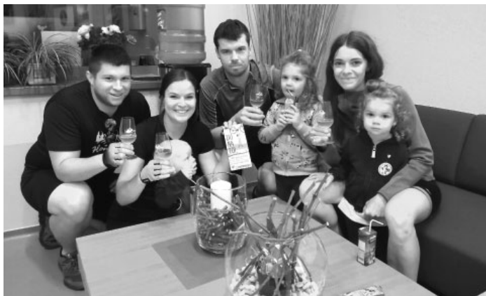
Expedice Krajem André je skvělou akcí pro celou rodinu!

měl v roce 2022 uskutečnit už 17. ročník Expedice Krajem André, uskutečnilo se letos teprve 16. putování. Důvodem početní nerosvnalosti je přetržka v roce 2020 způsobená COVID-19. Číslovka 16 inspirovala pořadatele k „vrchařské prémii“, kterou obdrželo v cíli prvních šestnáct účastníků. Ti museli splnit podmínku přivést ve svém razítkovacím průkaze nejméně sedm razítek z devíti a za to jim byla předána láhev vína z Kobylí. Nejvýznamnější novinkou roku 2022 bylo zřízení druhého startovacího místa ve Velkých Pavlovicích. Možnosti odpíchnout se právě u nás využilo sedmačtyřicet dospěláků a patnáct dětí. Další novinkou bylo pozvednutí kultury v oblasti konzumace vína. Dříve si každý účastník vozil svou privátní skleničku, původně tradiční „koštovačku“, později na stopce. A protože bylo obvykle v závěru akce více střepeň než