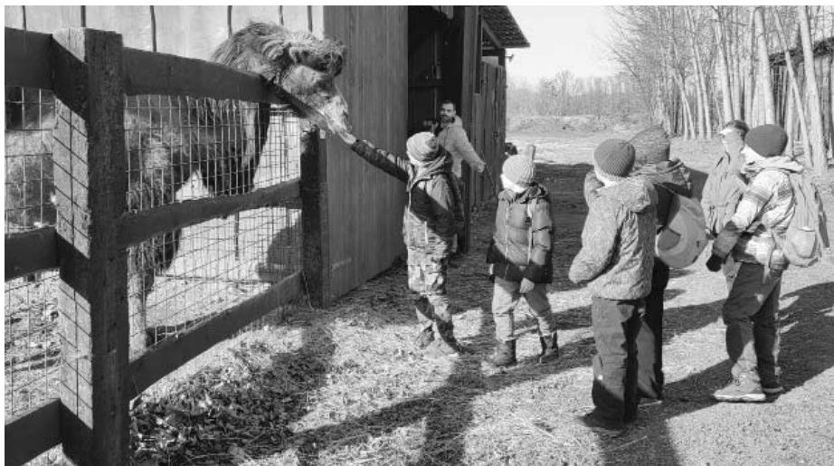
ZOO Sedlec – velbloudi se zprvu nezdáli, ale nakonec se ukázali jako velmi společenský živočišný druh.

ZOO Sedlec patří k menším zahradám u nás, ale to jí nic neubírá na její atraktivnosti a důležitosti. Kromě prohlídek jsou zde pořádány i různé výukové programy, komentované prohlídky spojené s krmením zvířat a zároveň také zahrada spolupracuje s několika domácími organizacemi – Českou společností ornitologickou, Mezinárodní asociací želv, Českou asociací pro chov a ochranu krokodýlů, Českým svazem ochránců přírody. Jsem si jistý, že jsme