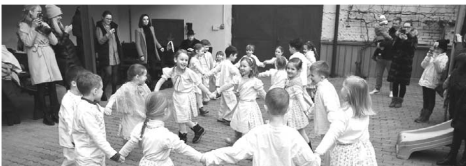
Přestože počasí zábavě pod širákem příliš nepřálo, dětem z Floriánku chladno úsměv na rtu nezmrazilo. Zahřály se tancem, zpěvem a skotačením.