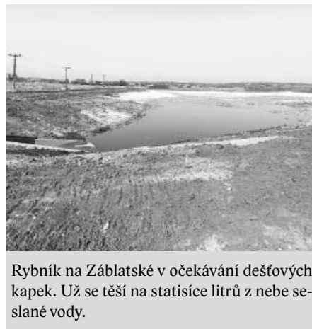
Rybník na Záblatské v očekávání dešťových kapek. Už se těší na statisíce litrů z nebe sešlapané vody.

Nyní biocentrum čeká už jen na drobné terénní úpravy, výsadbu bohaté zeleně, jež je taktéž nedílnou součástí projektu, ale hlavně na déšť a toho se bohužel stále v dostatečném množství nedostává. Čím dříve a čím více naprší do nádrže dešťové vody, tím se sníží množství srážek a sucha uměle napustit. Pokud se rybník nenaplní přirozeně, bude nutné jej co nejdříve uměle napustit.