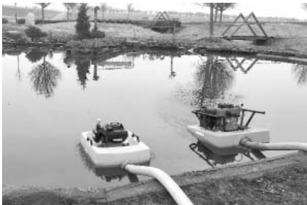
Před zahájením čištění jezírka bylo nutné vyčerpat taktéž silně znečištěnou vodu.

Následující pracovní týden bylo zahájeno čištění rybníka od naházených kamenů, listů a bláta. Šlo o velmi náročnou a zdoluhavou práci. Kameny bylo nutné vytáhnout ručně, ale na listy a bláto byla naopak třeba mechanizace. Nedílnou součástí náročného očištění bylo také pečlivé odstranění až centimetr vysokého nánosu řasy ze dna tvořeného fólií.