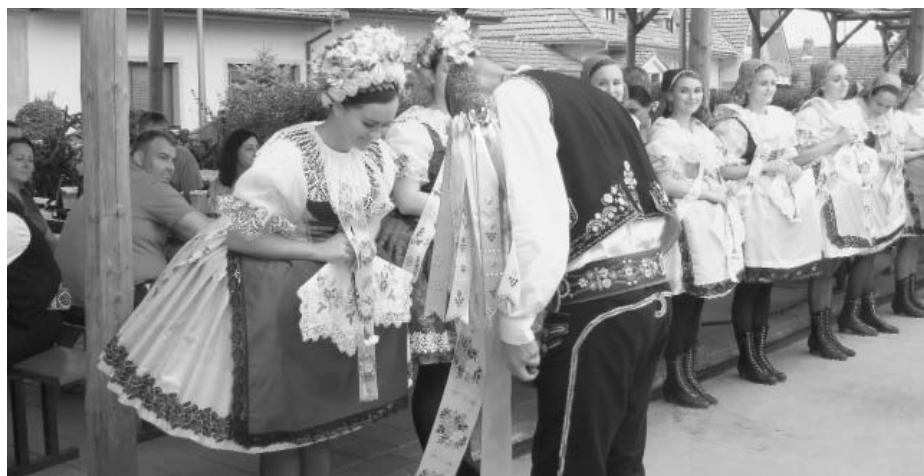
Zavádka ve Velkých Pavlovicích – rok 2020.

„ V lednu jsme odeslali Jihomoravskému kraji nominaci na zápis hodové zavádky na Hanáckém Slovácku na seznam nemateriálních statků kraje. Verdiktu bychom se měli dočkat nejdříve v červenci letošního roku. Samotnému zápisu nominovaného nemateriálního statku, v tomto případě zavádky, předchází několik kroků – představení, posouzení odbornou komisí, zpracování dat a následné rozhodnutí, “ oznámila vedoucí Regionálního pracoviště pro tradiční lidovou kulturu jižní Moravy.