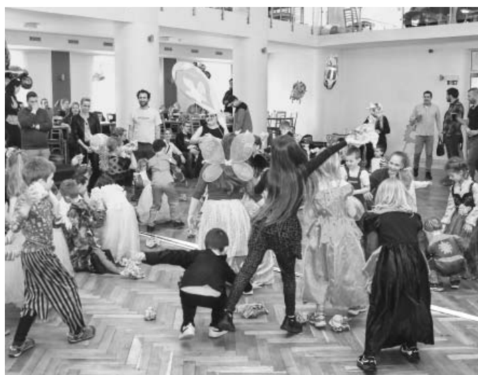
V úvodu průvod, poté soutěže a v závěru pořádná „pařba“, důkaz, že to naše děti umí rozjet ve velkém!