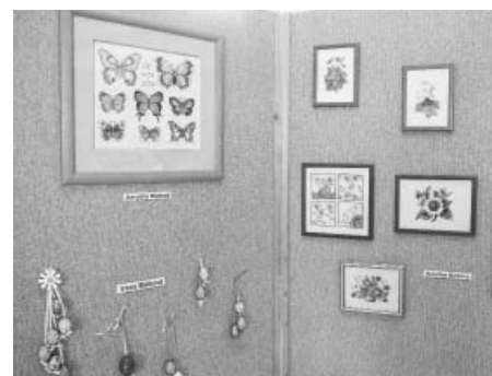
Výstavní panely byly ozdobeny symboly Velikonoc – kraslicemi a také křížkovými vyšívkami s jarními motivy.