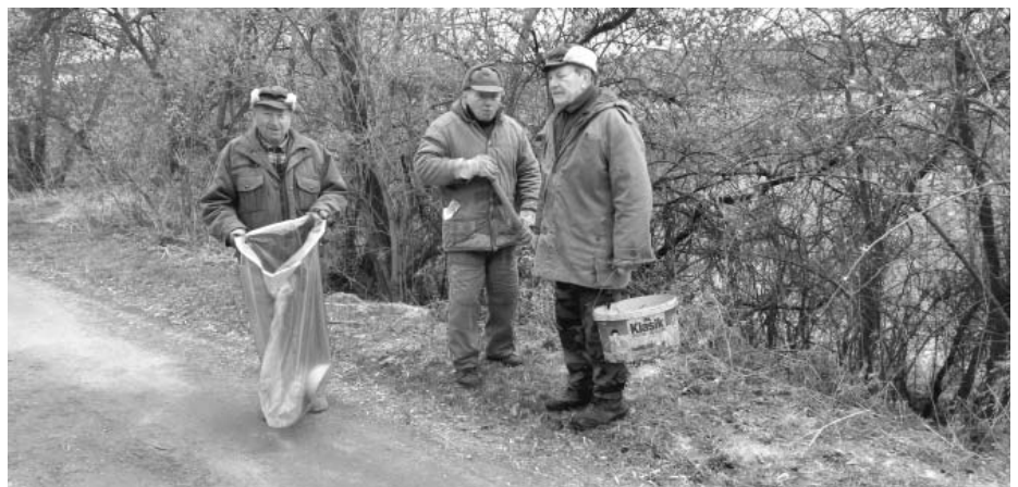
Do velkého úklidu spojeného se sběrem odpadků se zapojili i členové místního Mysliveckého spolku