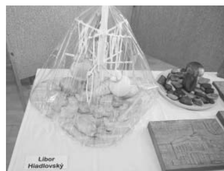
Výstavní sál provoněl typický odér dřeva, ale třeba také uzeneho sýra.