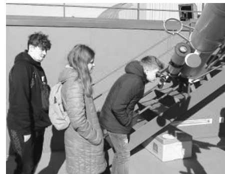
Díky obrovskému dalekohledu umístěnému v kopuli brněnské hvězdárny jsme si mohli pohlédnout slunce zblízka...

Pak jsme se nasvačili a přemístili do technického muzea. Naše kroky vedly do expozice výpočetní techniky. Provázel nás starší pán, ukazoval nám počátky a vývoj počítačů, mobilů. Zaujala mě první dřevěná počítačidla a celé povídání končilo u supermoderních počítačů. Některým z nás ten pán dovolil hrát na počítačích hry staré 40 let. Proto konec jeho povídání už poslouchalo méně žáků, neboť jsme se rozptýlili po zajímavostech dané expozice.