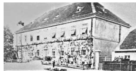
Historický snímek budovy „zámku“, dnešního Ekocentra Trkmanka.

Program bude zajímavý pro malé i velké návštěvníky, nebude chybět dobová hudba ani