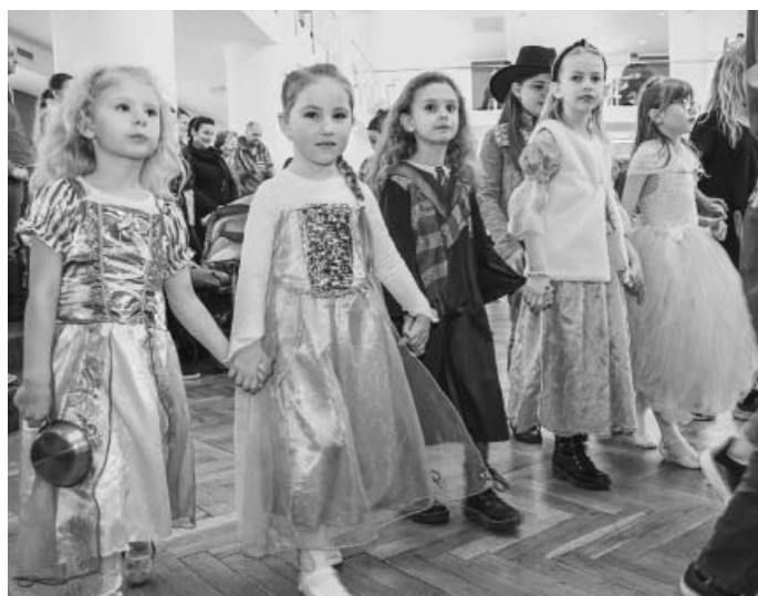
Stálice – žádný maškarák se neobejde bez silné základny princezen. Tato maska se nikdy neomrzí!