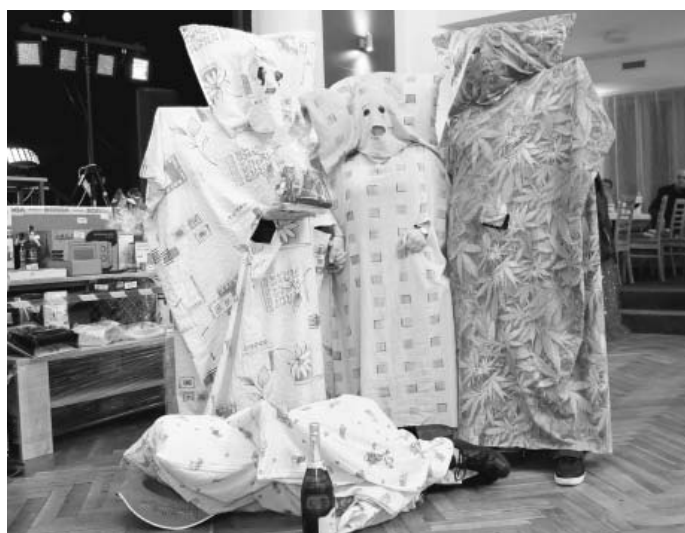
Tak toto se jen tak nevidí... Hlavně dovnitř se nevidělo. Tak má vypadat stoprocentní maska.