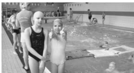
Malí plaváčci – díky plaveckému kurzu se naše děti jen tak neutopí a vody se bát rozhodně nebudou.