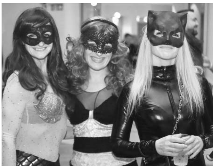
Sexy trio, které nenechalo žádného muže v klidu – mořská panna, včela a kočičí žena.