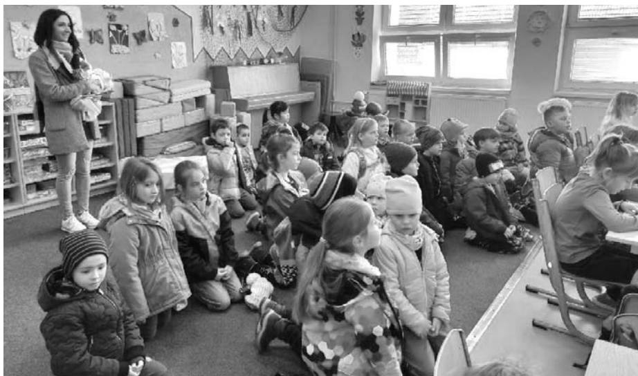
Předškoláci zavítali do školy, prohlédnout si budovu, kterou budou zanedlouho coby prvňáčci navštěvovat.

Vítaným zpestřením byla prohlídka nové odborné učebny, kde měly děti možnost zasednout přímo do lavic a aktivně se zapojit do zajímavého programu, který si pro ně připravily vyučující kantoři fyziky. Děti shlédly pokusy,