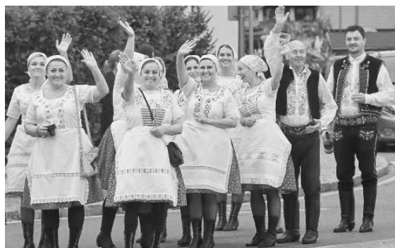
Hanákoslovácký krůžek nemohl chybět ani na Velkopavlovickém vinobraní roku 2021.