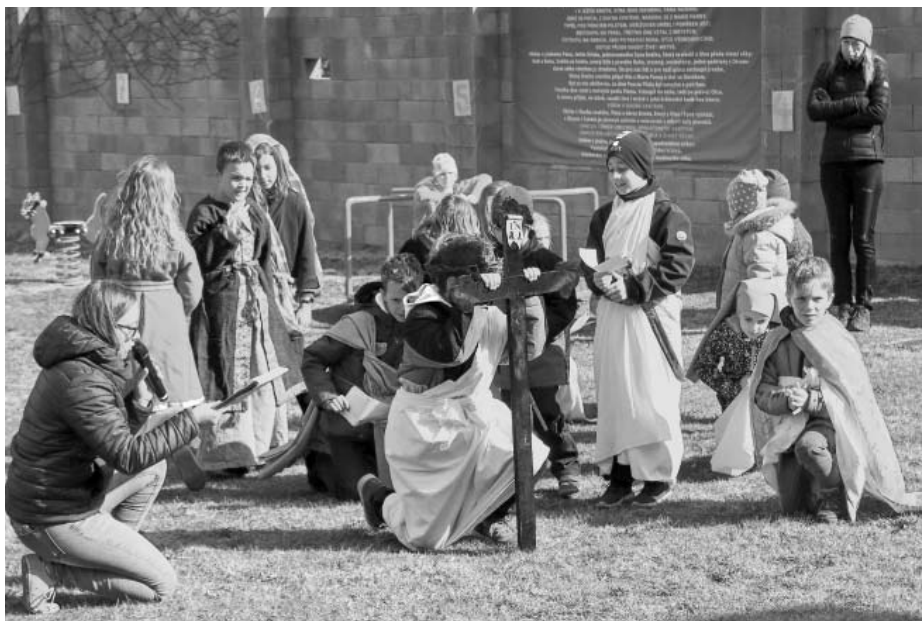
Děti se obuly do svých rolí s ohromným zapálením a zodpovědností.