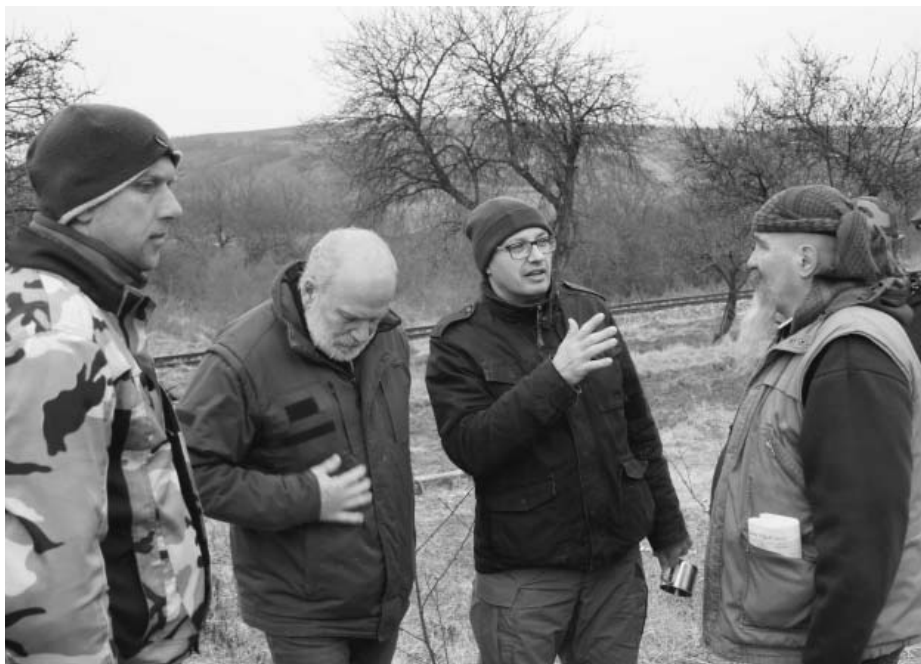
Příprava náročného závodu v terénu není otázkou práce „od stolu“. Organizátoři kuli pikle přesně tam, kde se měl odehrávat a při tom si dali také pěkně do těla.

zecké výstroje, vyšplhají po žebříku do koruny stromu. Tady se zavěsí pod dozorem instruktora lezení na kladku, odrazí se... a následuje krásný přelet Trkmanky i jejich rákosem zarostlých břehů. Pěkné vyvrcholení závodu! Do konce cesty pak už chybí jen asi půl kilometru.