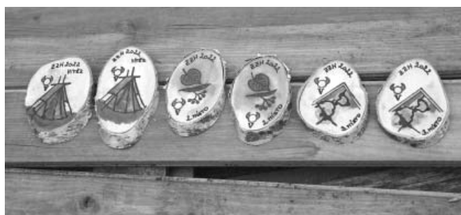
Ti nejlepší si v soutěži „Zimní závod hlídek Vlků“ vysoutěžili krásné přírodní, ručně vyrobené, medaile.

O kus dál na jih je jediné kritické místo trasy závodu. Asfaltová cesta na zkratce mezi Velkými Pavlovicemi a Bořeticemi je dost často využívána jako závodní dráha málo ohleduplnými řidiči. Proto jsme tady zřídili další stanoviště