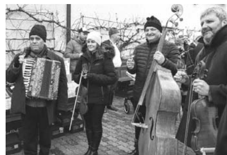
Hudba, tanec, zpěv, lahodné víno, vynikající občerstvení a veselá nálada – toť hlavní atributy ostatkového průvodu.