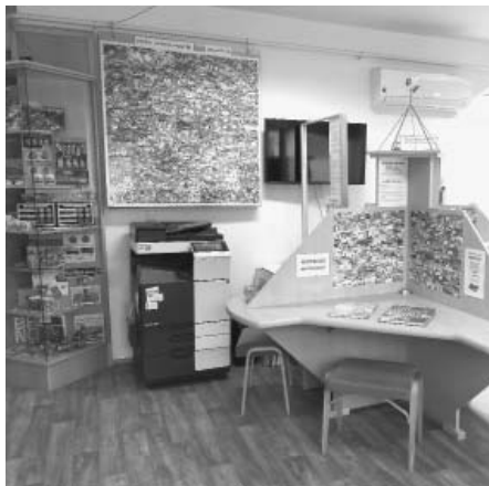
Z PIDIFRKŮ ÓBRFRK! Přijďte se podívat na vystavenou sbírku do místního TIC a knihovny. Budeme se těšit!

Dalším vítaným benefitem pohlednice je skutečnost, že pokud jí pověnujete patřičnou pozornost, nasmějete se! Na každé pohlednici jsou uvedené vtípky, tedy „frky“, ušité na míru onoho místa, kde jste pohled zakoupili. Je nasnadě, že svůj PIDIFRK mají i Velké Pav-