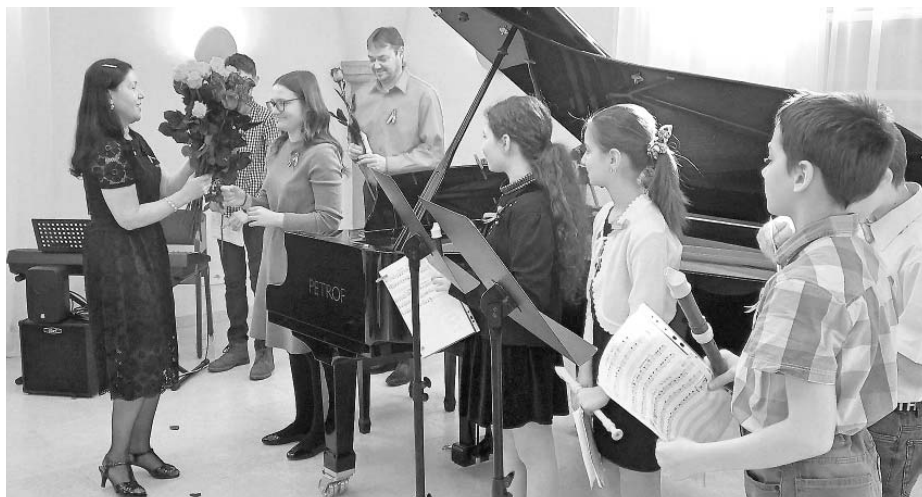
Na charitativním koncertě zahrála nekonečná řada malých a mladých muzikantů z Velkých Pavlovic a okolí