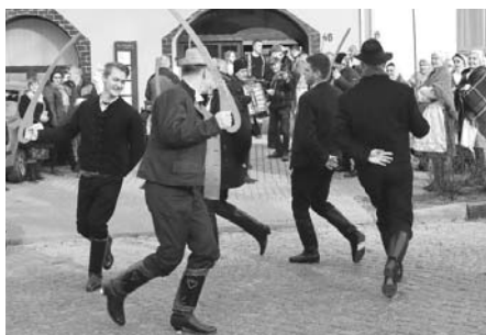
Když Velkopavlovické ostatky, tak „Tanec pod šable“, bez něj by to prostě nebylo ono!

Děkujeme všem, kteří se do realizace této tradiční akce zapojili. Všem účinkujícím velký dík za tance a zpěvy v tomto počasí, Floriánkům, že vydrželi až do poslední zastávky, hospodářům za zajištění výborného tradičního