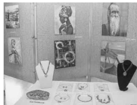
Na výstavě Šikovné ruce nechyběly obrazy, šperky z korálků, malované kameny.