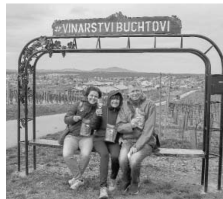
Brána u vinohradu Vinařství Buchtovi sklídila obrovský úspěch. Nenašel se snad ani jeden účastník akce, který by se zde nezvěčnil.