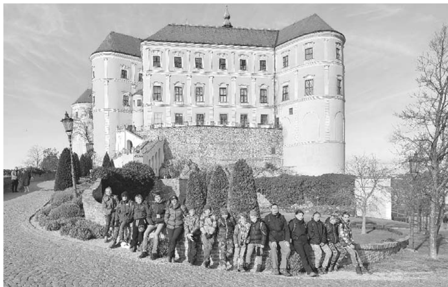
Velkopavlovičtí Vlci na společném snímku před zámkem v Mikulově.

Druhá část ZOO, areál B, je koncipována spíše volněji. S venkovními výběhy – ohradami