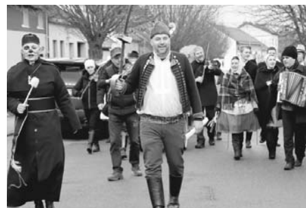
Průvod plný roztočivých stvoření ve spoustě masek a kostýmů. Radostná atmosféra dávala tušit, že nastal fašankový čas.