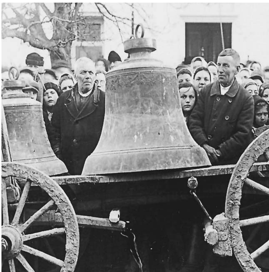
Zrekvírování zvonů dne 8. dubna 1942.