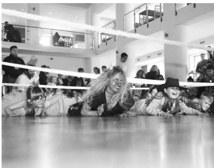
Máte problém s leštěním parketu? Inspirujte se!