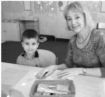
Zápis do první třídy děti zvládly na jedničku. Kéž se jim po celou dobu školní docházky daří stejně dobře a s úsměvem na tváři.

Odpoledne proběhlo v příjemné a milé atmosféře. Děti se seznámily se školním prostředím, ukázaly, co už umí a dovedou. Hravou formou poznávaly zvířátka, barvy, malovaly obrázky, zpívaly a procvičovaly jazyček při rozhovoru s paní učitelkou. Vyzkoušely si