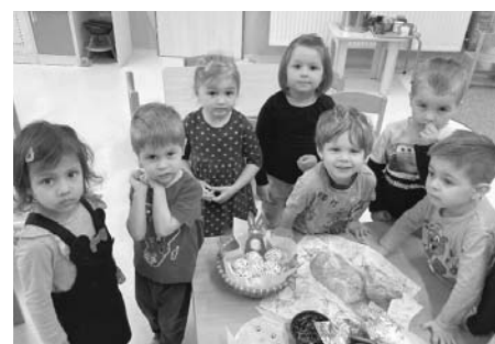
Napečeno, nazdobeno, připraveno! Velikonoce mohou začít!

Kolektiv zaměstnanců Mateřské školy Velké Pavlovice