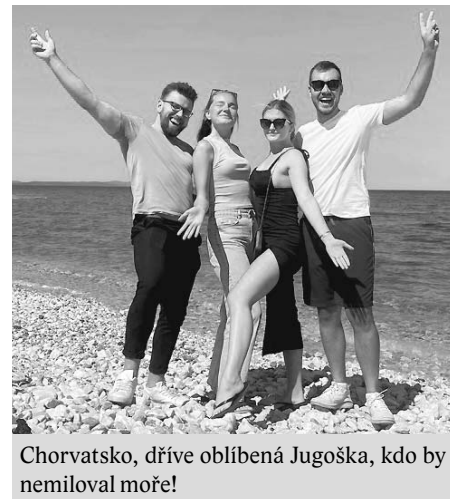
Chorvatsko, dříve oblíbená Jugoška, kdo by nemiloval moře!

Náš poznávací výlet Zadar(mo) pokračoval další den v nádherné katedrále svatě Anastázie ze Sirmina, která je největším chrámem v Dalmácii. I přes to, že byl velký velikonoční svátek a konala se zde mše, mohli jsme nahléd-