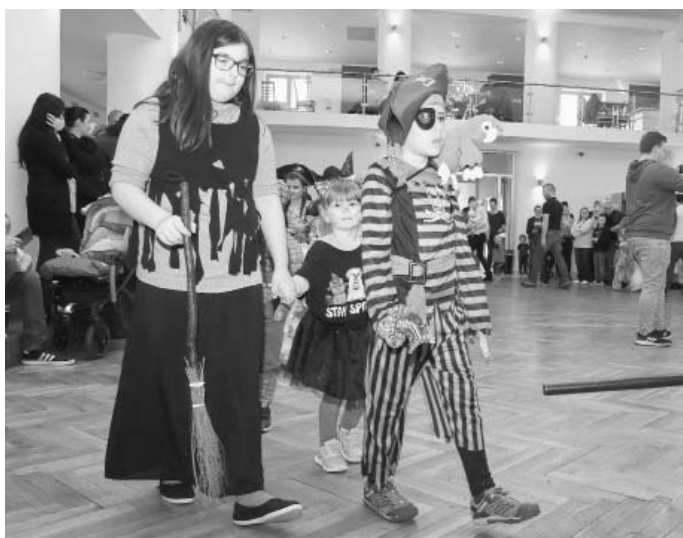
Každá maska se musí řádně představit a ukázat se ostatním. Právě z tohoto důvodu začíná každý maškarní bál průvodem masek.