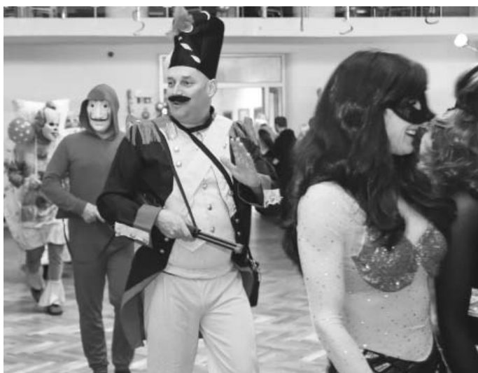
Do průvodu masek se o letošních Šibřinkách vydali i uniformovaní. Pořádek musí být!