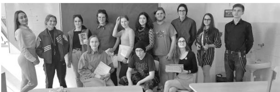
Poznáte je? Do jednoho učí na našem gymplu! Nenechte se zmást, že mohou na první pohled vypadat jako studenti septimy...

Určitě není překvapením, že právě poslední možností je doménou studentů, plných života, překypujících skvělými a neotřelými nápady. Jeden z nich zrealizovali studenti třídy septima velkopavlovického gymnázia právě v rámci letošního Dne učitelů a dali svým vyučují-