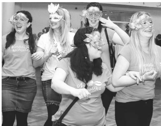
Svatba teprve bude, ale nevěstinka to se svými „spolupičkami“ rozjely s předstihem!