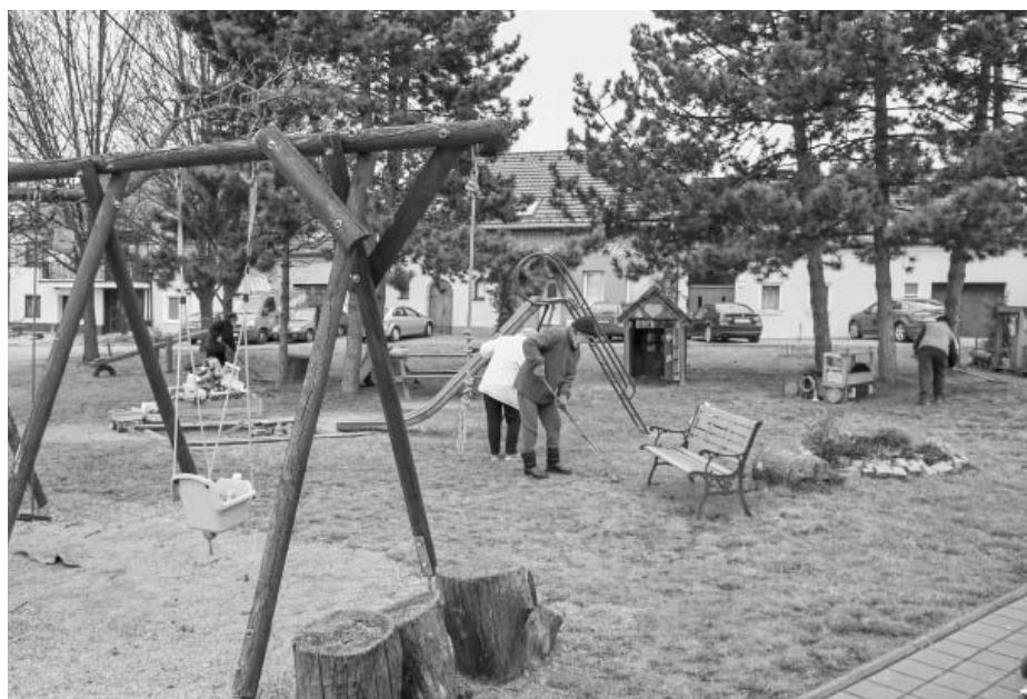
Členové Klubu důchodců uklízeli hned na několika místech po městě. Na snímku na ulici Čechova na hřišti pro děti.

Uvědomují si strůjci a vlastně i nestrůjci nepořádku jednu zásadní věc? Že kdyby nebylo nepořádných lidí, pořádní lidé by po nich nemuseli uklízet? Že ty, co odpadky zahazují, vytváří černé skládky a jsou neohleduplní ke svému životnímu prostředí, rozhodně mezi brigádníky nenajdeme? Že po těchto hulvátech pak uklízí slušní pořádkumilovní lidé? A že je jim dokonce