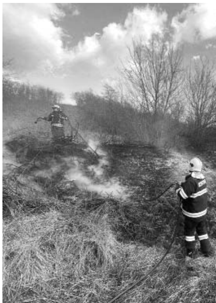
Právě takto dramaticky může dopadnout obyčejné vypalování suché trávy na mezi.

Počty výjezdů velkopavlovičských hasičů dle obcí: 5x Velké Pavlovic, 3x Velké Bílovice, 1x Šakvice, 2x Rakvice, 4x Němčičky, 2x Kobylí, 6x Hustopeče, 1x Bořetice, 1x Boleradice, 1x