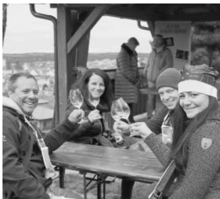
Nejen víno bylo kvitováno s ohlasem, ale také vyhlídky do kraje. Na snímku altán nad Vinařským penzionem André.