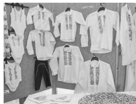
Chybět nemohl folklór, při pohledu na vyšité mužské košile mnozí němě užasli. Nádhera.