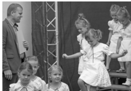
Kdo prošel velkopavlovickou školkou, nezůstal Sadováčkem nepolíben. Stejně jako tyto roztomilé děti.