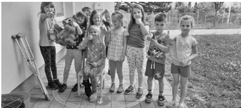
Malí předškoláci mají před sebou nezapomenutelný zážitek. Schyluje se k předškoláckému nocování ve školce. Tak dobrou noc!

Kolektiv pedagogů Mateřské školy Velké Pavlovice