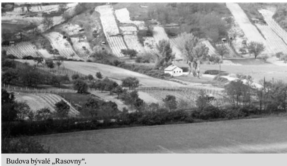
Budova bývalé „Rasovny“.