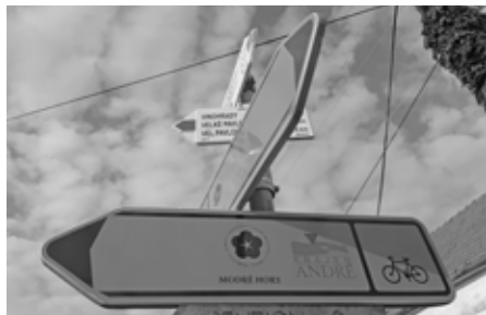
Rozcestník cyklotras s novým kvítečkovým logem Modrých Hor. Doufáme, že se neztratíte!

Modrohorské obce Němčičky, Kobylí, Vrbice a město Velké Pavlovice na hranicích Modrých Hor vítají své návštěvníky s novými uvítacími