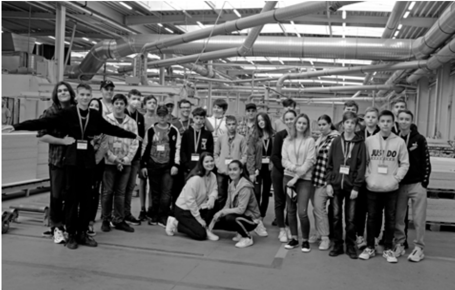
Devětáci se v rámci projektu „Řemeslo má zlaté dno“ zajeli podívat do Brumovic, do nábytkářské firmy Blanář Nábytek, a. s..