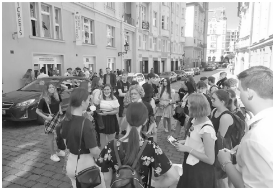
Toulání ulicemi matičky Prahy, ale ne ledajaké. S odborným výkladem nadšeného erudovaného průvodce.

Následovala opět zhruba hodina osobního volna, kterou jsme mohli vyplnit dle svého vlastního uvážení, než přišel čas se přesunout do divadla Pod Palmovkou. Druhé divadelní představení, které jsme během třídní exkurze v Praze navštívili, neslo název Žit-