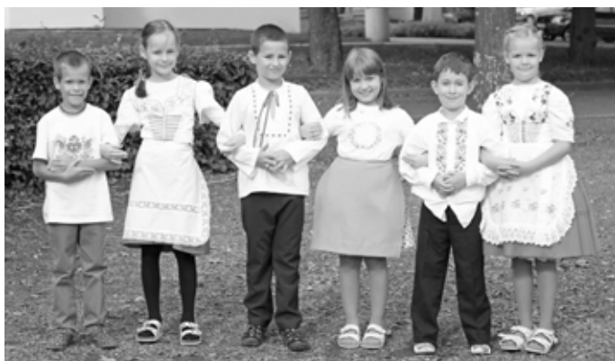
Krojovaní žáci třídy 2.B. Dětem se v krojích moc líbilo, klidně by tak chodily do školy každý den!