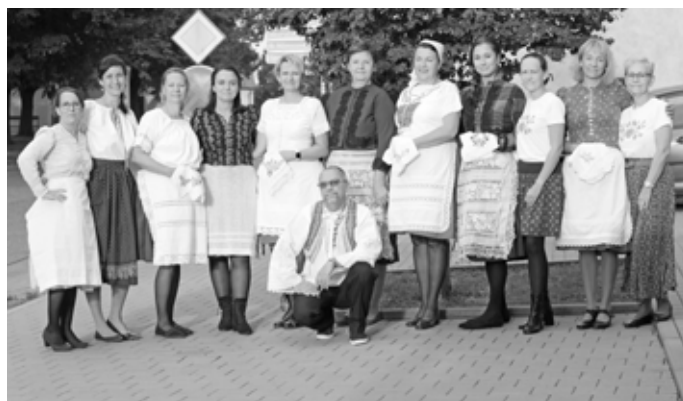
Učitelé z I. stupně velkopavlovické základní školy. No nejsou úžasní? Palec nahoru!