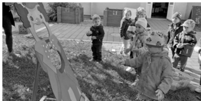
Znáte tuto sportovní disciplínu? Stačí se trefit, ale věřte nebo ne, úplně jednoduché to tedy opravdu není!