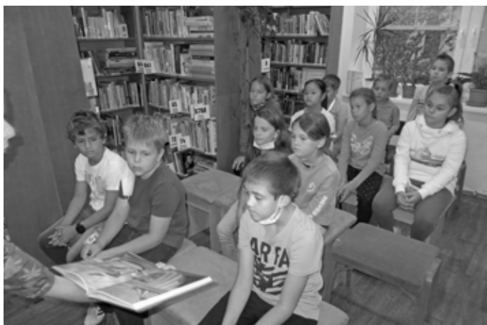
Žáci třídy 3.A na besedě v knihovně.

Po ukázce z knihy už děti neposedně poposedávaly, takže byl pravý čas na úkol, který si pro ně knihovnice připravila. Rozdělení do tří skupinek dostaly svůj stůl s osmi dětskými