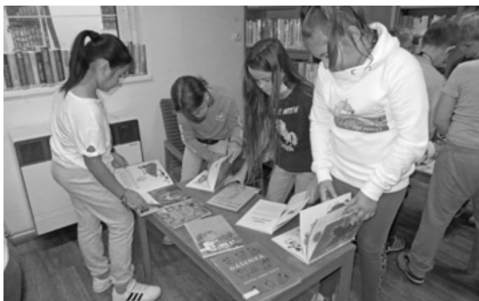
Jak to tak vypadá, holky ze 3. A jsou velmi náruživé a nadšené čtenářky. Z vystavených knížek byly nadšené.