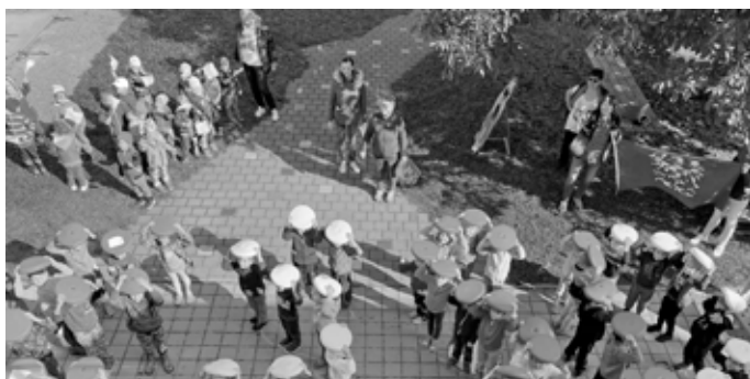
Děti z mateřinky sportovaly, zúčastnily se „Evropského sportovního dne“. Všechny byly moc šikovné a zapálené, všechny zvítězily!

Kolektiv pedagogických pracovníků Mateřské školy Velké Pavlovice