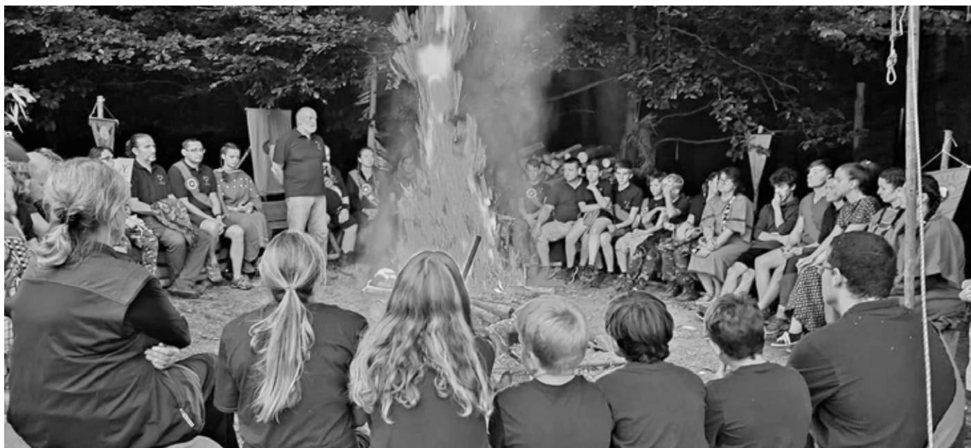
Tradiční Sněm kmene Vlků roku 2021.