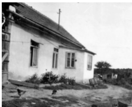
Domek, kde žila rodina zahradníka Velčeva. Nacházel se přímo na pozemku zahradnictví, v dnešní lokalitě „Zahájka“.