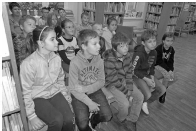
Žáci třídy 3. B na besedě v knihovně.