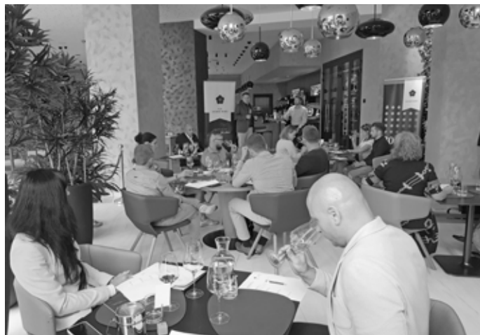
O seznámení s vínem z úst nejerudovanějších odborníků byl ohromný zájem. Restaurace v hotelu Passage se zaplnila do posledního místa.