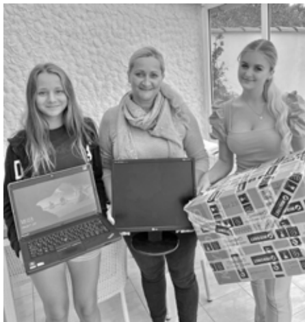
Není lepšího pocitu než rozdávat radost. Navíc, když darem pomůžete v náročné životní situaci.

Já osobně jsem se nikdy žádnou konkrétní charitou nezabývala, protože jsem se bála, kam se moje peníze nebo věci, které daruji, dostanou. Nad tím se zamyslel asi někdy každý z nás, jestli můžeme v dnešní době všem a všemu věřit. Můj názor a pohled na charitu změnil až projekt Počítače dětem, kterému se za posledních pár měsíců věnuji.