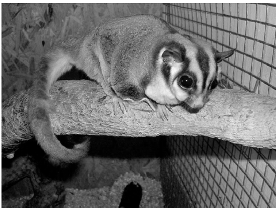
Roztomilá okatá vakoveverka létavá – nový obyvatel mini ZOO sídlící v Ekocentru Trkmanka ve Velkých Pavlovicích.

Nabídka vzdělávacích programů ekocentra byla obměněna a aktualizována s využitím malých pomocníků – živých zvířátek. V programu k výuce tak vypomáhá Eliška – Ježek bělobřichý, Sisi – Sysel Richardsonův, oby-