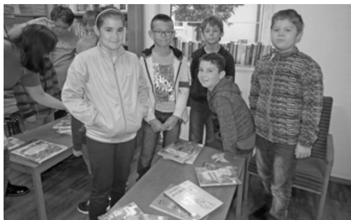
Děti ze 3.B nezaujal jen Kočkopes Kvído, o kterém se besedovalo, ale také spousta dalších knižních hrdinů.