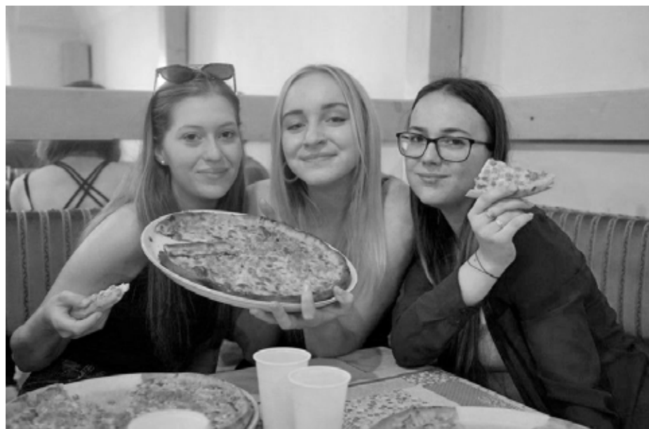
I pohyb žvýkacích svalů se počítá, takže – „Let's move it!“

zvané „coffee break“, a hodinovou obědovou přestávku. Během sessions byl vždy naplánovaný rozmanitý program.