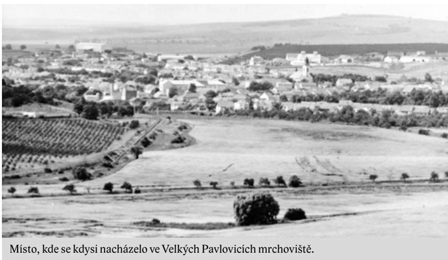
Místo, kde se kdysi nacházelo ve Velkých Pavlovicích mrchoviště.