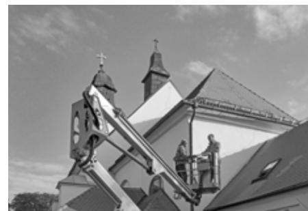
Střecha našeho svatostánku volala po opravě. Tašky jsou vyměněny, déšť nemá šanci!

Po jedenácti letech od kompletní opravy střechy velkopavlovického kostela Nanebevzetí Panny Marie bylo zapotřebí provést menší opravy. Za pomoci vysokozdvizné plošiny byly doplněny chybějící a vyměněny rozbité tašky i hřebenače.