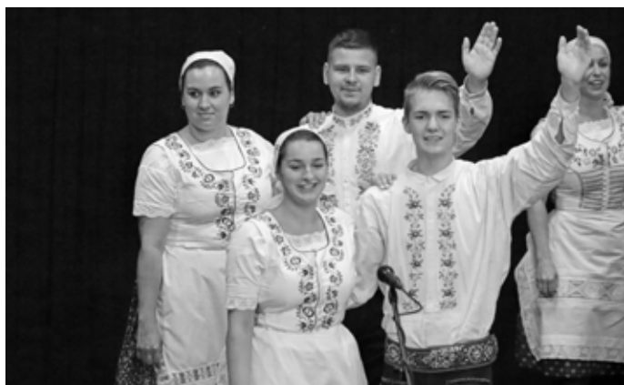
Kdo nemohl chybět, když nastala možnost obléknout se do kroje? No přece tanečníci a zpěváci Hanákoslováckého krúžku.

Akci DÁME KROJ jsme vzali jako výzvu pro předávání a uchovávání tradic pro naše děti a jejich děti. Díky podpoře města, spolku Velkopavlovické tradice a příspěvkové organizaci Ekocentrum Trkmanka jsme mohli připravit příjemné kulturní odpoledne v místní sokolovně.