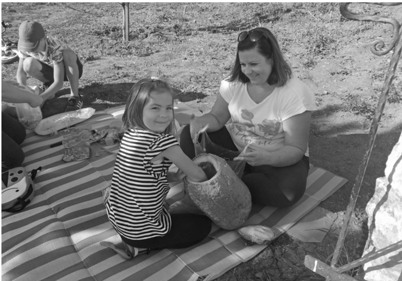
Nejmenším výrobou dýňových strašáků sekundovali rodiče.