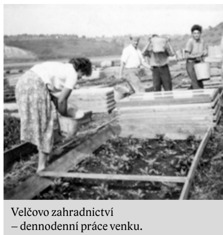
Velčovo zahradnictví – dennodenní práce venku.

Na počátku padesátých let dvacátého století přišli na Moravu Bulhaři, kteří zde začali pěstovat zeleninu. Nejvíce jich zakotvilo v Modřicích u Brna, kde zásobovali zeleninou hlavně nedaleké město Brno.