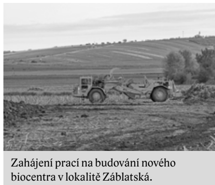
Zahájení prací na budování nového biocentra v lokalitě Zábłatská.

V lokalitě Zábłatská byly zahájeny práce na projektu na výsadbu zeleně a tůň v oblasti Zábłatská. Cílem projektu je vytvořit vodní plochy s litorálními zónami a množstvím vodních a mokřadních biotopů. Ty budou podporovat biodiverzitu a vyšší ekologickou stabilitu krajiny. V rámci projektu půjde o výstavbu tůň, terénní modelace, které budou doplněny o výsadbu v extravilánu Zábłatská.