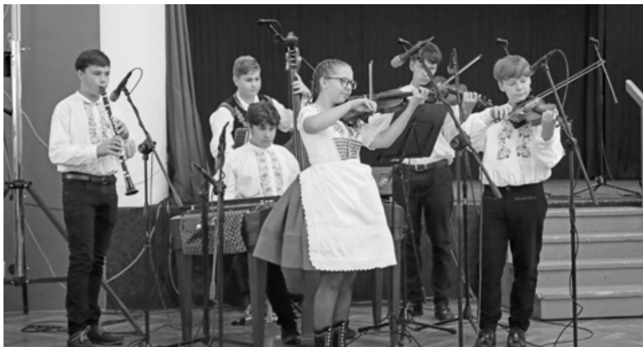
Kdo všechno DAL KROJ? Například dětská cimbalová muzika Palička.

Kulturní komise města Velké Pavlovice hledala způsob, jak zakončit letošní ročník Velkopavlovického léta. Vzhledem k tomu, že se nacházíme ve Velkých Pavlovicích, o kterých se dá říci, že žijí tradicemi a folklorem, bylo jednohlasně přijato připojit se k celorepublikovému happeningu DÁME KROJ dne 28. září 2021.