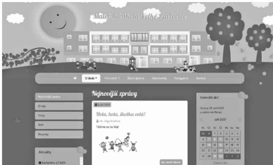
Nové webové stránky Mateřské školy Velké Pavlovice.