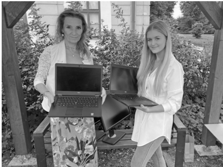
Nastávají občas situace, kdy se děti bez počítačů ve škole skutečně neobejdou. Naposled tomu není tak dávno, všichni školáci si onu situaci na vlastní kůži vyzkoušeli v minulém školním roce, kdy se jim školy uzavřely z důvodu nemoci COVID-19.

Projekt Počítače dětem vznikl za účelem darovat potřebným rodinám počítačovou techniku, abychom jim při podobných situacích, jako byl covid, trochu ulehčili tuto situaci. Počítače projekt dostává od dárců, kterým se můžete stát i vy. Po vyplnění žádosti počítač