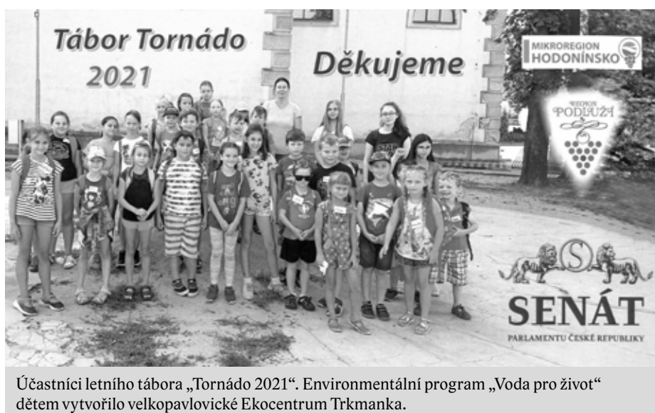
Účastníci letního tábora „Tornádo 2021“. Environmentální program „Voda pro život“ dětem vytvořilo velkopavlovické Ekocentrum Trkmanka.

Valdštejnské nám. 17/4, 118 01 Praha 1, Tel. +420 732 475 570; hubackovaa@senat.cz