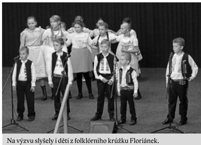
Na výzvu slyšely i děti z folklórního krúžku Floriánek.

V rámci programu se ve dvou pásmech představili Dětský folklorní krúžek FLORIÁNEK s dalšími dětmi, které chodí v krojích, Cimbalová muzika PALIČKA, HANÁKOSLOVÁCKÝ KRÚŽEK s Cimbalovou muzikou VINICA a Ženským sborem DAREBNÝ ŽENY, bohužel díky podzimní chřipce ve velkém oslabení PRESÚZNÍ SBOR, Cimbalová muzika LAŠÁR a jako hosté Cimbalová muzika MODRUŠA.