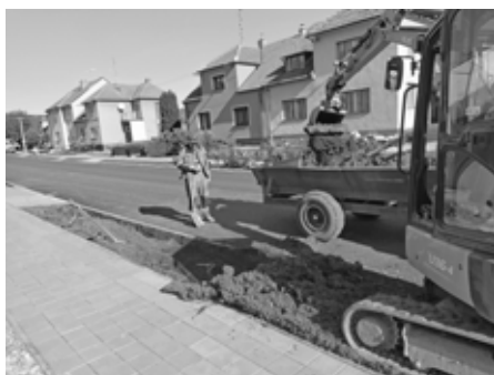
Zahájení rekultivace předzahrádek na ulici Pod Břehy.

Předzahrádky mezi chodníkem a komunikací v ulici Pod Břehy (na straně lichých čísel) budou zrehabilitovány. Úprava spočívá v odbagrování porostů, kamínků a fólie, následně proběhne navezení nové hlíny a osázení