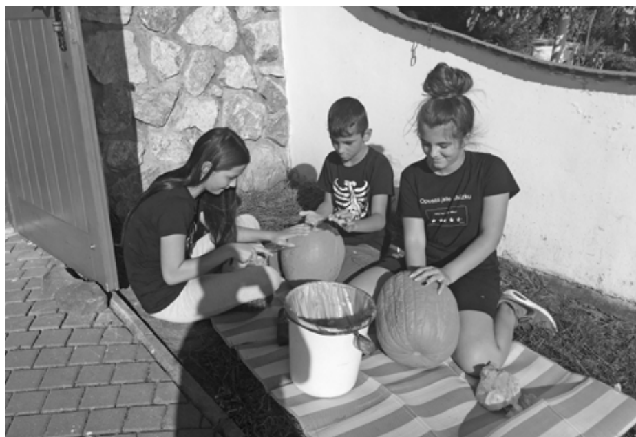
Kdo měl nožík a ruce, vyřezával. Starší děti dokonce naprosto sami a bez pomoci.

S velkým výdejem energie přichází hlad, takže jsme zapálili fatru a začali se opékat v horku z ohně společně se špekáčky. A při jídle si mohli ti pozornější užít i nádherného oranžového západu slunce nad Pálavou.