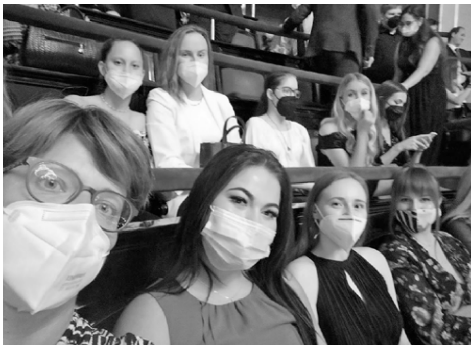
Velkopavlovičtí maturanti ve „Zlaté kapliče“. Uhádnete, kde že jsme to zvěčnění?