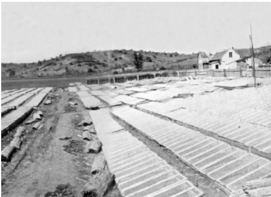
Pařeniště Velčova zahradnictví zabíralo celý hektar.