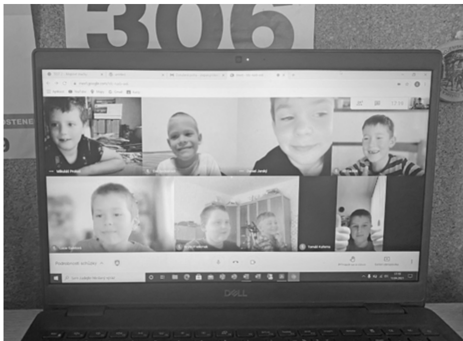
On-line schůzka velkopavlovických skautů. Díky Covidu-19 jsme se scházeli virtuálně, ale nakonec to byla navzdory prvotním obavám a ostychu ohromná legrace!