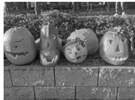
Výsledek letošního dýňobraní. Armáda oranžových strašáků.