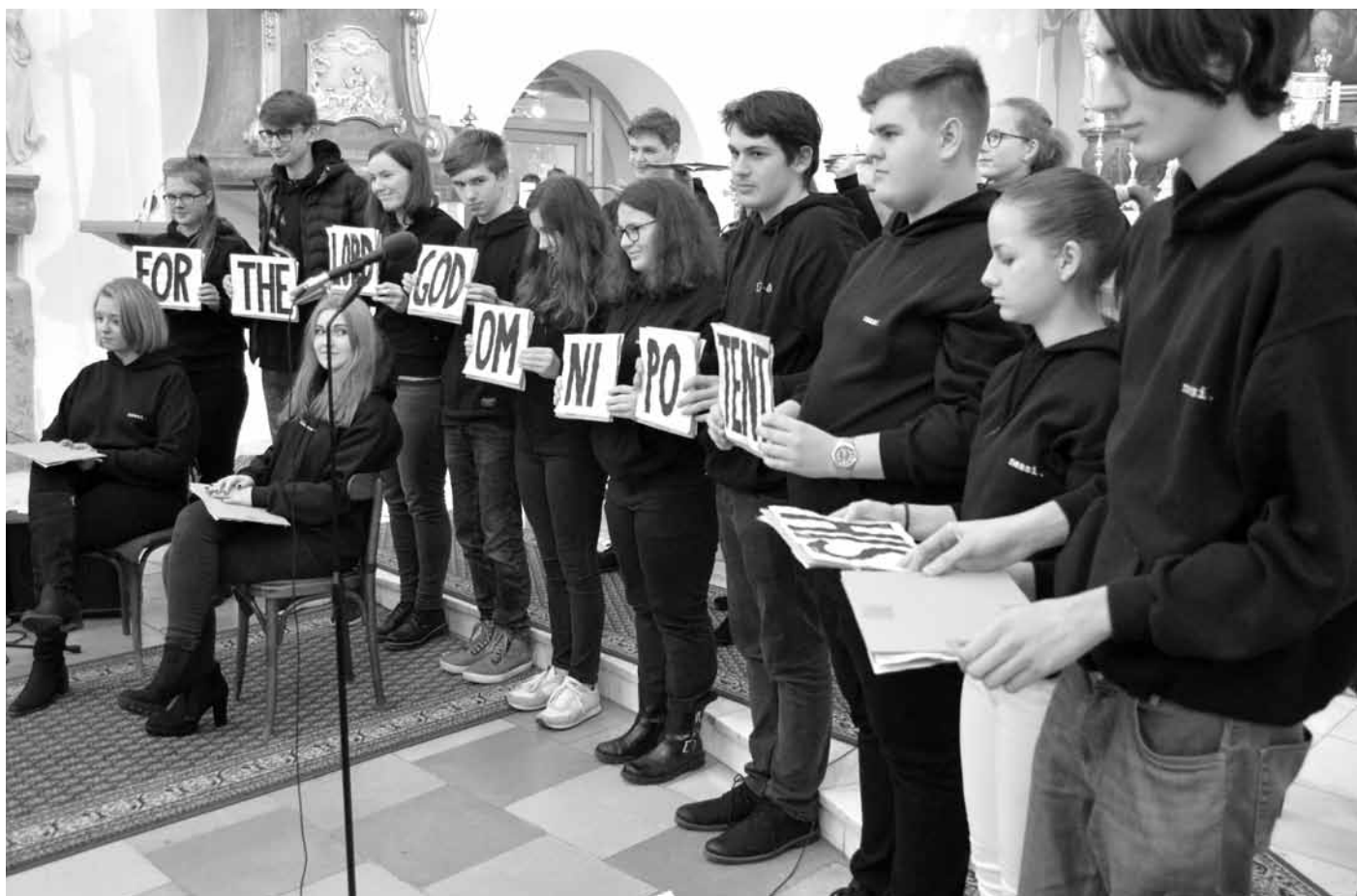
Charitativní vánoční koncert studentů v kostele ozvláštnilo hudební vystoupení němých zpěváků.