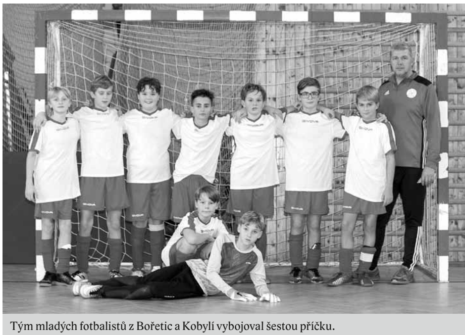
Tým mladých fotbalistů z Bořetic a Kobylí vybojoval šestou příčku.