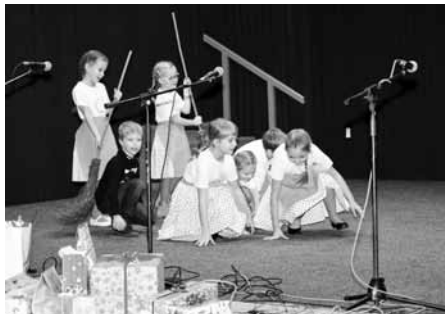
Na benefičním koncertě nechyběly ani děti z dětského folklorního souboru Floriánek při Ekocentru Trkmanka.

Koncertu se zúčastnily místní soubory – Dětský folklorní kroužek Floriánek, dětská cimbálová muzika Palička, dětská cimbálová muzika Modruša z Moravského Žižkova a samozřejmě pořadatelé – Hanáckoslovácký krúžek a Hanáckoslovácký sbor.