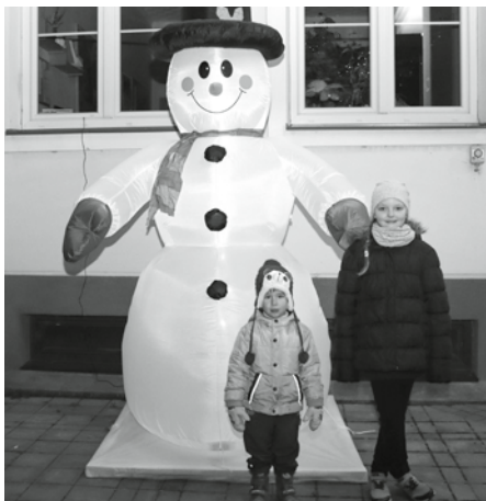
Sněhulák! O letošní nebyvale mírné zimě jste snad ani jiného nemohli uvidět.