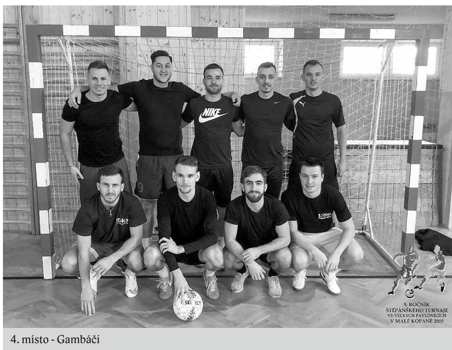
4. místo - Gambáči

sah rozhodl o tom, že si Gambáči odnesli bramborové medaile, BOCA mohla slavit alespoň třetí příčku.