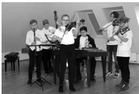
Vánoční koncert pro žáky základní školy – vystoupení dětské cimbálové muziky Palička.