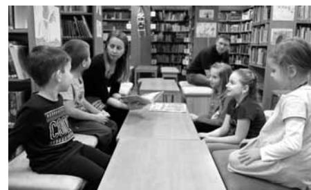
Co bylo na programu předvánočního setkání v knihovně na první položce? No přeci čtení, tentokrát o nákupu kapra.