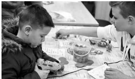
Jarmark bez Ježíškovy dílničky? Pro tvůrčí a kreativní děti nemyslitelné!

Kdo by odolal přijít na velkopavlovický jarmark u radnice a chvíli zapomenout na vánoční shon a smysl postrádající běsnění,