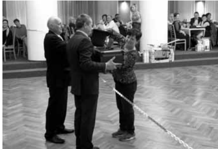
Losování výherních čísel bohaté tomboly. Plesající byli svými „úlovky“ nadšeni.

V sobotu 25. ledna 2020 se po dlouhých letech ve Velkých Pavlovicích konal Společenský ples města Velké Pavlovice. Pro návštěvníky byla připravena bohatá a hodnotná tombola a k tanci a poslechu hrála dechová hudba velkolepá a velmi oblíbená dechová hudba Mora-