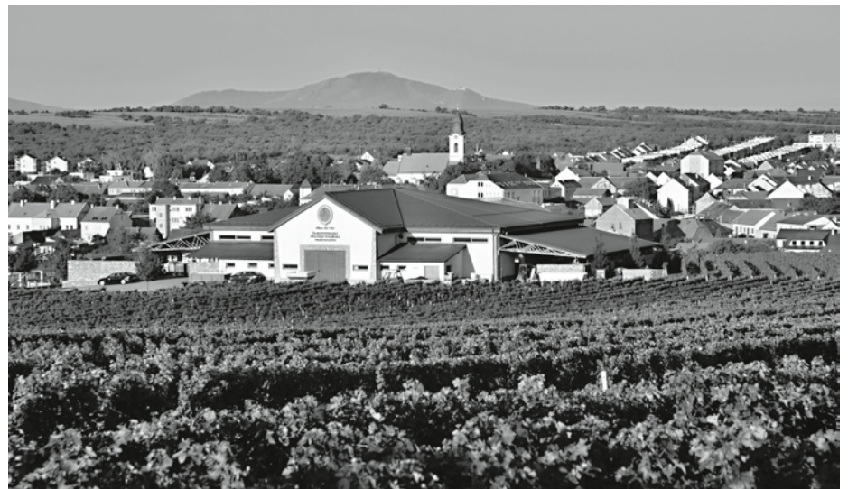
Výrobní hala ŠSV, a.s. ve Velkých Pavlovicích.

Samozřejmě, kdo má doma zvířectvo, ví, co