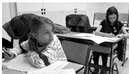
Děti si mohly vyzkoušet i přijímačky nanečisto – testy jednotného celostátního přijímacího řízení.