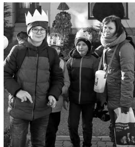
...a pak vyrazili se zapečetěnými pokladničkami do ulic města.