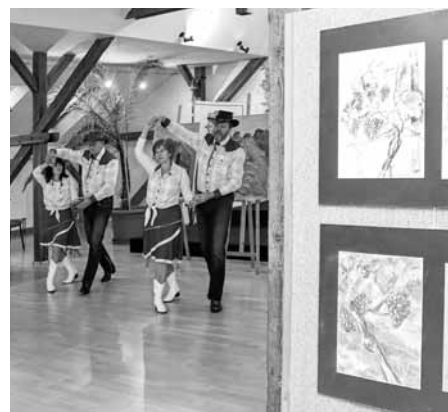
O kulturní program se na vernisáži výstavy Linie a plochy postaralo kvarteto tanečníků Country jízda.