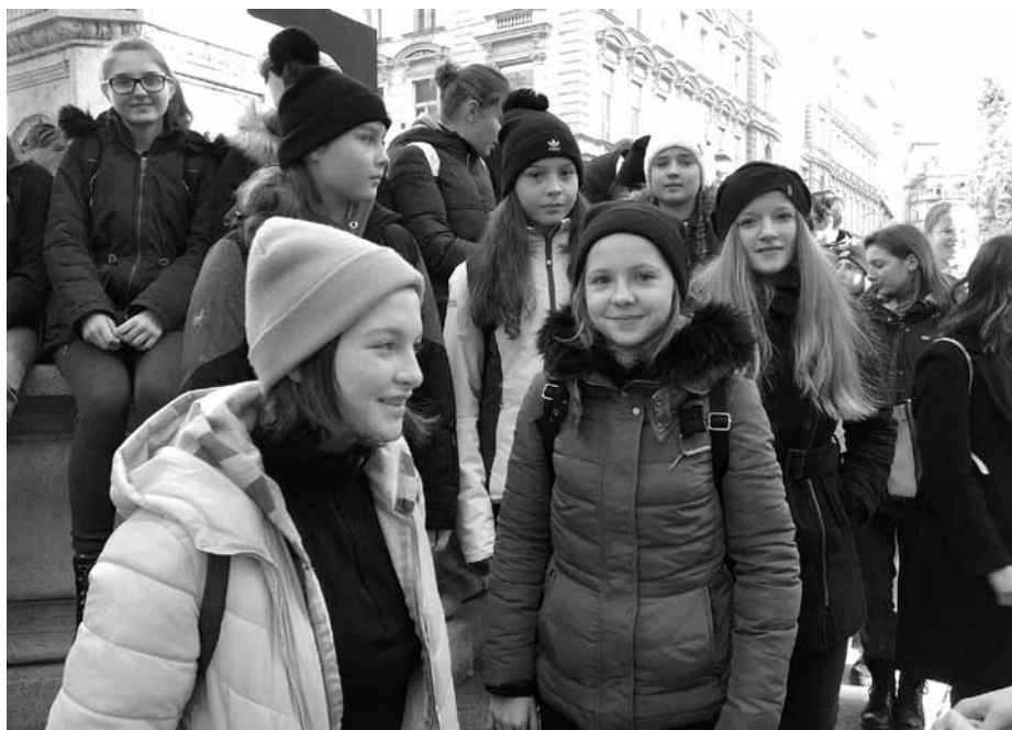
Studenti třídy kvarta zavítali v adventním čase na proslulé vánoční trhy do hlavního města Rakouska, Vídně.