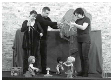
Jakmile se začal odvíjet napínavý příběh z ponurého lesa, ve kterém žije zlá čarodějnice, děti ani nedutaly.