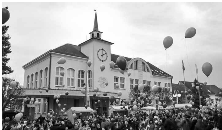
Zlatý hřeb Vánočního jarmarku – pouštění balónek Ježíškovi přímo do nebe i s těmi nejtajnějšími a nejbáznivějšími práníčky k Vánocům.