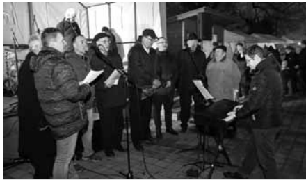
Pár koled si již pod příkrovem podvečerní adventní oblohy plné světélkujících hvězd zanotovali muži z místního Presúzního sboru.

na nekonečné přípravy, úklidy svých domů od půdy až po sklepy, pečení, smažení, vaření, zdobení, smeččení, běhání z jedné besídky a koncertu svých ratolestí na druhou, na nervózní sjíždění stovek internetových e-shopů s vidinou co nejlépejšího nákupu a nejnižší ceny, noční nákupy on-line a tisíce kroků naběhaných od obchodu k obchodu po komerčních přeplněných nákupních centrech v honbě za „best of“ dárkem...? Který nakonec zůstane v záplavě těch ostatních téměř bez všimnutí ležet v nejzapadlejším koutku pod stromečkem... a my, strůjci rádooby "Dokonalých Vánoc", zborcení, vystresovaní, unavení, ospalí, s prázdnou peněženkou a vyběleným bankovním kontem vedle něj... s vtíravou a stále neodbytnější otázkou: "A kam se poděla ta kouzelná atmosféra?" STOP!