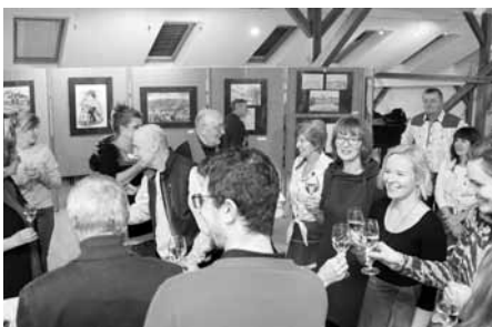
Vernisáž s mikulášským datem se stala příjemnou společenskou záležitostí.

V pátek 6. prosince 2019 v podvečer byla zahájena vernisáží nevšední výstava Základní umělecké školy v Senici – posluchačů výtvarného oboru pro dospělé s názvem Linie a plochy.