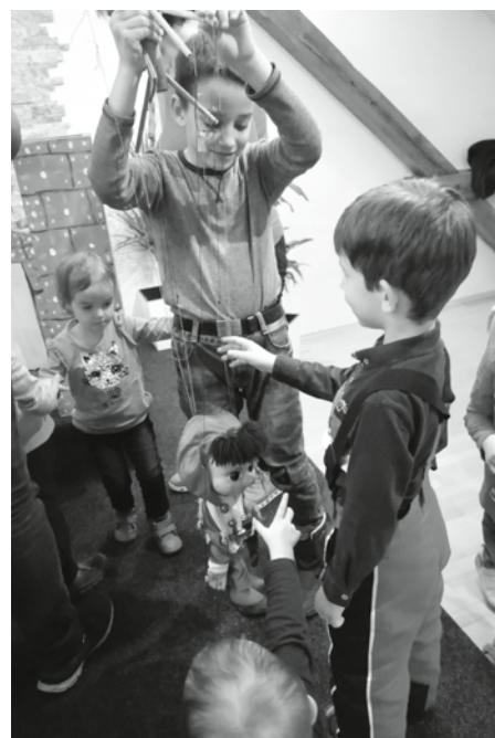
Některé děti byly tak šikovné, že se jim podařilo loutky rozhýbat a tím páde jim vdechly život. Měly z toho ohromnou radost.