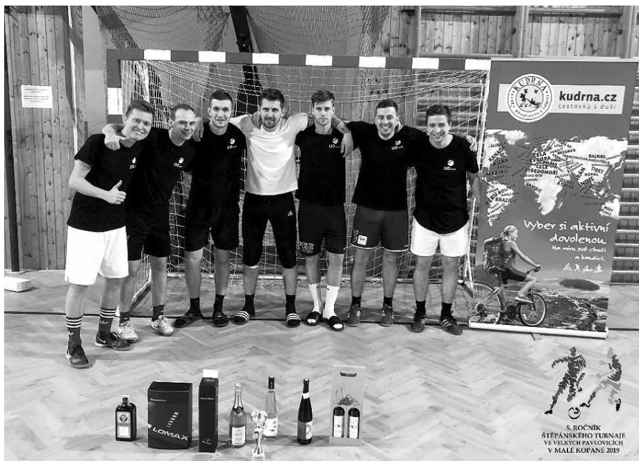
3. místo – BOCA