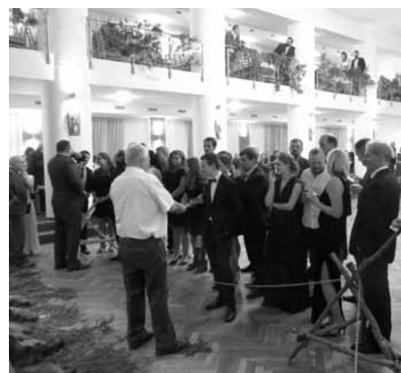
Bohatá zvěřinová tombola je specialitou Mysliveckého plesu.