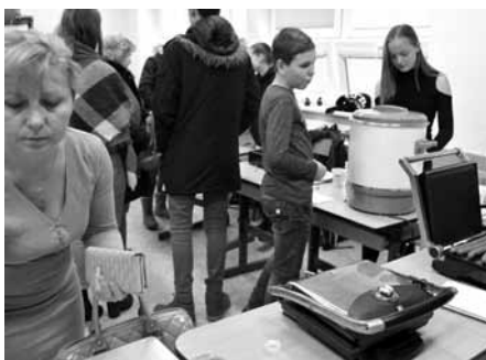
Na jarmarku si mohl každý nakoupit krásné vánoční dárečky z dílen našich studentů a nebo si zakoupit vynikající občerstvení – nealkoholický punč, grilované cigáry, medovník a mnohé další.