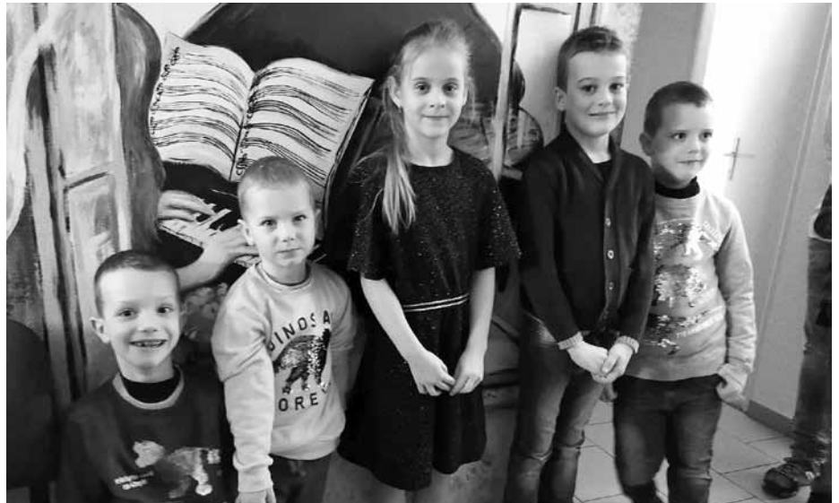
Naši malí zpěváčci zabodovali. V neveřejné kole dětské pěvecké soutěže Zpěváček Hanáckého Slováčka 2020 si všichni vybojovali postup.