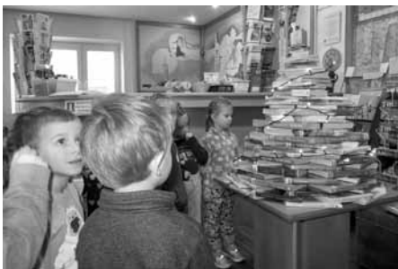
V knihovně našly v prosinci děti úplně jiný stromeček, než jaký mají doma. Knihostromeček!

knihovny. A protože se nechystaly jít po čtení spát, měli jsme čas i na aktivity související s textem knihy. Takže děti hledaly stejné vložky a zkoušely si, jaká fuška bylo dřív nosit lampion tak, aby vám díky svíce uvnitř neuhořel.