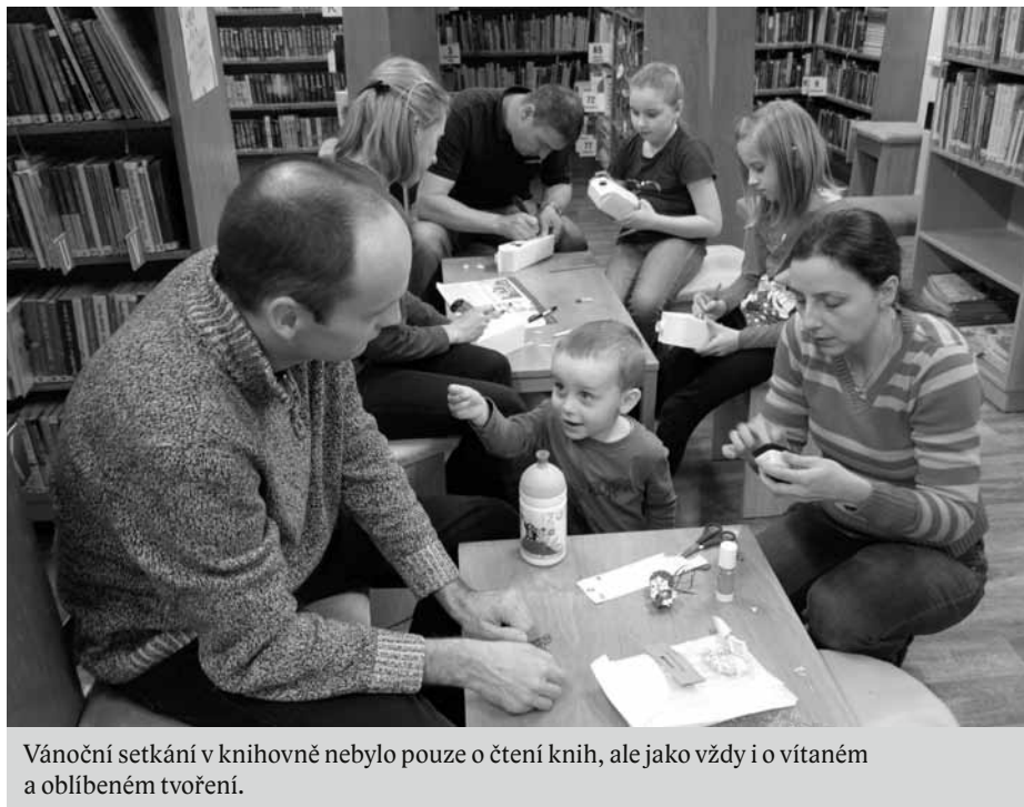
Vánoční setkání v knihovně nebylo pouze o čtení knih, ale jako vždy i o vítaném a oblíbeném tvoření.

Větší slečny se ve stejném čase a za poslechu vánočních koled pustily do tvoření zasněžené-