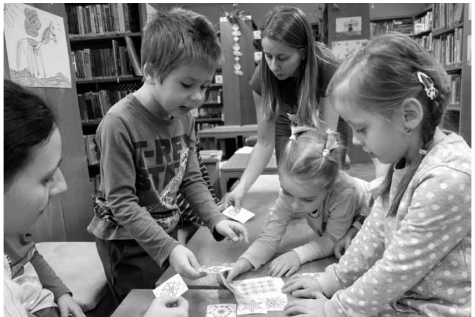
Když je RaČte, tak je vždycky program nějak zpestřen, třeba vločkovým hlavolamem.