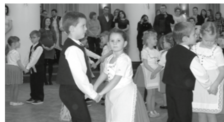
Děti z folklórního souboru Sadováček zatančily na Krojovaném plese Moravskou besedu.