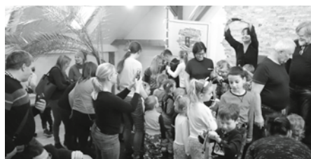
Zazvonil zvonec a pohádky je konec, ale domů ještě nejdeme! Herci nám dovolili se na loutky podívat a dokonce si na ně i sáhnout.