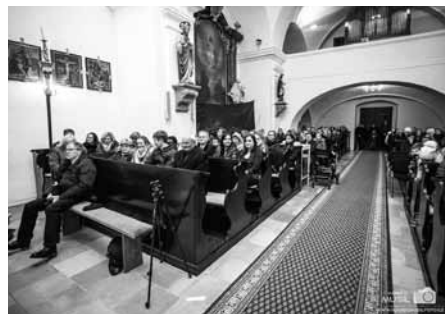
Zájem široké veřejnosti o pomoc nemocné Sárince potvrdila do posledního místečka zaplněná loď velkopavlovického kostela. Děkujeme!

Na závěr bych rád konstatoval, že takových akcí není nikdy dost a jsem rád, že se najdou ochotní lidé na dobré věci spolupracovat a i v této uspěchané době pomoci potřebným. Ono nikdy nevíte, kdy pomoc