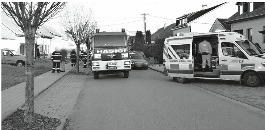
Zásah velkopavlovických hasičů u výjezdu, jehož následky byly bohužel fatální.