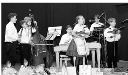
Po potěchu všech milovníků lidové hudby zahrály a zazpívaly děti z místní dětské cimbálové muziky Palička.

Dětem z Dětského domova ve Štítech byla splněna jejich vánoční přání a od milých sponzorů dostali vinné mošty, spoustu hygienických potřeb a pracích a čisticích prostředků.