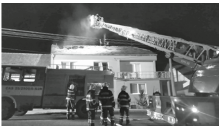
Zásah velkopavlovických hasičů při požáru rodinného domu v sousedních Starovičkách.

domu ve Starovičkách. Vznik příčiny požáru se stal předmětem vyšetřování. Při likvidaci požáru bylo nutné použít dýchací přístroje. Na hasičskou zbrojnici se vrátila vozidla až po třech hodinách od výjezdu.