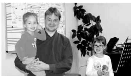
Pololetní zkoušky na ZUŠ, jak vidno, nemusí být vůbec stresující záležitostí!