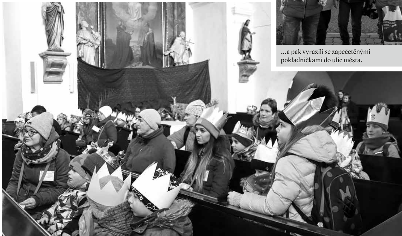
Nejdříve se koledníci jubilejního 20. ročníku sešli v kostele...