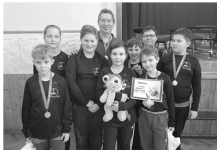
Hasičský dorost využíval ve Starovicích stříbrnou medaili, blahopřejeme!

V sobotu dne 10. února 2020 naši mladí hasiči navštívili nedaleké Starovice, kde se zúčastnili soutěže v uzlování. Starší bojovali za jednotlivce. V této kategorii se účastnilo 21 soutěžících, naši obsadili 7., 13. a 17. místo. Mladší bojovali jako družstvo a umístili se na krásném 2. místě.