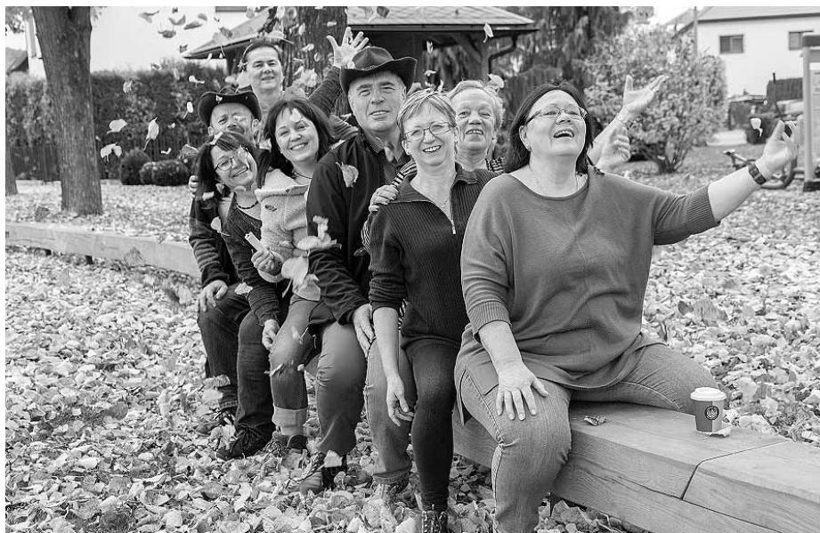
Není nad to umět se radovat ze života, i když je třeba ponurý podzim... Každý den může být zalitý sluncem, když si zatančíte!

Začátkem července vzpomněli velkobílovičtí Sokolové výročí upálení Mistra Jana Husa.