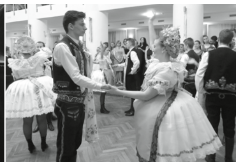
Velkopavlovická chasa se letos blýskla Slováckou besedou, hudební doprovod zajistila dechová hudba Zlatanka.