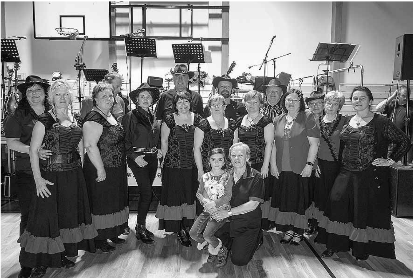
Velkopavlovičtí Přátelé country v celé své kráse – při vystoupení v tanečních kostýmech.