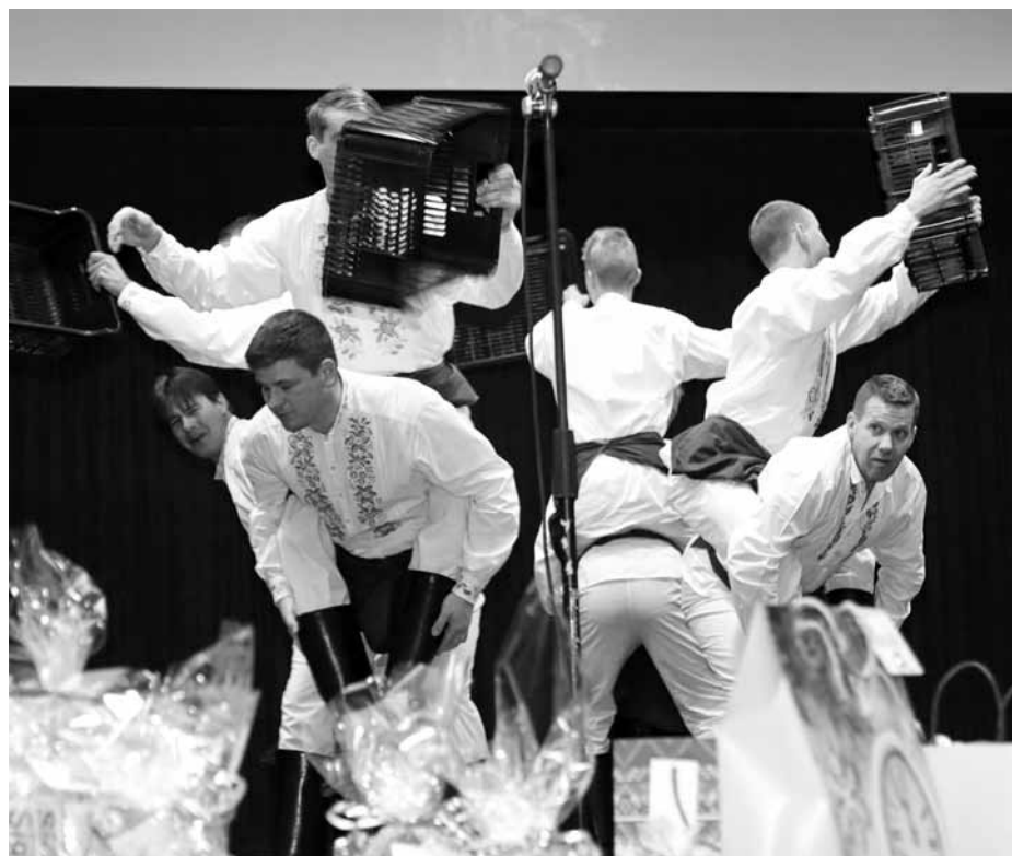
Se skvělým pásmem odměněným dlouhým potleskem vystoupil i folklorní soubor Hanáckoslovácký krúžek.