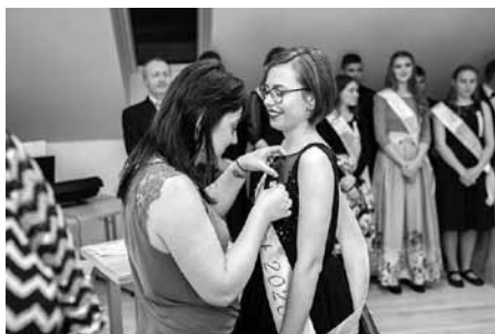
Ze studentů maturanti... Budeme držet palce, zlomte vaz!