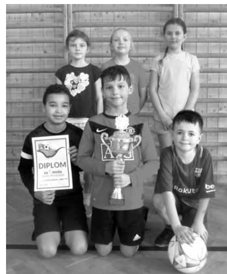
Hrdí vítězové turnaje v sálové kopané s pohárem od samotného starosty města, holky a kluci ze třídy 4. B.

Ve čtvrtek 30. ledna 2020 proběhl na Základní škole Velké Pavlovice tradiční turnaj v sálové kopané „O pohár starosty města“.