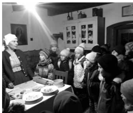
Jaké cukroví se peče dnes a jaké se peklo dříve? O tom si povprávěly děti ve strážnickém skanzenu.

Děvčata a chlapci viděli draní peří, pečení čertů z kynutého těsta, ruční výrobu dřevěných ozdob i hraček. Pouštěli lodičky vyrobené z ořechových skořápek, zpívali koledy, žasli nad vánočním stroměčkem zavěšeným u stropu a viděli, jak se lije olovo. Dozvěděli se, jaké tradice dříve lidé dodržovali na Štědrý den.