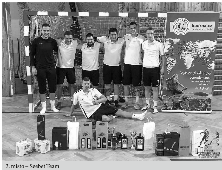
2. místo – Seebet Team