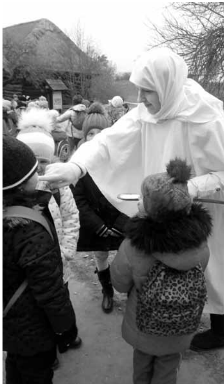
Děti z druhé třídy dnes už ví, že tak trošku strašidelná Lucka toho moc nenamluví a navíc, noci upije.

„Veselte se, radujte se“ - tak se jmenoval výukový adventní program plný tradic a příběhů ve skanzenu Strážnice. Právě tam se v pá-