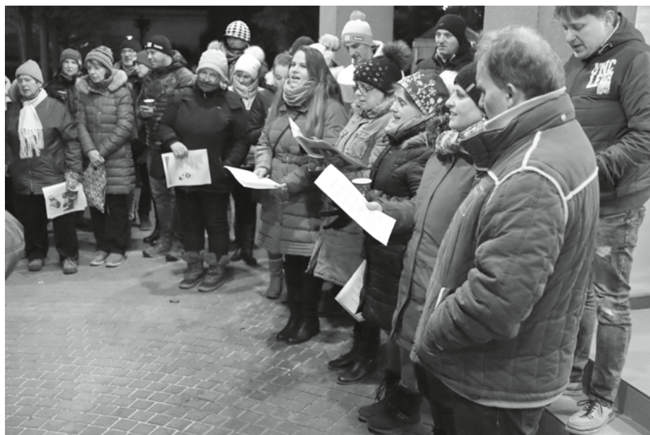
Koledy s celou naší zemí si s radostí a nadšením zazpívali členové pořádajícího Hanáckoslováckého krúžku.