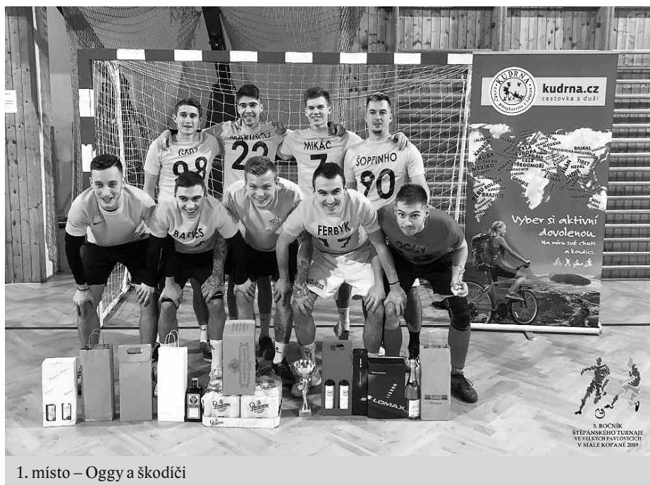
1. místo – Oggy a škodíci

Zápas o bronz nabídl taktický souboj s příležitostmi na obou stranách. Po základní hrací době se však skóre nezměnilo a na řadu tak přišly atraktivní penalty. Jediný úspěšný zá-