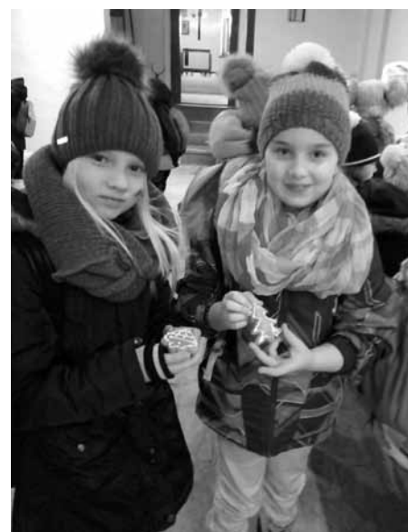
Krásně jsme si vlastnoručně nazdobili perníčky. A jak sladce chutnaly!