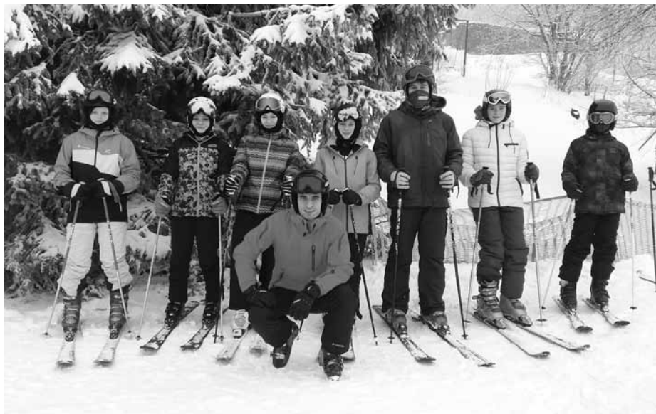
Že by nové naděje sjezdového lyžování? Účastníci lyžařského výcviku v Čenkovicích v Orlických horách.