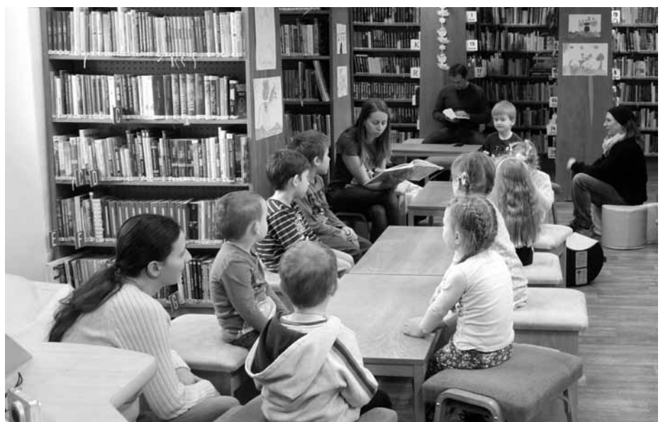
Únorové RaČte s dětmi bylo věnováno zimní knížce Štuclinka a Zachumlánek.