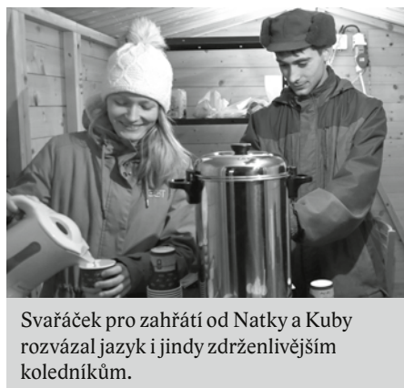
Svařáček pro zahřátí od Natky a Kuby rozvázal jazyk i jindy zdrženlivějším koledníkům.