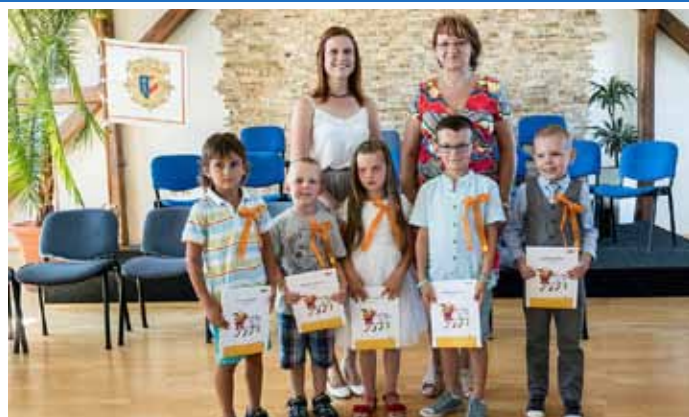
Slavnostní pasování předškoláků na prvňáčky školního roku 2019/2020