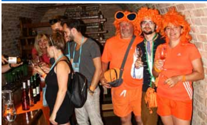
Vino v oranžovém aneb Noční otevřené sklepy 2019