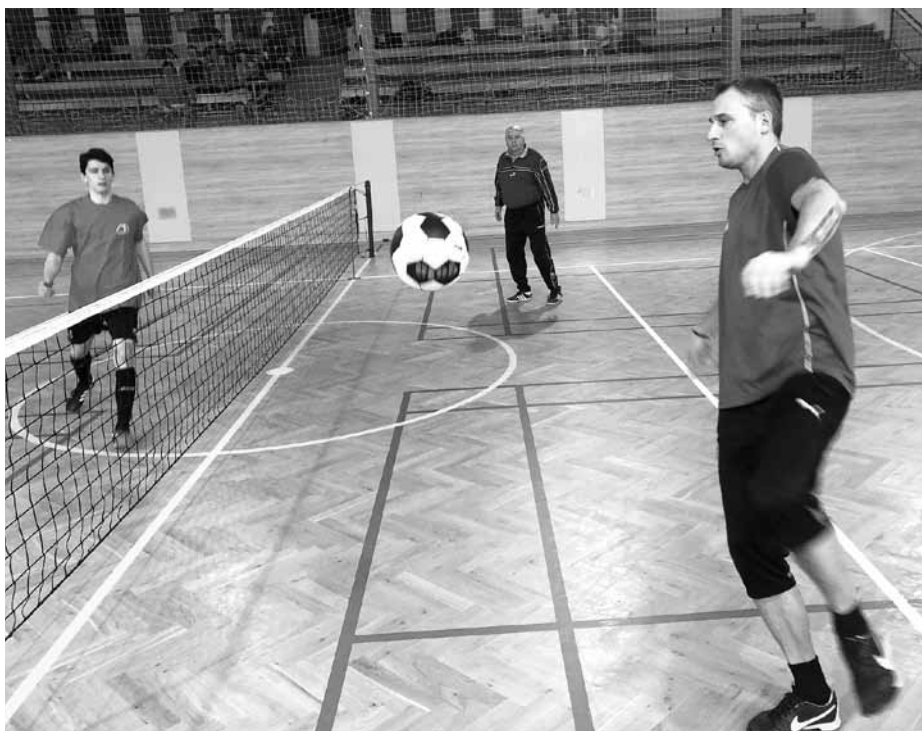
Velkopavlovický 14. ročník Profesionálního turnaje amatérů v nohejbale si ani pro letošek nenechal ujít proslulý fotbalový obránce Karol Dobiaš (na fotografii uprostřed).