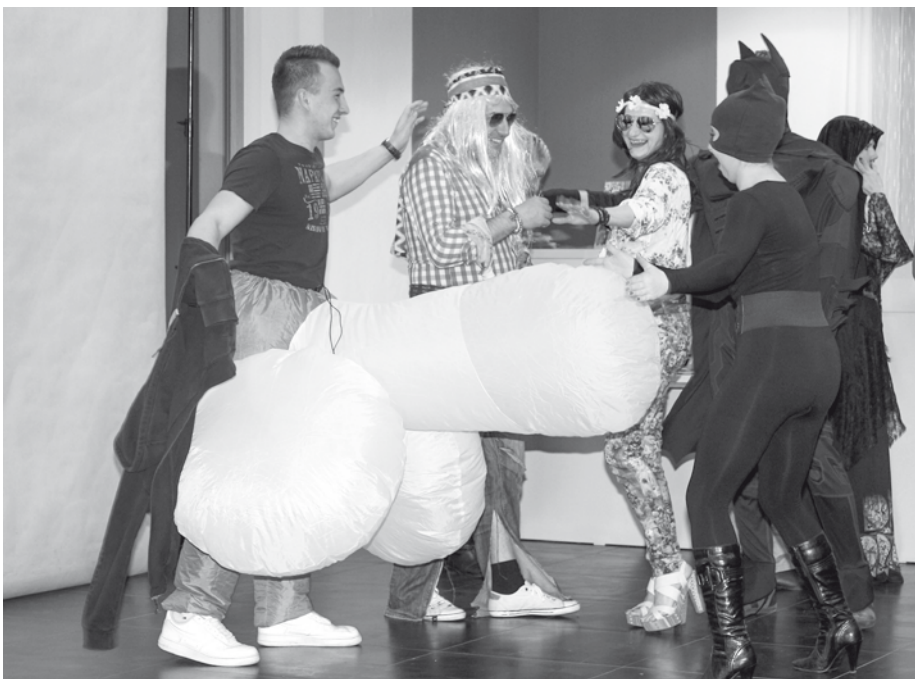
Penis – vítěz kategorie Jednotlivci.

V sobotu 9. března 2019 se konal ve velkopavlovické sokolovně jeden z nejveselejších plesů celé sezóny. Určitě už tušíte, že je řeč o Šibřinkách neboli o maškarním bále.