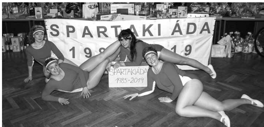
Poupata – stříbro pro odvážné kvarteto cvičenek nejoblíbenější Spartakiády roku 1985.