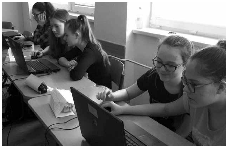
Projekt „Finanční gramotnost“ ve třídě kvarta.

Kritické myšlení je schopnost zručně pracovat se svým rozumem a logikou. Můžeme tak odhalit dezinformace, polopravdy a dopátrat se pravdivých a kvalitních informací. V dnešním světě není náš problém v tom, že toho víme málo, ale to, že mnoho z toho, co víme, není pravda. Spoustu spekulací, takzvaných „fake