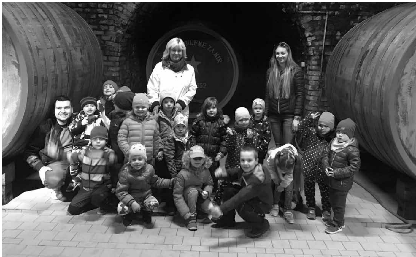
Čím budu až vyrostu? Třeba vinařem! To se u nás ve Velkých Pavlovicích přímo nabízí!