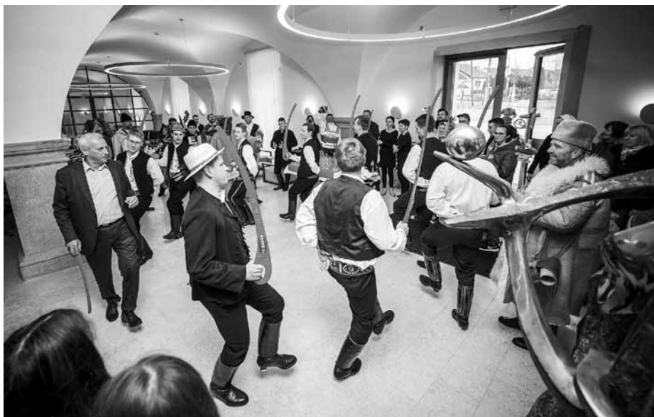
Tanec Pod šable v podání Hanáckoslováckého krúžku v Hotelu Lotrinský.