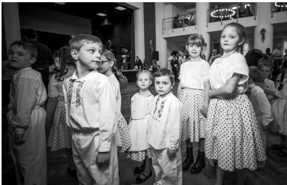
Malí tanečníci z místního dětského folklorního souboru Floriánek.