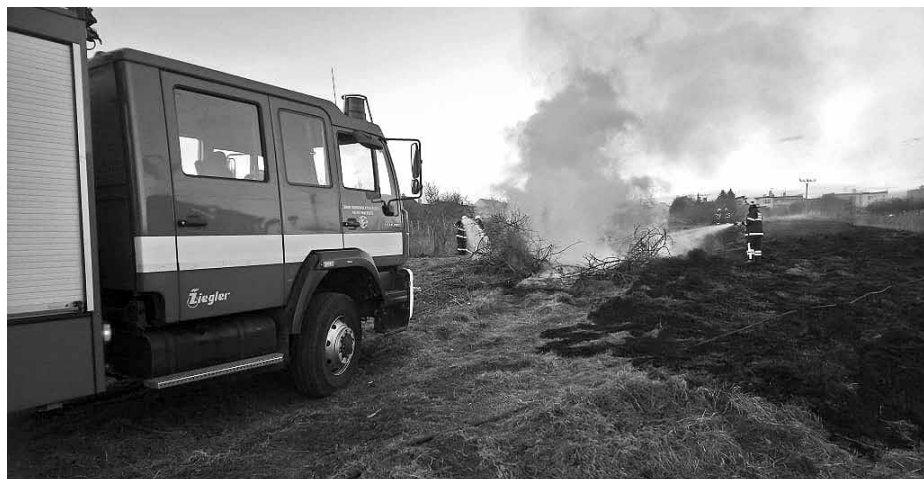
Zdárné zvládnutí požáru vzniklého pálením trávy u Bořetic si vyžádalo zásah čtyř jednotek hasičů.

fukuje, raději oheň nepodpalujte a najděte si jinou práci. Nestojí to za to.