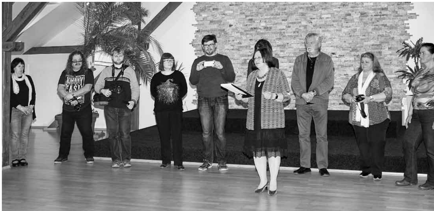
Zahájení výstavy Objektiv 2018 – představení fotografií.