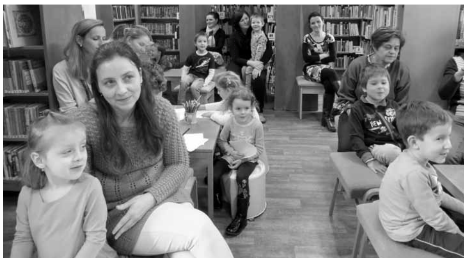
Premiérové setkání nového čtenářského klubu nejmenších dětí a jejich rodičů „RaČte s dětmi“ v městské knihovně.

Kdo si v úterý odpoledne dne 5. března 2019 vyrazil půjčit nějakou knihu, nestačil se asi divit. Volný prostor mezi regály v knihovně totiž zaplnil více než tucet zvířátek. Ne však oprav-