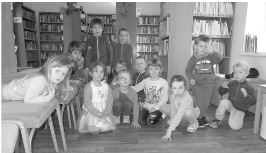
Třída Kuřátek si přišla povyprávět do knihovny o opravdovém přátelství, průvodcem se jim stala kniha Lily a Momo.

Aby to děti ze Sluníček, Kofátek a Berušek neměly tak jednoduché, nevedla jejich cesta do knihovny přímo. Po svačině je venku čekalo hledání pokladu, ke kterému je vedly čtyři kousky mapy a rýmované nápovědy. Všechny místa děti úspěšně našly a dorazily tak na poslední místo zaznačené v mapě – do knihovny.