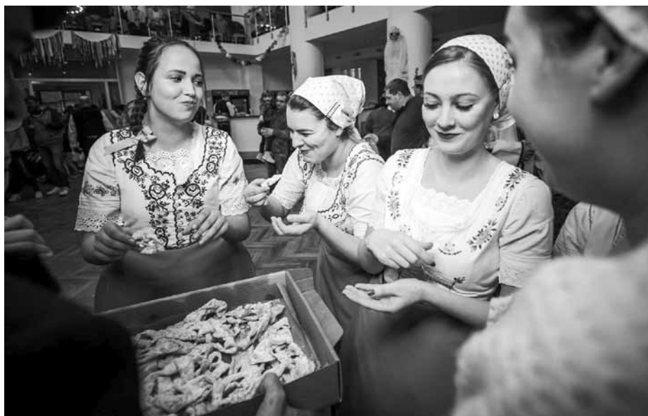
Soutěž o nejlepší „boží milostě“ byla prostě „boží“! Určitě uvěříte, že nezbyl ani drobeček.

promrzli a do sokolovny dorazili právě včas, aby mohl začít další program.