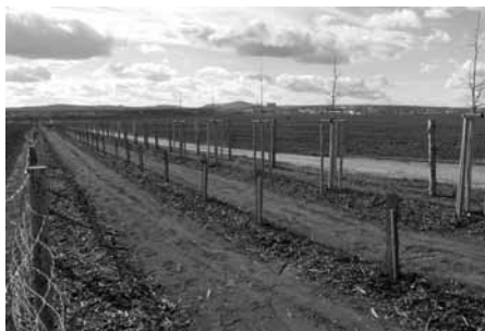
Nově vysazený biokoridor v rámci projektu Založení krajinných prvků v k.ú. Velké Pavlovice I.

Ke konci roku 2018 byla provedena výsadba biokoridorů, které jsou součástí projektu „Založení krajinných prvků v k.ú. Velké Pavlovice I“. Vysazené stromky jsou proti okusu zvěří chráněné ploty z lesnického pletiva a proti plevelům a vysychání půdy vrstvou mulčovací kůry. Nové biokoridory najdete podél dálnice v lokalitě Ostrovec, v tratích Čtvrťky, Záblatská, Trkmanska a podél říčky Trkmanky.