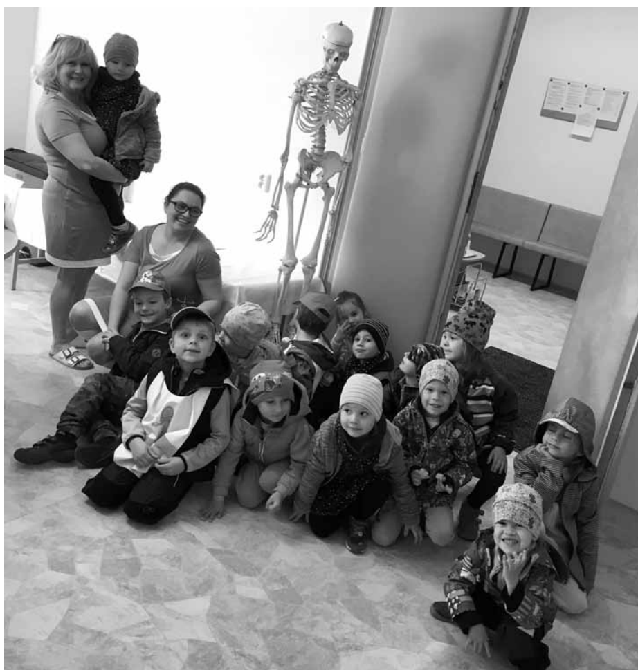
Být zdravotní sestřičkou nebo dokonce panem doktorem je určitě krásné a zajímavé povolání.

Využily jsme krásný poznávací program v Ekocentru Trkmanka na téma „Louka vypráví“. Úžasné paní lektorky dětem přiblížily život včel i motýlků. Velký ohlas mělo sbírání nektaru pomocí pipetek tak, jak to dělají včely. Na jaře se rodí mláďátka, tak jsme je zahrnuli do tématu poznáváme zvířátka a jejich mláďátka. Povíдали jsme si, co jsou to hospodářská zvířátka, co nám dávají, co jí, poslouchali jsme jejich zvuky, učili jsme se o nich básničky i písničky. Využili jsme tématu k výtvarnému tvoření. Za zvířátka se děti vypravily pod šlechtitelskou stanicí a na zahradu rodiny Buchtovy, kde některé starší zkušené děti prohlásily, že je to jak v zookoutku Hodoníně, kde byly na výletě se svými rodiči. Třída Kuřátek využila pozvání svého žáčka z Rakvic a vyjela na jejich rodinnou farmu, kde se to zvířátka a jejich mláďátka jen hemžilo.