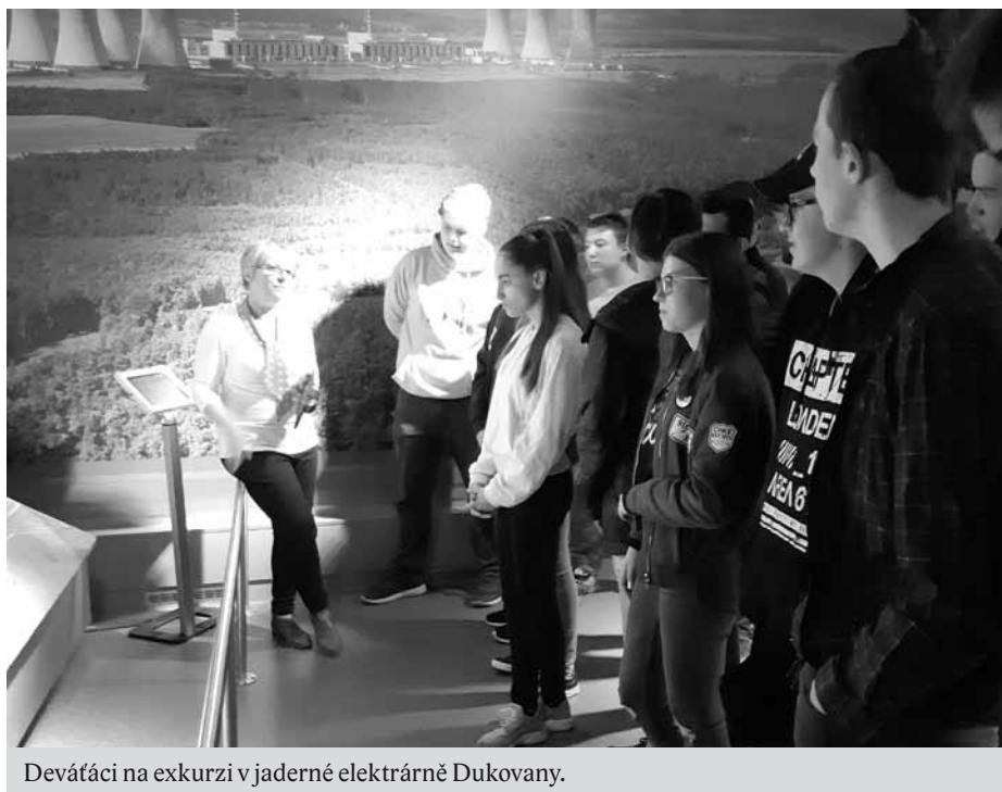
Devětáci na exkurzi v jaderné elektrárně Dukovany.