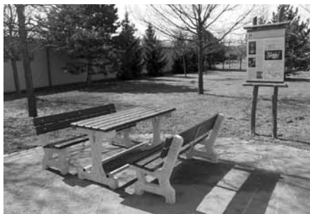
Nové posezení s informační tabulí na zbrusu nové cyklotrase Lednicko-valtický areál – Slavkovské bojiště.