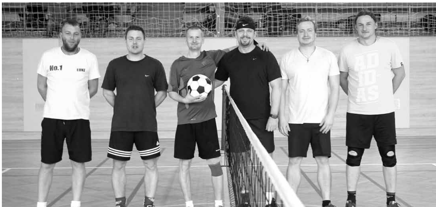
Účastníci 7. ročníku Nohejbalového turnaje ve Velkých Pavlovicích.

Pořadatelé 7. ročníku Nohejbalového turnaje