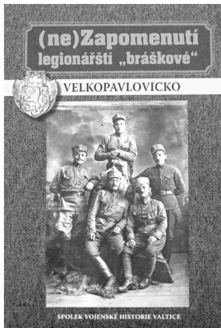
Kniha (ne) Zapomenutí legionářští bráškové – Velkopavlovicko.

Kniha obsahuje přes 40 osudů legionářů, vojáků či pracovníků československé zahraniční armády v letech 1914–1920, spoustu fotografického materiálu doplněného mapami a odkazy na místa, kudy prošli za Velké války rodáci šesti obcí Velkopavlovicka – Bořetice, Horní Bojanovice, Němčičky, Kobylí, Velké Pavlovce a Vrbice.