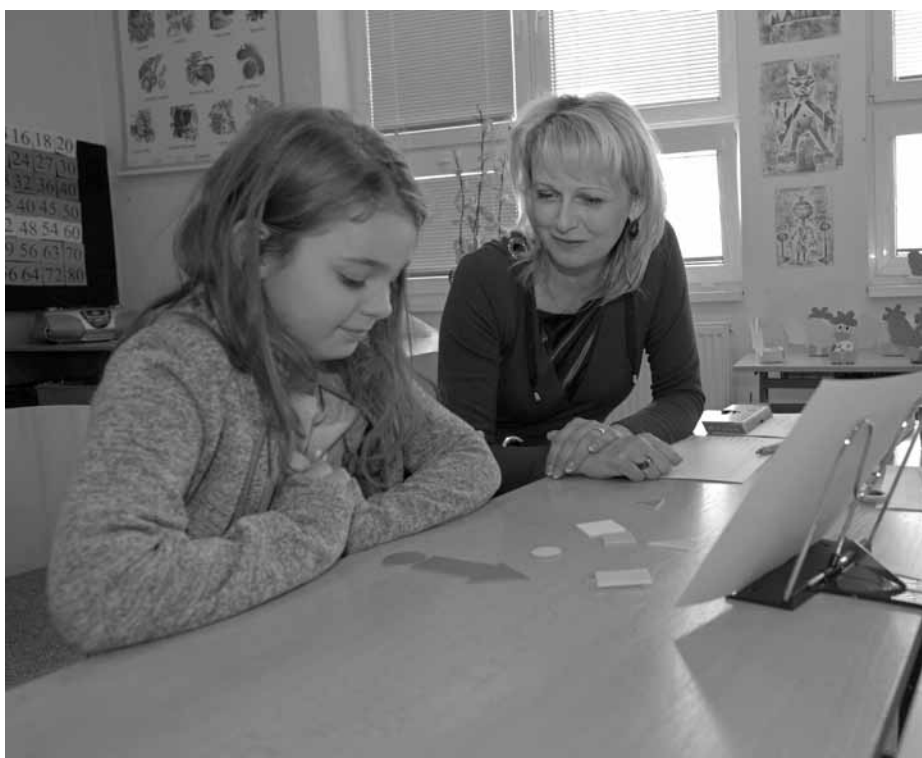
Zápis do školy – první velký krok vstříc školnímu vzdělávání a současně také slavnostní den pro celou rodinu každého předškoláčka.

Za kolektiv vyučujících Mgr. Eva Drienková