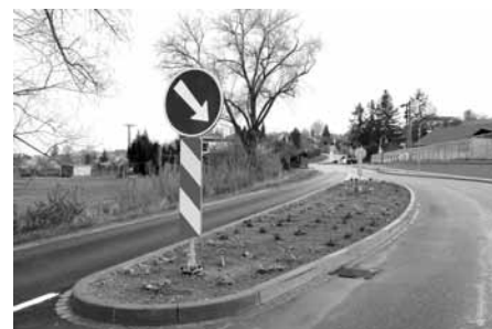
Zpomalovací ostrůvek při vjezdu do města od Němčiček – bezpečnostní a zároveň estetický prvek.