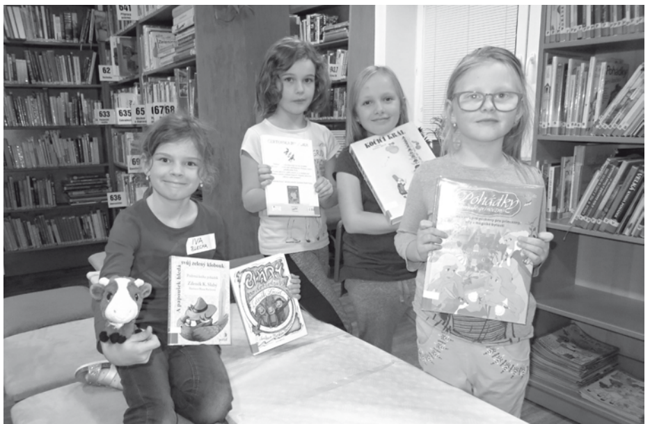
Noc s Andersenem je především o knihách a čtení. Letos se stala „knihou knih“ knížka Já Baryk Františka Nepila.

17:45 * Plyšový pes Baryk vítá děti na pultu. Lepím dětem štítky se jménem, aby se navzájem poznaly (a hlavně abych já věděla, kdo je kdo). Rodiče se hodí leda tak na nafouknutí karimatky, žádné velké rozloučení se nekoná, aspoň ne ze strany dětí.