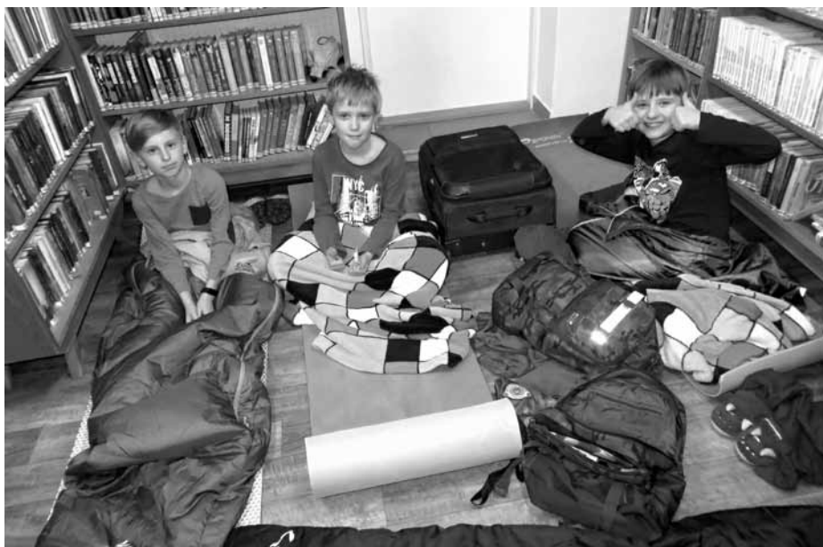
Noc s Andersenem je úžasným zážitkem díky dobrodružnému nocování mezi knihami.

18:05 * Ze zadní části knihovny je noclehárna, přes spacáky není vidět podlaha. A máme první úraz v podobě srážky čela s regálem. To nám to dobře začíná, a to rodiče odešli ani ne před pár minutami.