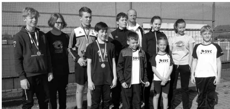
Mladí velkopavlovičtí badmintonisté na turnaji v Kunovicích.