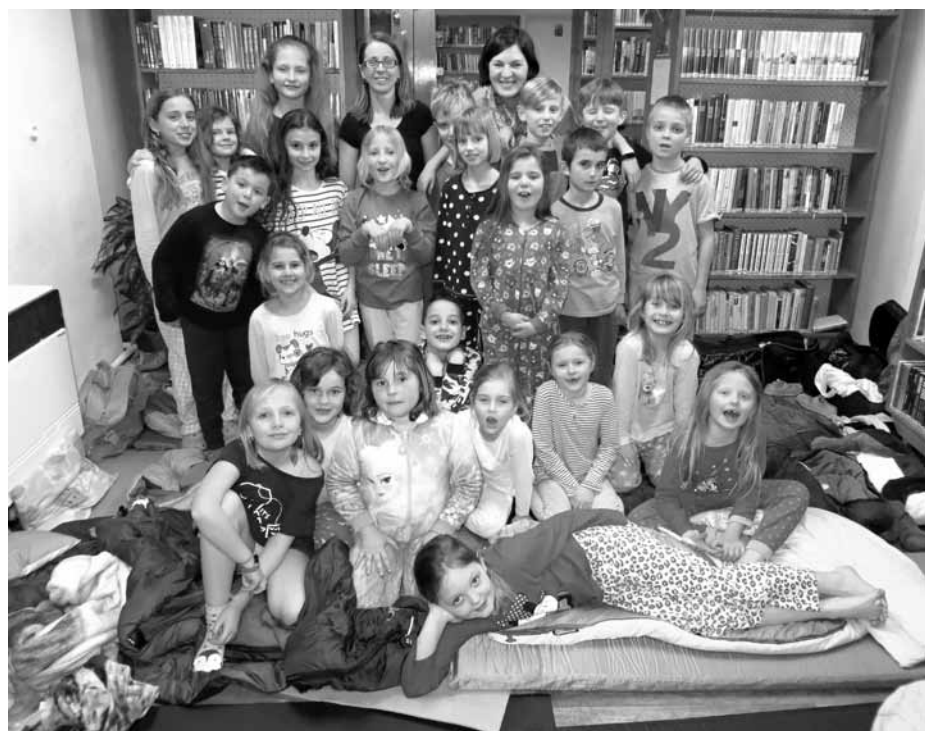
My všichni jsme nocovali s Andersenem, pejskem Barykem a hlavně s knížkami. Spočítáte nás?

23:45 * Někdo klepal. Aspoň podle dvou posledních nespících dětí, a to na dveře, co vedou dozadu do skladu. Vysvětluji, že tam opravdu nikdo není a návštěvy že by přišly hlavními dveřmi. A že je vrátím rodičům rovnou v pyžamu, jestli okamžitě nezalehnou.