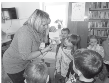
Třída Kofátek objevila při své dobrodružné výpravě do knihovny poklad plný zlatáků.

Z počátku se děti trochu divily, co má společného poklad s knihovnou, ale protože jsou bystré, rychle přišly na to, že knihovna je obrovský poklad pro někoho, kdo má moc rád knížky. A jeden takový „tištěný poklad“ jsme si spolu přečetly. S dětmi jsme vešly do příběhu o holčičce, které chyběl kamarád na hraní, až ho našla v prapodivném tvorovi, kterého nazvala Momo. Stránku po stránce jsme si interaktivně povídaly o příběhu a užily jsme si spoustu legrace. Odhodlání a nezdolnost Lily ukázaly dětem, že přátelství dá i trochu práci a že vlastní představy o tom, jak si hrát, občas musíme sladit s kamarády. A nakonec se děti dočkaly i tak vytouženého opravdového pokladu – našly totiž za knihou ukrytou truhlič-