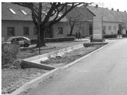
Nové podélné parkovací stání u kostela na ulici Dlouhá.

Ve třetí dekádě měsíce března se pracovníci stavební skupiny služeb města věnovali práci na výstavbě nových parkovacích míst podél kostela na ulici Dlouhá. Doufáme, že nové parkoviště uleví jednak zaměstnancům škol, rodičům školou povinných dětí, ale i zákazníkům nedaleké prodejny domácích potřeb U Crháků nebo občanům navštěvujících bohoslužby v sousedícím kostele.