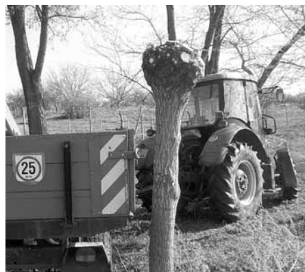
Vrba ostříhaná tzv. „na hlavu“.

Navzdory větrnému počasí, které nás trápiho takřka celý březen a ani začátkem dubna si nedalo říct, vyrazili pracovníci služeb města do terénu, do Biocentra Zahájka, aby zde zahájili každoroční pravidelný jarní omlazující ořez vrby.