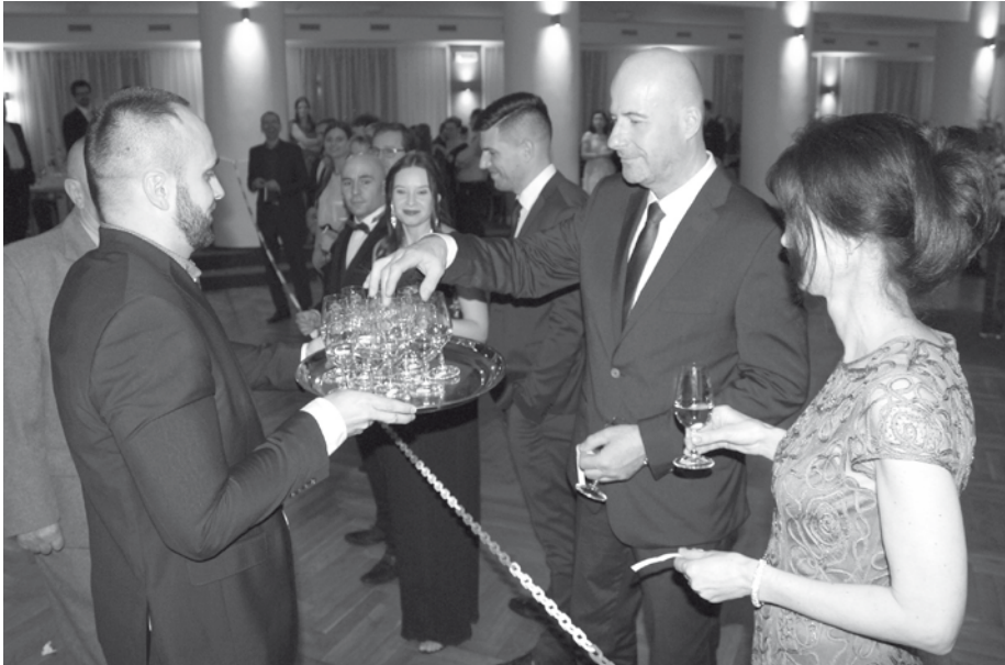
Půlnoční hřeb Společenského plesu Modrých Hor – bohatá tombola plná hodnotných a také velmi praktických cen.