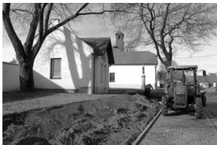
Terénní úpravy podél nového parkoviště mezi kostelem a hasičskou zbrojnicí.

se mezi chodníkem a hřbitovně zdí a současně byl položen přístupový chodníček k hasičskému domovu.