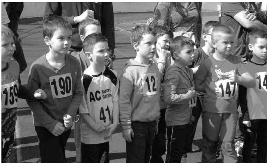
Bylo skvělé vidět na startovní čáře tolik mladých běžců z Velkých Pavlovic. Za rok ještě víc!

ku a skandování vítání za necelých devatenáct minut. Traťové rekordy sice nebyly pro letošek překonány, ale i tak jsme se dočkali krásných výsledků a rychlých časů.