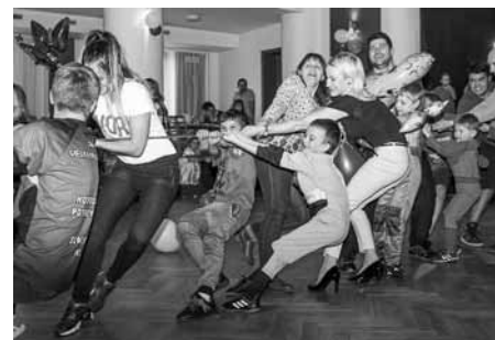
Dětská maškarní diskotéka nebyla zábavou pouze pro děti, bavili se i rodiče!

Stalo se už příjemnou tradicí, že členové Sboru dobrovolných hasičů z Velkých Pavlovic pořádají každoročně dětskou maškarní me-rendu s diskotékou pro děti. Stejně tomu tak bylo i letos. Dětský maškarák se uskutečnil v neděli dne 7. března 2019 a musíme potvrdit, že se úžasně vyvedl. Účast dětí v maskách byla vysoká, drobtina si zasoutěžila, zatancovala a také rodiče se aktivně zapojili. Skvěle odpoledne! Za rok se těšíme znovu!