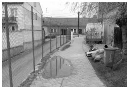
Chodník před opravou – na takové louže už mezi Pekárnou Pláteníková a prodejnou potravin COOP už nenarazíte.

Ve městě je několik pěších uliček, které jsou chodci využívány velmi často a jsou tak pro ně velmi důležité. Patří mezi ně i ulička od obchodního domu COOP k pekárně paní Pláteníkové.