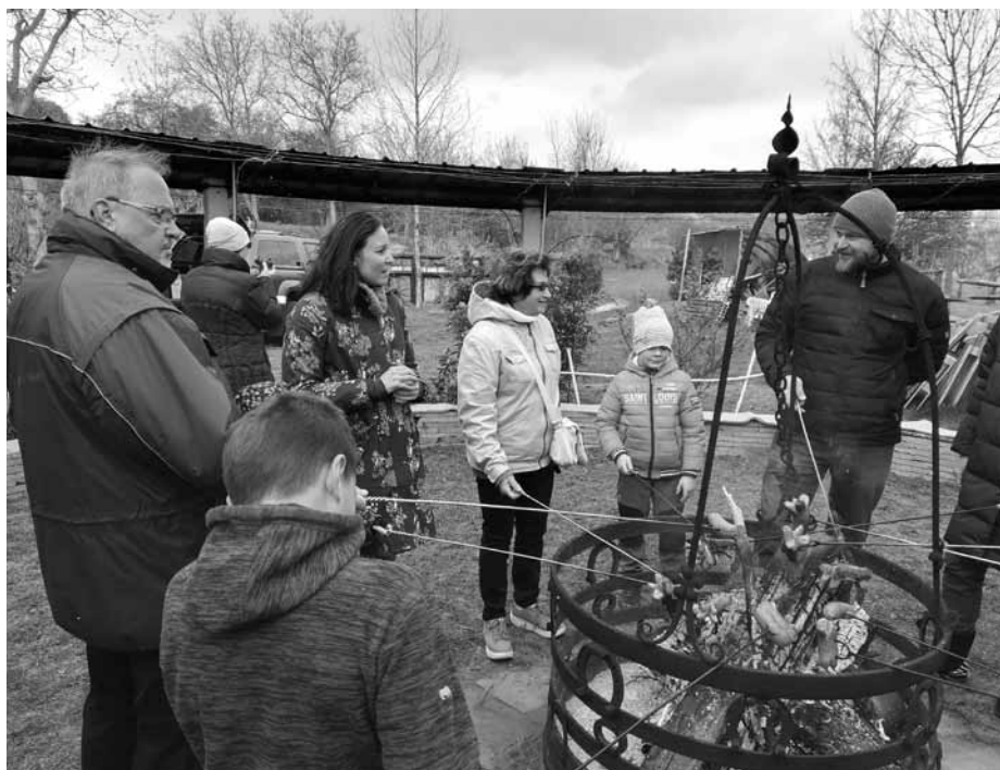
Opékání špekáčků nad otevřeným ohněm na ranči, tof nedílná součást každé Jarní šlapky. Do voňavé křupavé pochoutky se s chutí zakousnou malí i velcí!