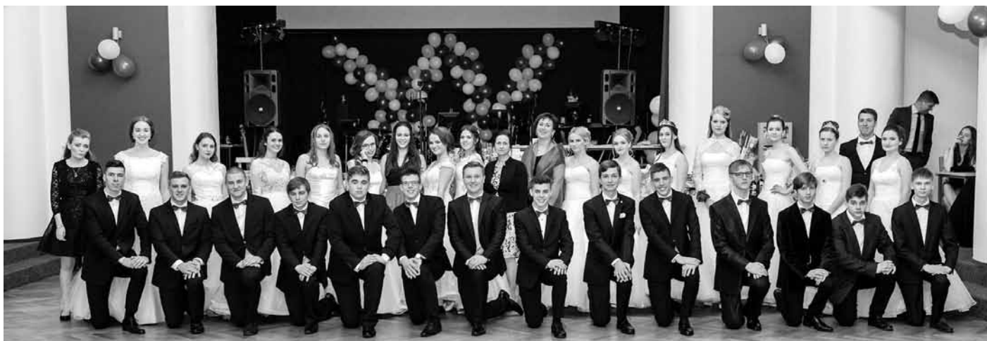
XV. studentský ples – také letos jej uspořádali studenti tříd septima a 3.A.