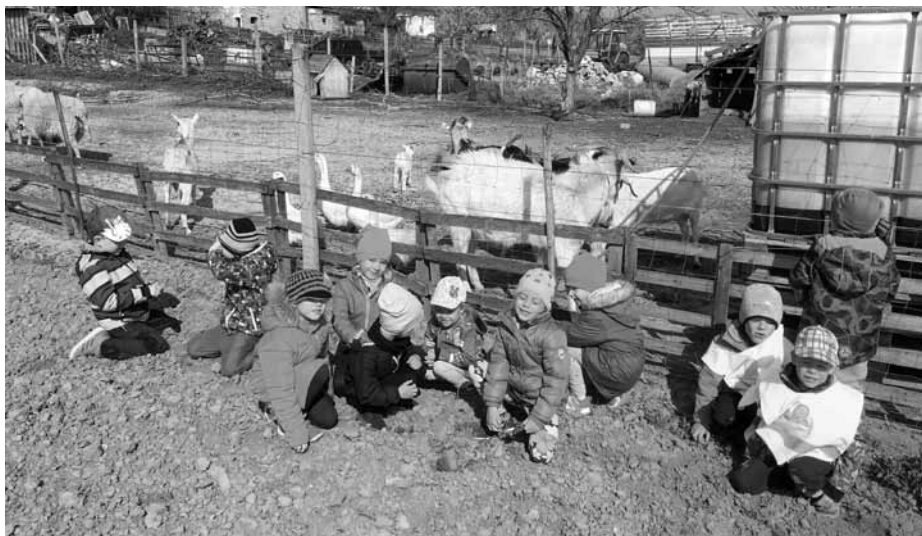
Jaro je tím nejlepším obdobím pro poznávání zvířátek.