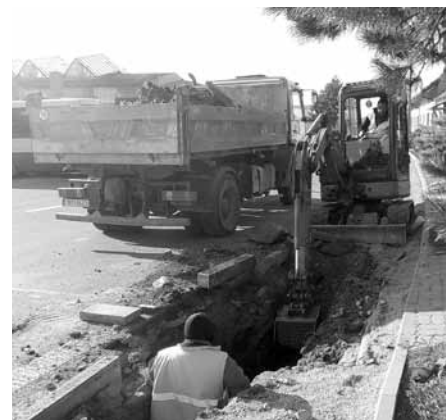
Oprava vodovodu v ulici Za Dvorem – výkopové práce.

Ve čtvrtek dne 4. dubna 2019 byla ve Velkých Pavlovicích zahájena nová stavba, a to rekonstrukce vodovodního řádu v ulici Za Dvorem, od kruhového objezdu po křižovatku s ulicí Střední.