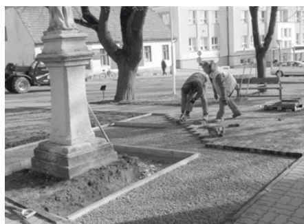
Před kostelem byla rozšířena plocha pro pozůstalé při pohřbech.

Začátkem měsíce března byly pracovníky služeb města zahájeny práce na položení nové