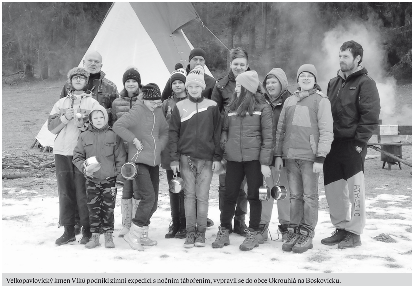
Velkopavlovický kmen Vlků podnikl zimní expedici s nočním tábořením, vypravil se do obce Okrouhlá na Boskovicku.

bude rizoto, a tak někteří z nás připravují oběd a ostatní se po nasbírání dostatečného množství dřeva učí tábornickým dovednostem, jako je práce s nožem a sekyrkou a také rozdělávat a udržovat oheň. Pak ještě proběhne přírodovědná procházka v okolí tábořiště se sledováním stop zvěře a důsledků jejich chování v přírodě a taky se učíme pozorovat a poznávat stromy v zimním období.