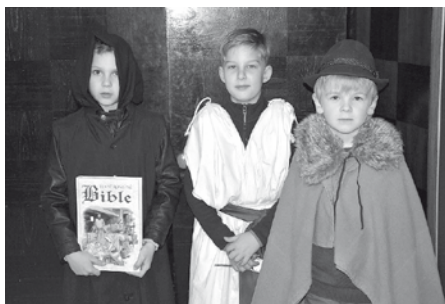
Velkopavlovický kostel počtila vzácná návštěva, postavy z příběhů a stránek bible.