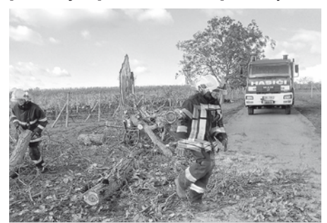
Velkopavlovičtí hasiči likvidují škody způsobené vichřicí pod rozhlednou Slunečná.

Silný vítr, který se prohnal v neděli 29. října 2017 Českou republikou neminul ani naše město. Hasiči odstraňovali dvě ulomené větve na komunikaci směrem na Němčičky, spadlý strom na účelové komunikaci pod rozhlednou Slunečná, ulomenou polovinu stromu v ulici Příční a také smotali a pověsili do bezpečné výšky drát v ul. Růžová, který dříve pravděpodobně sloužil pro veřejné osvětlení. Zaznamenáno bylo obrovské množství drobnějších škod, jako například popadané tašky ze střech domů, dokonce i kostela, po ulicích města se povalovaly odfouknuté popelnice a jiné pevně neukotvené předměty.