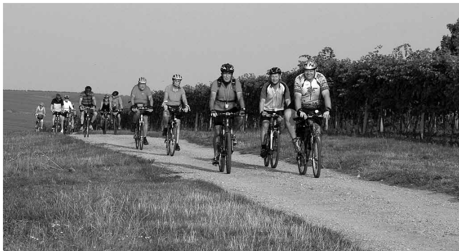
Jedni z prvních pokořitelů cyklostezky Modré Hory. Ve svých začátcích byla v mnoha úsecích vedena po polních cestách. Ty brzy nahradily kvalitní, pohodlné a bezpečné asfaltové cyklostezky.