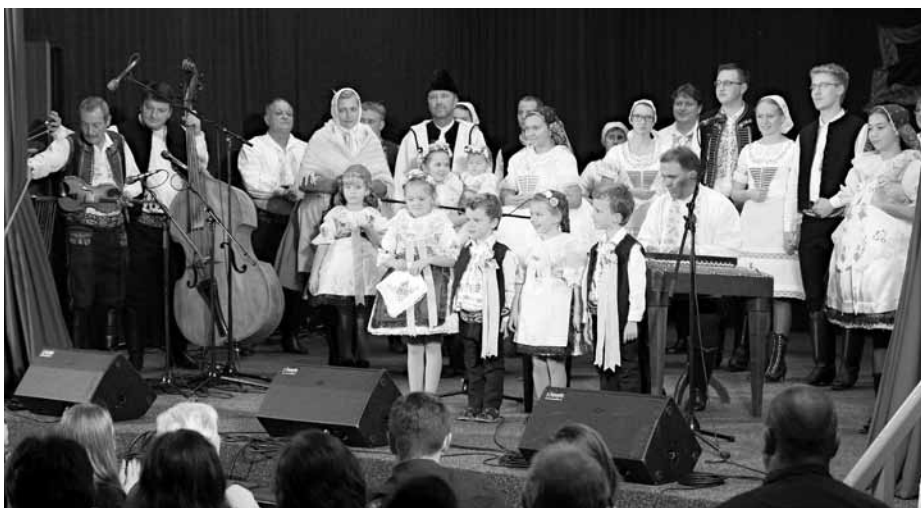
Komu koluje tělem krev „ochucená“ folklórem na vzpomínkovém koncertě rozhodně nechýběl. Ať už jako vystupující na podiu, nebo jako divák v hledišti.

Současně jsme také vzpomněli i na další velkopavlovické nositele tradic a lidové řemeslníky, kterým jsme touto cestou poslali naše velké díky za obětavost, trpělivost a píli při jejich neúnavné práci.