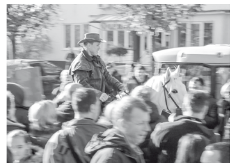
Úderem jedenácté hodiny, jedenácté minuty, jedenáctého jedenáctý přijel na velkopavlovické náměstí svatý Martin na bílém koni, vítaly jej davy milovníků vína.