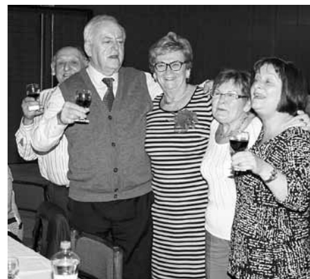
S přáteli, skleničkou vína a výbornou náladou... A pak že není stáří krásné!

2017 své kamarády a známé ze spřátelené Senice. Do našeho partnerského města se vydali na pozvání Jednoty důchodců Senice na již tradiční a hlavně velmi oblíbený Mikulášský večírek. Všichni zúčastnění se skvěle bavili a při zpěvu, tanci a čilém hovoru jim večer uběhl snad až příliš rychle. Jakmile nastal čas odchodu, bylo ze všech stran slyšet, že se neloučí na dlouho a že se již těší na další setkání.