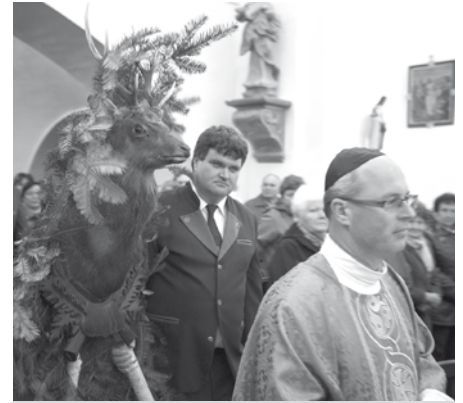
Slavnostní Svatohubertská mše za účasti velkopavlovických myslivců v kostele Nanebevzetí Panny Marie.