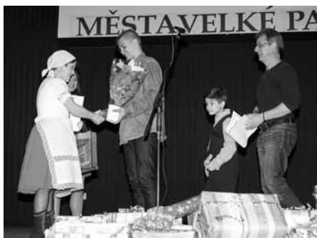
Slavností a dojemné předávání nejen finančních vánočních dárečků zástupcům a dětem z Dětského domova ve Štitech.

V programu dobročinně vystoupily místní soubory. Zástupci těch nejmladších byli rovnou tři a to dětské folklórní soubory Floriánek