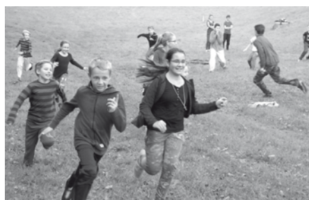
Každá „Víkendovka“, nejen ta letošní podzimní – velikonoční, je plná smíchu, radosti a pohybu na čerstvém vzduchu.