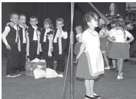
Folklorní soubor Sadováček obohatil milým a rozverným vystoupením program Benefičního koncertu pro děti z dětského domova ve Štítech.

V měsíci říjnu ukončily děti plavecký výcvik v Hustopečích a obdržely diplom „Vodníčka s hrníčky“ s nálepkami za splněné disciplíny.