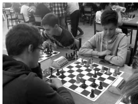
Pekelné soustředění nad čtyřiašedesáti poli vyneslo velkopavlovickým kýženě zlato.