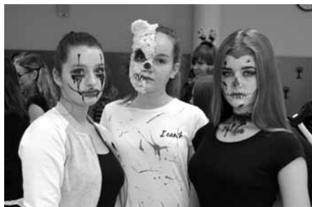
Jindy líbezná slečny ze třídy kvarta o Halloweenu naháněly hrůzu! Jejich propracované masky si jednoznačně zasloužily ocenění.

Oba talentovaní studenti úspěšně obstáli v silné konkurenci 1790 studentů ze 47 zemí. Společně s nimi postupuje 150 ruštinářů z celého světa, např. z USA, Španělska, Itálie či Izraele, až po Mongolsko, Vietnam a Čínu. Z ČR se podařilo postoupit celkem 4 studentům ruštiny. Všichni se utkají ve finálovém kole v Moskvě v prostorách Puškinova institutu ruského jazyka, pořadatele již patnáctého kola mezinárodní soutěže. Soutěž je podporována Ministerstvem školství a kultury RF, Mezinárodní asociací učitelů ruského jazyka a Rossotrudničtvem.