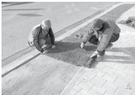
Ozelenění prostor u školy prostřednictvím travnatých pásů.

Dodavatel stavby chodníku u školy, Stavby RUFA, s.r.o., měl ve výkazu výměr také osetí hlíny travním semenem. Nakonec však bylo rozhodnuto o položení vzrostlých travnatých pásů, které zaručují po zakořenění do podkladové zeminy vyšší kvalitu trávy. Podkladová zemina byla před položením trávy vyměněna za požadovanou směs písku a kvalitní hlíny.