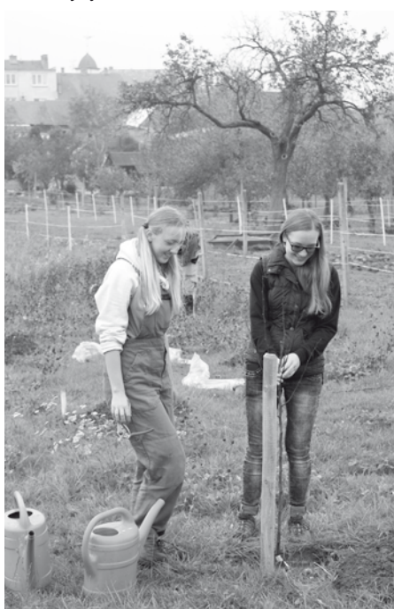
Z farní zahrady ovocný sad... Na první úrodu si však budeme muset pár let počkat.

Pro omlazení farní zahrady byly pokáceny dvě přestálé jabloně ve špatném zdravotním stavu a během pátku a soboty (20. a 21. 10. 2017) zde mladí farníci vysázeli 28 nových stromků. Další výsadba 38 stromků byla naplánována za necelý týden.