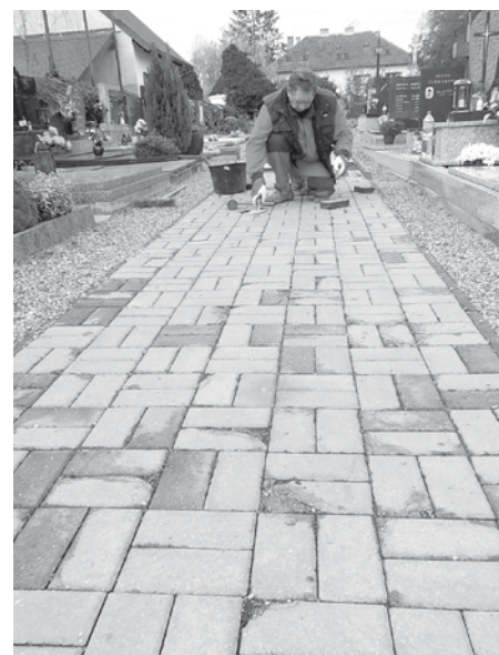
Letošní přípravy hřbitova na dušičky byly náročnější než obvykle. Havarijní stav zámkové dlažby na některých úsecích chodníků si vyžádal radikální zásah – kompletní předláždění.

Návštěvníci místního hřbitova si možná všimli, že se tu a tam začaly rozpadat kostky zámkové dlažby na chodníku. V jednom místě se chodník zapříčiněním vyhnílého kořene stromu dokonce propadl, a tak byla právě v tomto místě provedena pracovníky služeb města kompletní výměna dlažby. Zbylé, starší a nepoškozené kostky byly použity na výměnu zničených kostek na jiných místech.