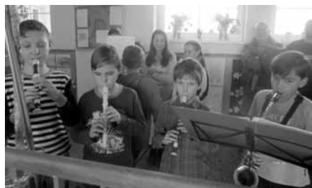
Kluci školáci se zhostili adventního muzicírování.

Program v dílnách byl opravdu pestrý. Děti si mohly vyrobit Mikuláše, čerty nebo andělíčky