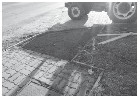
Oprava chodníku na ulici Nádražní – dnes je už zcela bez bariér.

Stavební skupina Služeb města Velké Pavlovic se v polovině měsíce listopadu věnovala opravě chodníků, čímž byla zajištěna jejich plná bezbariérovost. Práce spočívaly ve sklopení doposud vyčnívajících obrubníků do vodorovné polohy. Tímto krokem se plochy chodníků dostaly do roviny a nyní jsou lépe schůdné a sjízdné pro invalidní občany, invalidní vozíky, dětské kočárky, ale také pro stroje zajišťující letní i zimní údržbu chodníků a okolních ploch.