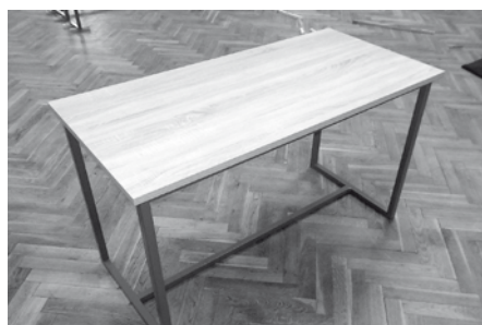
Nově opravený stůl v sokolovně.

Výměna desek stolů rozhodně nebyla poslední obměnou inventáře majetku sokolovny. Rada města vybrala v úterý 31. října 2017 dodavatele 300 židlí. Ty dodala ze čtyř oslovených firem BUKOTEC ze Strážnice. Cena jedné židle je 1.589 Kč vč. DPH a také včetně dopravy. Město V. Pavlovice, co by zadavatel zakázky, stanovilo následné podmínky výběrového řízení – židle musí být dodány kompletně složené, dřevo bukové, povrchová úprava mořením (šedá antik nebo obdobná) a lakováním transparentním