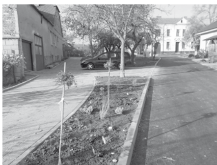
Ulice U Zastávky v novém – krásný hladký povrch vozovky, široký chodník i závěrečná výsadba zeleně.

Koncem měsíce října 2017 byla položena první vrstva živičného povrchu v ulici U Zastávky, den na to položili pracovníci firmy STRABAG druhou, finální vrstvu. Poté už jen zbývalo dodlážit chodník a dokončit terénní úpravy.