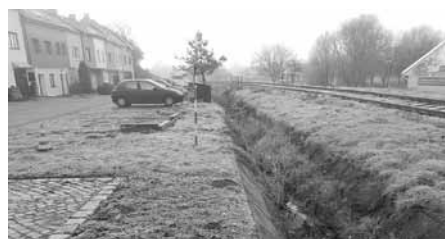
Zanesený a zarostlý odtokový žlab v ulici Nad Zahrady těsně před zahájením listopadového čištění.

Odtokový žlab u sklepů pod Šlechtitelskou vlnařskou stanicí - Penzionem André, podél koleji ČD, byl již delší dobu zanesen značným množstvím bláta a plevele. Proto bylo koncem měsíce listopadu s místní firmou Štambacher, s.r.o. dohodnuto jeho hrubé vyčištění s tím, že následné dočištění bude provedeno ručně. Takové práce v takřka zimním období však závisí na počasí a venkovní teplotě.