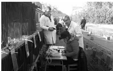
O výstavu drobného domácího zvířectva byl nečekaně velký zájem. V hojném počtu se přišli podívat úplně všichni, bez rozdílu věku.

Od pátku do neděle, ve dnech 3. až 5. listopadu 2017, se ve velkopavlovické chovatelské hale konala u příležitosti oslav 60. výročí vzniku ZO ČSCH Velké Pavlovice a 50 let města Velké Pavlovice Okresní výstava králíků, holubů a drůbeže. Čestné ceny za oceněná zvířata majitelům předal starosta města Jiří Otrěl.