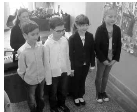
Den otevřených dveří na ZŠ se nesl na křídlech Vánoc, nemohly nezaznít koledy...

z papíru, ozdobit cukrovou polevou perníčky, „namramorovat“ si vánoční svíčku, vytvořit krabičku z ruličky od toaletního papíru, z pytlíčků od čaje vyráběly hvězdičky a přáníčka nebo navštívily alchymistickou dílnu.