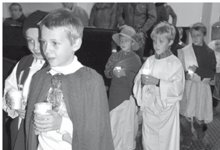
Díky našim dětem se proměnil kostelík v rozzářenou archu štěstí, radosti a lásky.

V pátek 3. listopadu 2017 do kostela Nanebevzetí Panny Marie zavítala vzácná návštěva z nebe. Tradiční dětská mše svatá byla zahájena průvodem svatých a světic. Děti se nastrojily do kostýmů dle svých křesťanských patronů.