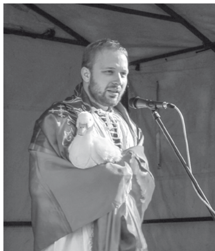
Co by to bylo za svatého Martina bez pořádné vykrmené husičky!