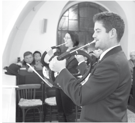
Trubači Okresního mysliveckého svazu Přerov proložili mši přenádhernými hudebními skladbami.