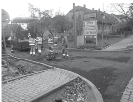
Ulice U Zastávky během rekonstrukce – pokládka živičného povrchu.