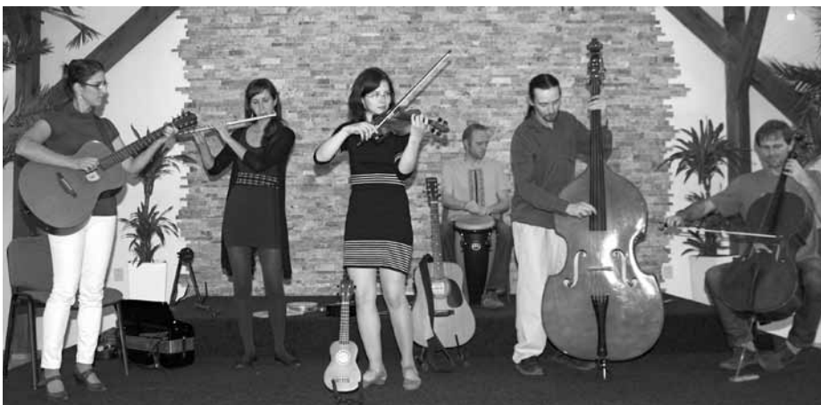
Hudebního doprovodu podzimní vernisáže se excelentním způsobem ujala folková skupina V hnízdě rej z Kobylí.