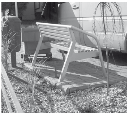
Nová lavička před hlavním vchodem do mateřské školy na ulici V Sadech.