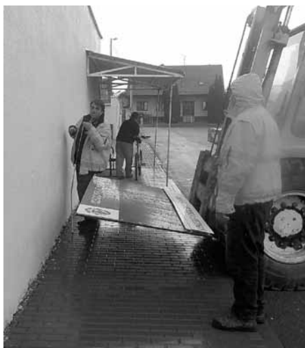
Instalace infotabule s nabídkou kulturních akcí na autobusové nádraží.

kují, bude postačovat pouze přelepení data. Aby nebylo náročné uskladňování samotných plat s názvy akcí, budou oлеpeny z obou stran.