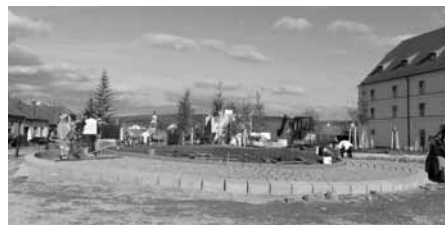
Nový kruhový objezd byl vystavěných ze starých původních žulových kostek.

Část původní žulové dlažby z ulice Brněnská získalo nové uplatnění, stalo se součástí nového kruhového objezdu. Částečně pojízdný středový prsteneček pro nadměrná vozidla byl vydlážděn právě z těchto žulových kostek.