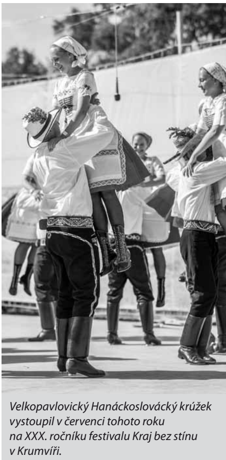
Velkopavlovický Hanákoslovácký krúžek vystoupil v červenci tohoto roku na XXX. ročníku festivalu Kraj bez stínu v Krumvíři.

vali autenticitu tance, především hanákoslováckého regionu tak, jak je mohli tancovat i naši předkové. K tomu našim tanečnickům pomáhá i teoretická znalost daného regionu. V některých folklorních souborech se můžeme setkat s tím, že tanečníci sice perfektně technicky zvládnou choreografii určitého tance, ale o tanci samotném, jeho účelu, smyslu, potažmo jeho původním regionu, neví nic. A tomu se snažíme vyvarovat. Tanečník musí především vědět, co tancuje. Jeho výkon je pak souhrnem několika faktorů, které se podílejí na konečné podobě tance.