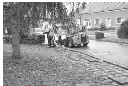
Zahajovací práce na opravě chodníku – ulice Bezručova.

Také ulice Bezručova se v měsíci listopadu dočkala zahájení nutné opravy chodníku. Pracovníci služeb města demontovali staré klasické chodníkové dlaždice, následovalo vybagrování podkladu, osazeny byly nové obrubníky, navedeno kamenivo na spodní podkladové vrstvy kufru a poté byla položena nová zámková dlažba.