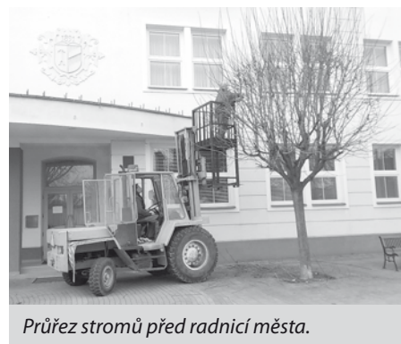
Průřez stromů před radnicí města.

Pracovníci zahradnické skupiny služeb města se pustili s koncem měsíce listopadu do úpravy korun stromů, které se nacházejí na Náměstí 9. května před radnicí. Úprava spočívala v průřezu větví a jejich následného vytvarování do pohledného tvaru. V tomto případě se dostalo tamních korunám osvědčeného sestřihu „do kulata“.