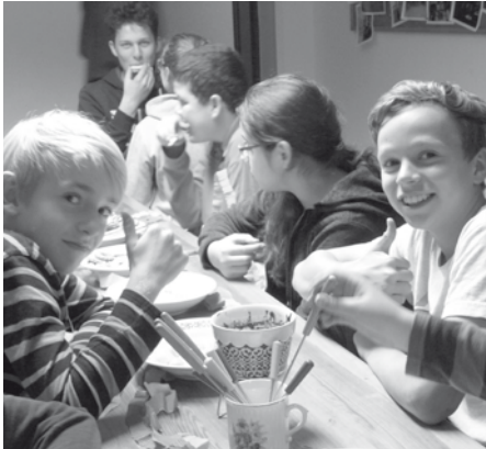
Co dáme poslední „Víkendovce“? Jednoznačně „palec nahoru“!

doucí měli totiž nachystané stanoviště ještě na zbylých 7 zastavení křížové cesty. Všechny tři skupiny úspěšně prošly všechny úkoly a odměnou jim večer byl špekáček u táboráku.