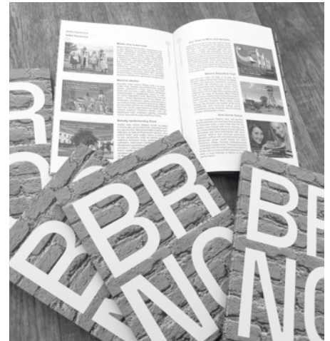
Brožura TO JE BRNO – druhé vydání bez na ostří nože vyhrocených příspěvků.