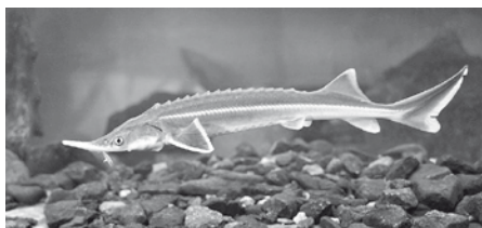
Jeseter malý, nový obyvatel jezírka v zahradě Ekocentra Trkmanka.

Jezírko u ekocentra po kratší odmlce znovu ožilo. Tentokrát nebudou návštěvníci hledat hojně chované Koi kapry, ale mohou se pokochat pohledem na majestátně plovoucí Vyzu velkou, Jesetera sibiřského, Jesetera hvězdnatého, Jesetera malého albína, Jeseny modré, Jeseny zlaté. V nejbližší době je ještě doplní malé hejno Ostroretok stěhovavých. V jezírku bylo instalováno výkonné čerpadlo, díky kterému již konečně zurčí voda v malém vodopádu. Věříme, že naši malí „rybí“ obyvatelé potěší oko malého i velkého návštěvníka, a jezírko se nám podaří dlouhodobě udržovat v současném stavu. Jezírko je nově střeženo kamerovým systémem.