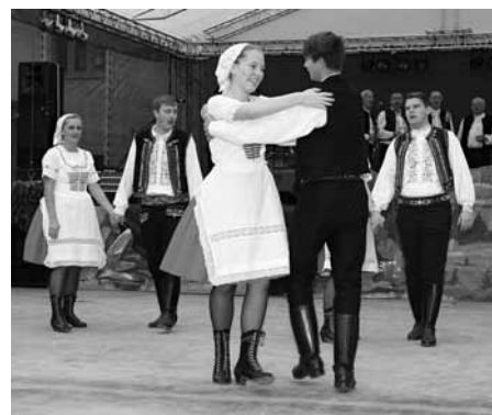
Na slavnostech nechyběl ani Hanákoslovácký krúžek.

kopavlovické vinobraní utíkají z megalomanských akcí, jaké jsou kupříkladu v Mikulově či ve Znojmě, právě proto, že je u nás slavnost komornější, klidnější a užijí si zde do syta všeho, za čím je srdce táhne. A to je hlavně burčák, folklór a tradice. U nás najdou vše jmenované, devizou je klid, pohoda a vítaná absence davů.