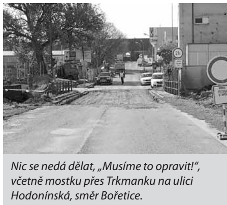
Nic se nedá dělat, „Musíme to opravit!“, včetně mostku přes Trkmanku na ulici Hodonínská, směr Bořetice.

Jak již bylo řečeno dříve, celá stavba je rozdělena na několik úseků. Na rozestavěném úseku ve Velkých Pavlovicích na ulici Brněnská, byly odfrézovány asfaltové konstrukční vrstvy a byla vytěžena dlažební kostka. Po upravení pláně byla po obou stranách vozovky zřízena drenáž a byly vybudovány nové dešťové vpusti (včetně nových přípojek do kanalizace) pro odvedení vody z vozovky. Zároveň byly zahájeny zemní práce na budoucí okružní křižo-