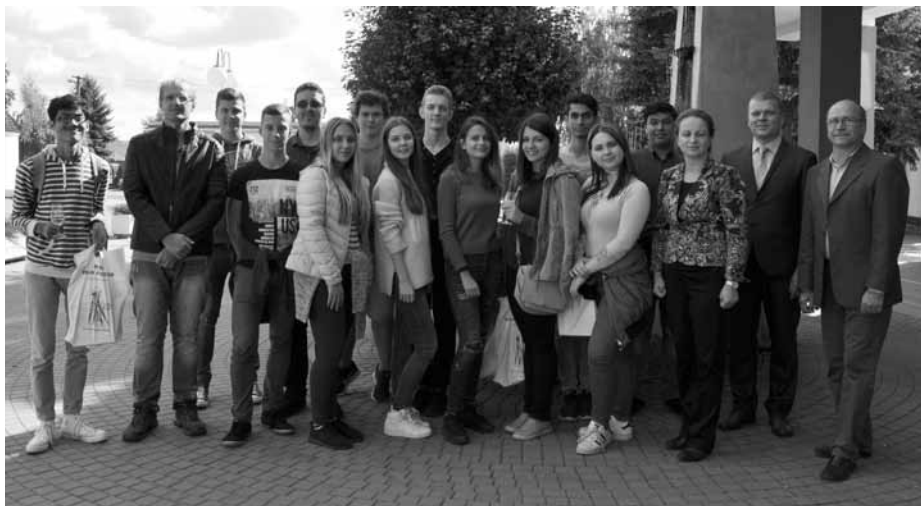
Naši nyní již přátelé z cizích zemí, anglicky mluvící studenti mezinárodního projektu Edison, navštívili nejen gymnázium, ale také radnici města.

Seznamovací kavárnu jsem si užila. Sice mi bylo nepříjemné říkat o sobě několik vět, ale na druhou stranu se mi moc líbila spolupráce se staršími studenty. Přišlo mi, že se tím prolomila věková hranice. A seznamovací hry byly skvělé! Ani jednu z nich jsem nikdy před tím nehrála, ale užila jsem si je! A to hlavně proto, že byli jednoduché na pochopení, a při tom byli zábavné. Pro mě to rozhodně nebyl promarněný čas!