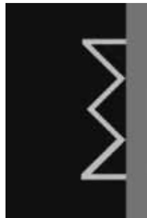
Zákaz zastavení, stání V 12a