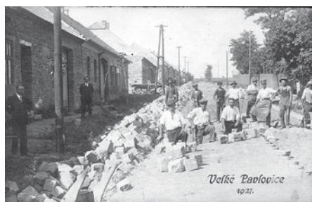
Ulice Brněnská v roce 1927...