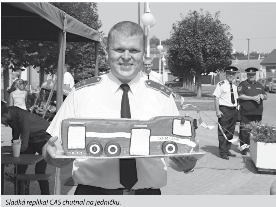
Sladká replika! CAS chutnal na jedničku.

Pořízení nového auta může být bráno i jako taková odměna – odměna pro hasiče. To ano, ale určitě je to dobrá volba pro celou společnost!