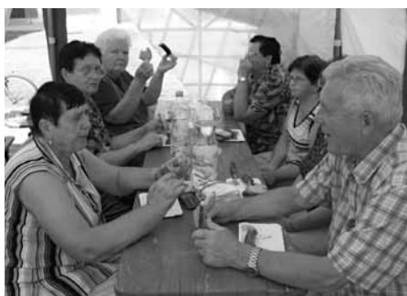
Jak mu kuchařské umění svědčí? Při pohledu na tento snímek netřeba komentáře!

Stejně jako prázdninové období zahájili, tak jej i ukončili... Babičky a dědečci z velkopavlovičského Klubu důchodců využili posledních slunných a teplých letních dnů konce srpna a pustili se do letošního závěrečného grilování s posezením pod širým nebem.