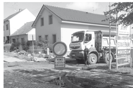
Ulice U Zastávky – budování nové vozovky.

V pondělí dne 18. září 2017 byla zahájena rekonstrukce vozovky a výstavba nového chodníku na ulici U Zastávky, v úseku od ulice Hlavní po můstek přes Trkmanka. Stavbu v hodnotě díla 4.200.000 Kč zrealizovala firma STRABAG a.s. Současně s touto stavbou proběhla také rekonstrukce veřejného osvětlení na této ulici.