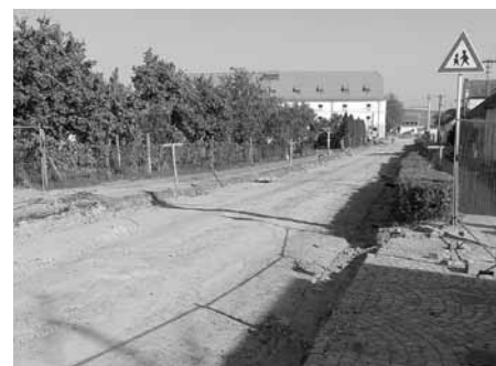
Generální rekonstrukce se dočkala i ulice Brněnská.

Zároveň se pracuje na úseku Terezín – Brumovice, kde na průtahu obcí Terezín je re-