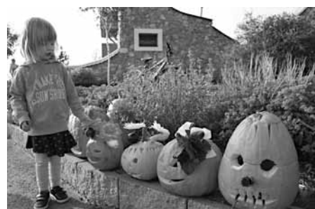
Dýňáci, svítilí podzimní strašidláci... Takových roztomilých krasavců se snad nikdo nemůže zaleknout.

Jako odměnu pro všechny, kteří pod rozhlednu v pátek přišli, připravili organizátoři ukázkou rytířské výbavy a rytířských soubojů, které předvedli chlapi z břevlavske skupiny středověkého bojového umění. Děti jsou kouzelně spravedlivé, protože nemohly připustit,