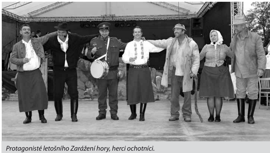
Protagonisté letošního Zarážení hory, herci ochotníci.