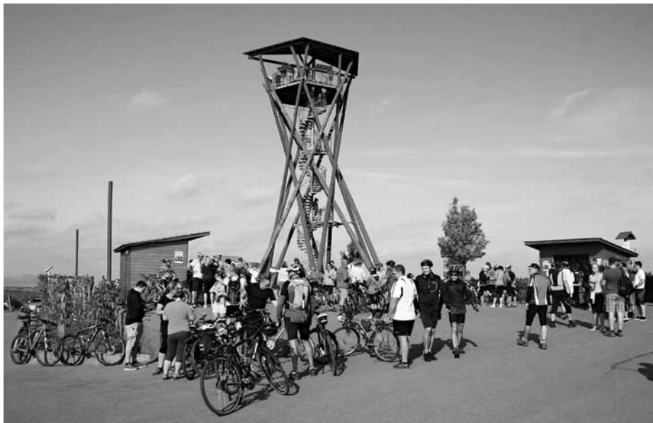
Putování za chutí i vůní burčáku bylo zahájeno pod velkopavlovickou rozhlednou Slunečná. Právě z ní je možné zhlédnout celé Modré Hory jako na dlaní.