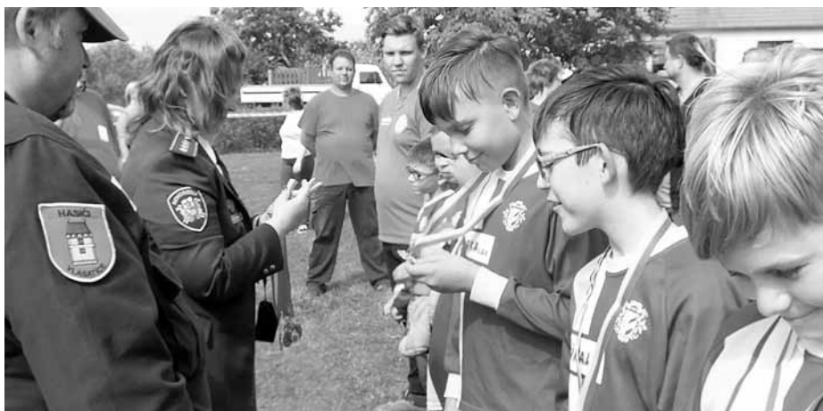
Hurááá, jsme druzí! A navíc s osobním rekordem.