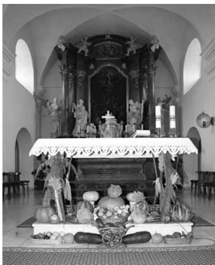
Kostel prozářilo a provonělo poděkování úrodě. Jako rok co rok v úvodu měsíce září.

V pondělí 25. září 2017 jednala v zasedací