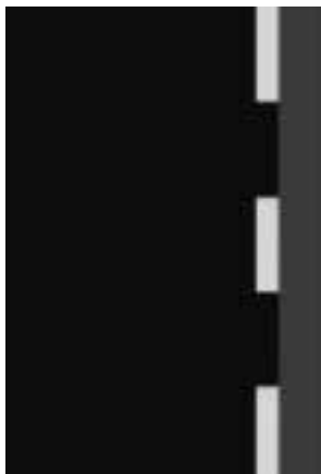
Zákaz stání V 12d