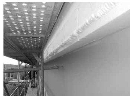
Střeška sportovní haly v závěru rekonstrukce. Snad je již problém se zatékáním a vlhkostí jednou pro vždy vyřešen!

Pokládka speciální fólie na střechu není žádnou novinkou. I v našem městě máme několik nemovitostí, kde byla tato technologie