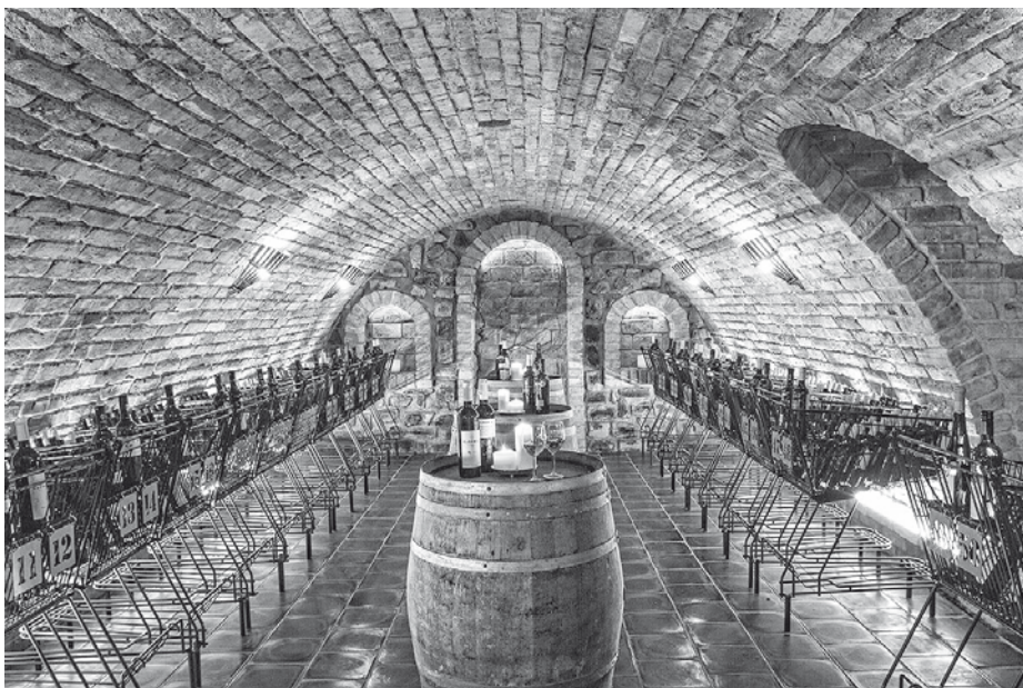
Nová GALERIE VÍN STARÁ HORA – tyto poklady se skrývají u bývalé cihelny na konci ulice Pod Břehy ve Velkých Pavlovicích.

Součástí galerie je vinný bar s kavárnou, kte-