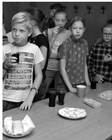
Kavárna, i když prvořadě seznamovací, se bez laskomin rozhodně neobejde! Jak vidno, občerstvení přišlo vhod.

buchty a bábovka již zdobily stoly. Po občerstvení následoval další program, ve kterém jsme si zahráli další seznamovací hry.