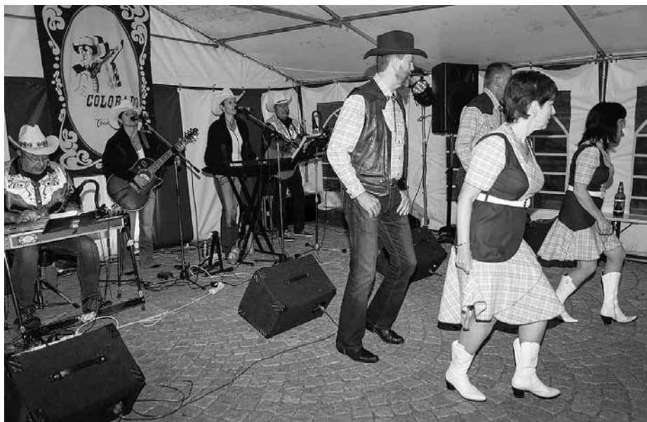
Country večer se skupinou Colorado.