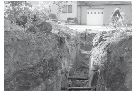
Výkop pro nový vodovodní řad na ulici Dlouhá.

V souběhu byly položeny přípojky k rodinným domům i hlavní řad. Napojení domů na nový vodovod však dojde až po všech potřebných zkouškách. Pokud bude přát počasí, mělo by to být do konce měsíce října.