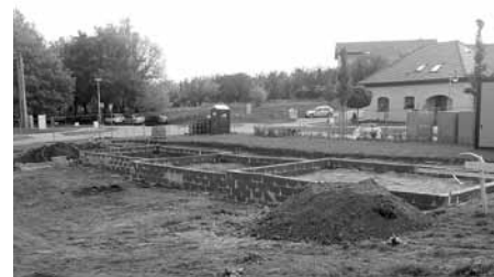
Výstavba nových bytů pro seniory na ul. Bří Mrštíků – budování základů.

V ulici Bří Mrštíků ve Velkých Pavlovicích v měsíci říjnu v rychlém tempu pokračovaly práce na stavbě betonových základů výstavby II. etapy bytů pro seniory. V prvním kalendářním týdnu tohoto měsíce potrápilo stavebníky nepřijemné deštivé počasí, kteří měli v plánu betonování základů stavby. Mokřý terén nedovolil vjezd těžkým vozidlům. Práce se tedy mírně zdržely. Po nich budou následovat další kroky – instalace odpadů a vylití betonové desky.