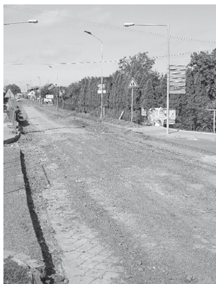
... a po 90 letech v roce 2017, v průběhu generální rekonstrukce.