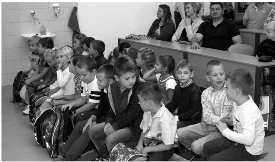
Poprvé ve škole... Prvnáčci uskutečnili svůj první krok vstříc dlouhé etapě svého života. Kéž je doprovází radost a štěstí!