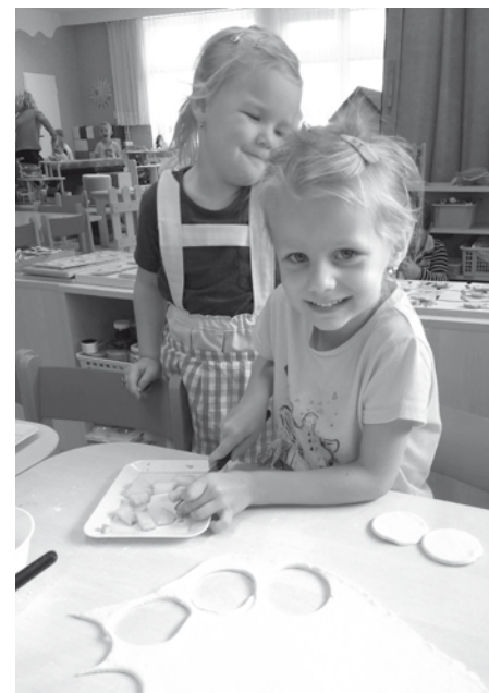
Ve školce se učíme i péct, třeba vynikající šátečky plněné jablčky. Určitě nám uvěříte, že to byla neuvěřitelná dobrůtka!

Ve dnech 2. až 4. října 2017 jsme uskutečnili první kolo soutěže ve sběru papíru „Třídíme s Hantáláčkem“, kterou každoročně vyhlašuje místní akciová společnost Hantály. Díky ro-