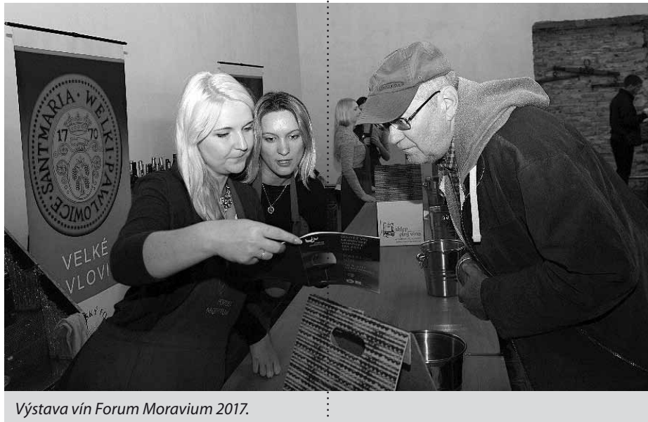
Výstava vín Forum Moravium 2017.

Vinobraní se vydařilo, což jednoznačně potvrzují reakce námi dotázaných návštěvníků místního infocentra. Ti se shodli, že na Vel-