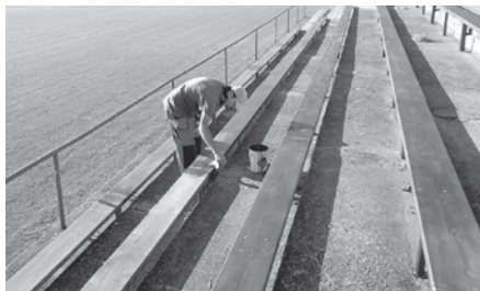
Nátěr nově nainstalovaných laviček na tribuně hlavního fotbalového hřiště TJ Slavoj.

ná v instalaci nových dřevěných laviček včetně ochranného nátěru.