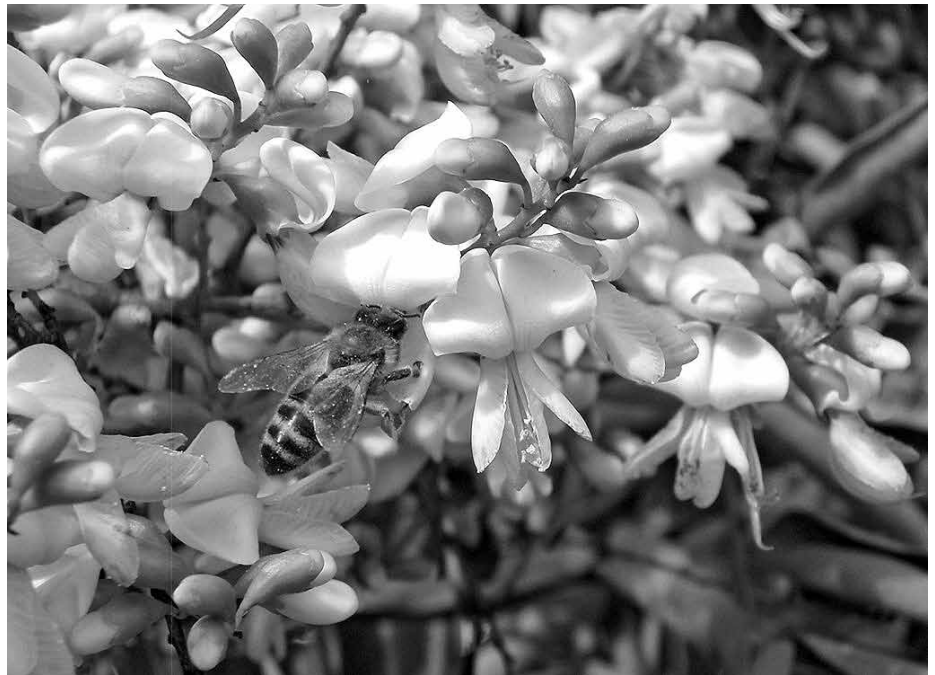
Jerlín japonský v záplavě květů a bzučících včel.

Tento strom je vedle své krásy i užitečný,