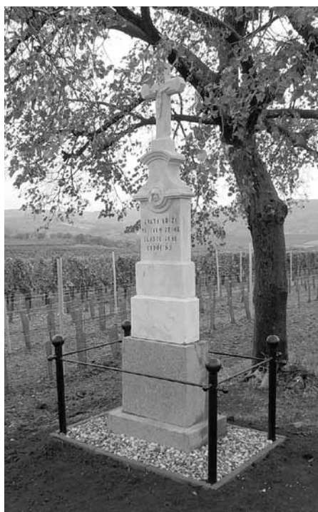
Opravený křížek mezi vinicemi září bělostnou novotou...