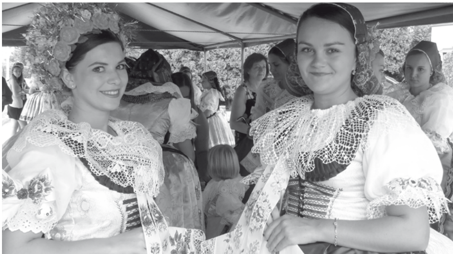
Velkopavlovický kroj v plné kráse, bohatě zdobený výšivkami.

Hanáckoslovácký krúžek, navazující na odkaz nositelů lidové kultury ve Velkých Pavlovicích, prosí všechny příznivce folkloru i ty, kteří jen uchovávají krojové součásti po svých předcích, o poskytnutí náhledu na tuto mizející krásu.