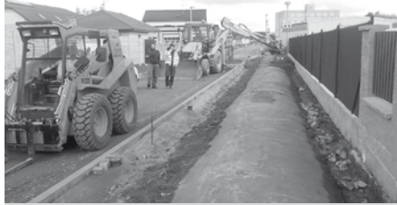
Ulice U Zastávky – atypické budování chodníku nad kanalizační rourou.

Výstavba chodníku v ulici U Zastávky se obešla bez problémů. Ty se ukázaly až během