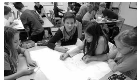
Z novopečených šestáků se na jeden den stali mořští vlci, stalo se tak v rámci adaptačního programu.